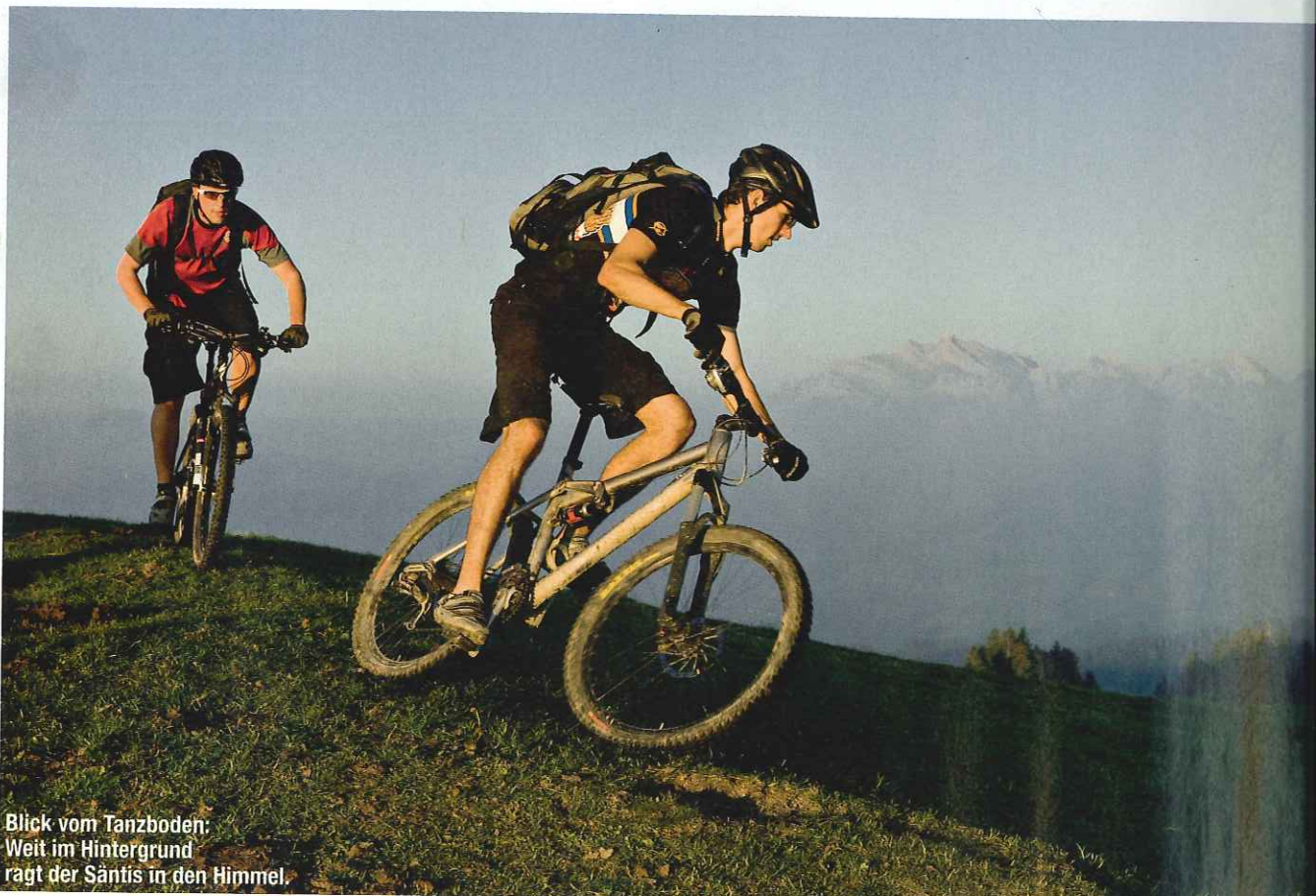
Blick vom Tanzboden: Weit im Hintergrund ragt der Säntis in den Himmel.