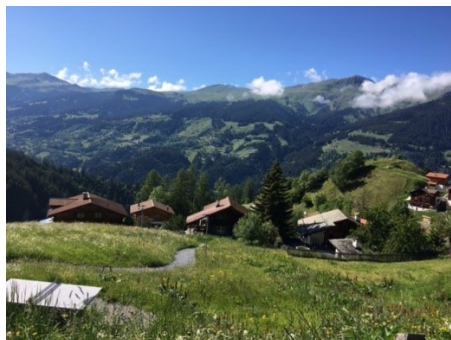
Ausblick von Tschierschen