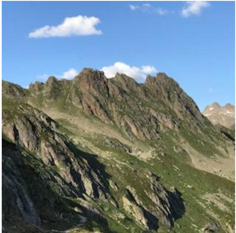
Chanzelgrat: Einstieg in der linken Lücke