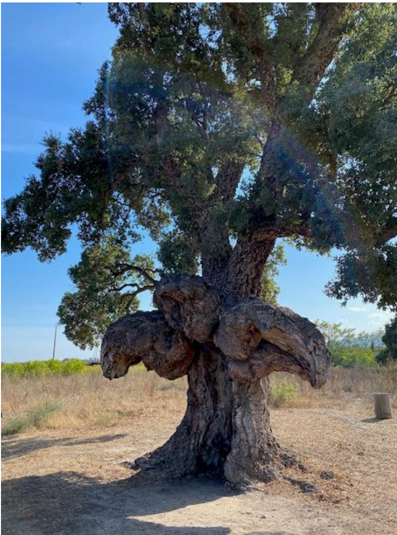
Alte Korkeiche in der Nähe von Ghisonaccia