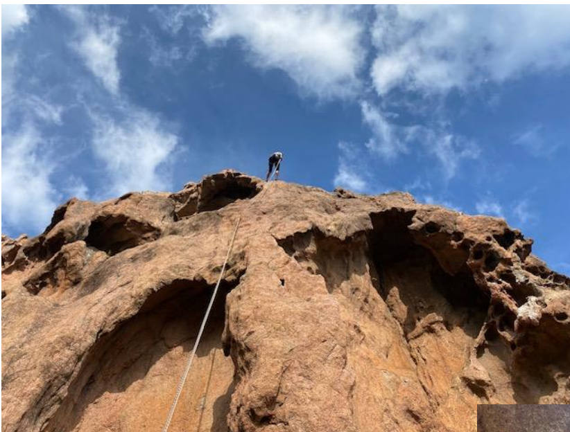
Abseilen über Tafoni