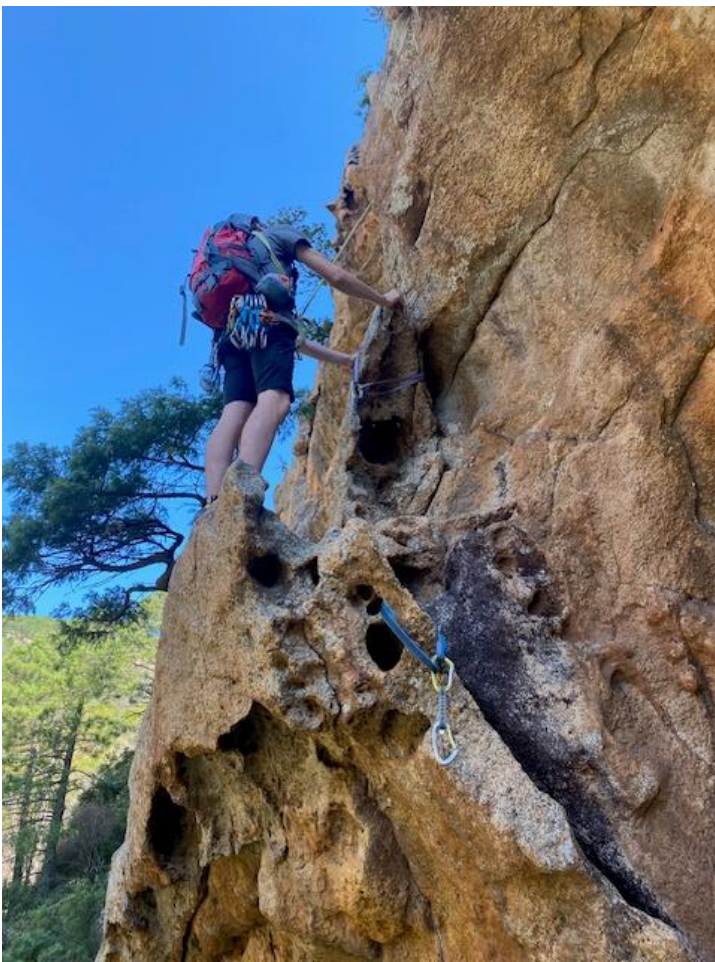
Klettern im Tafonifelsen im Gebiet Bavella