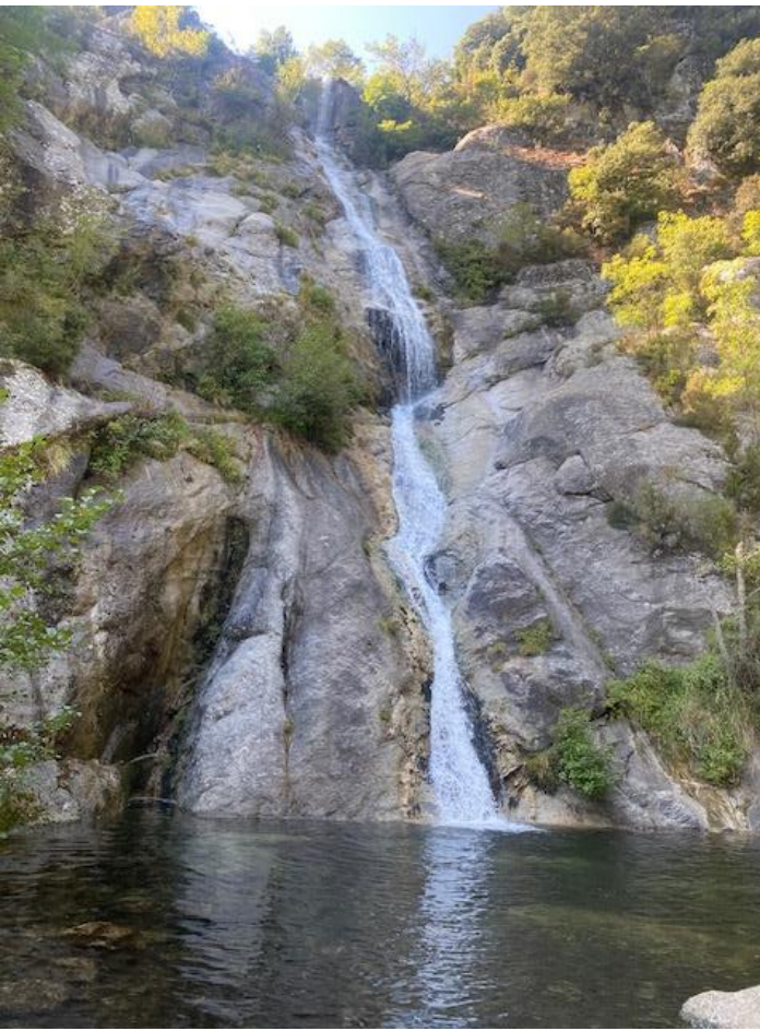
Cascade de Buja, einer von Korsikas höchsten Wasserfällen