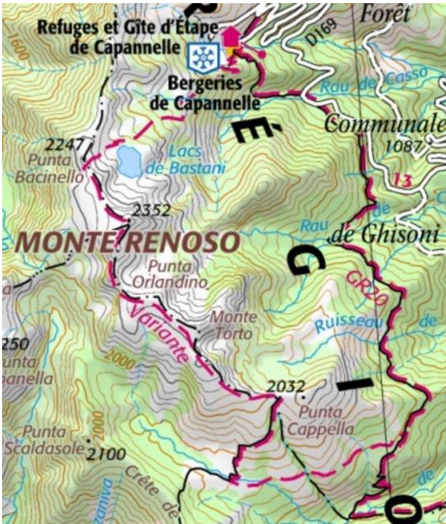
Beispiel der korsischen Wanderkarten, Ausschnitt mit Wanderwegen (rot)