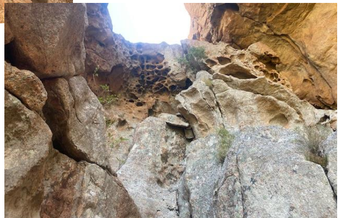
Noch mehr Tafoni:)