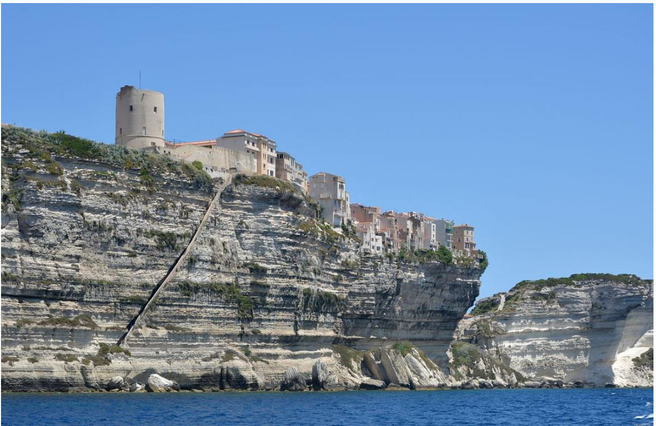
Historische Stadt Bonifacio, ganz im Süden