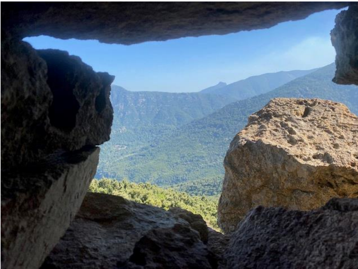
Aussicht von Aussichtspunkt oberhalb Chisa