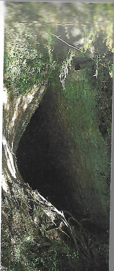
Geheimnisumwirt: Eingang zum Hagheerenloch.

Die Chronik berichtet, dass die im 12. Jh. erbaute Burg verschiedenen Lehnsträgern diente, ehe sie ab 1544 allmählich verfiel. Erhalten sind stattdessen Mauerreste und ein 13 m tiefer Sodbrunnen. Im Wald gewinnt der Weg anschliessend die Anhöhe Chämmerli (3) und senkt sich dann im romantischen Chämmerliobel mit seinen Giessen und Nagelfluhwänden hinab ins Lochbachtal (4). Ein neuerlicher Anstieg bringt über das Tüfenegg (5) nach Manzenhueb (6). Vom kleinen Weiler leitet ein Höhenweg über den sanft geschwungenen Kammrücken mit seinem typischen Wechsel von Weide- und Waldkuppen hinauf zum Kirchlein von Sternenberg (7). Hier oben, in der höchstgelegenen Gemeinde des Kantons Zürich, liegt dem Wanderer ringsum die zerklüftete Welt des Tössberglandes zu Füßen. Noch schöner wird die Aussicht, wenn man von der Straßenkreuzung rechts auf dem Waldlehnpfad den schmalen Höststock (8) erklimmen hat (Flasbank). Über die Kammwogen des Oberlandes hinweg reicht der Blick bis in die Glarner Alpen. Der Wanderweg selbst verläuft um den Höststock herum, passiert den gleichnamigen Hof und wendet sich links im Wald hinab zum Hagheerenloch (9). Die Höhle unter der Nagelfluhdecke ist etwa 30 m lang und soll in früheren Jahrhunderten Wiedertäufern als Unterschlupf gedient haben. Es wird auch vermutet, dass die Höhle einem Hagheeren (Burgherrn) als Gefängnis diente. Zürcher Sagen berichten dagegen von Schlangen, Drachen und Schatzsuchern. An zwei imposanten Wasserfällen vorbei führt die