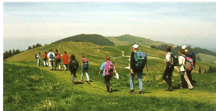
En balade sur la crête du Schwyberg.