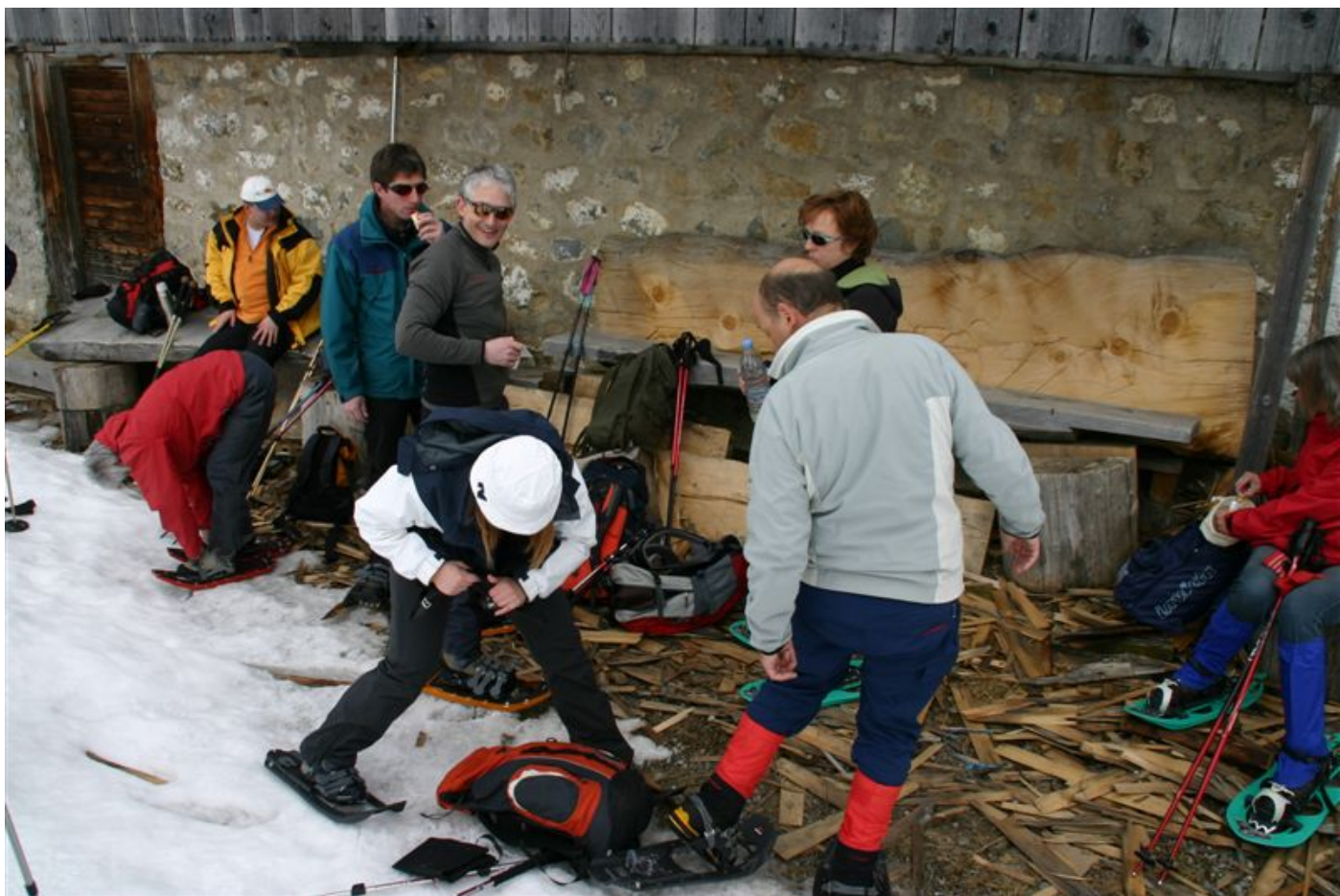
Mann/Frau hilft sich gegenseitig bei der Schneeschuhmontage