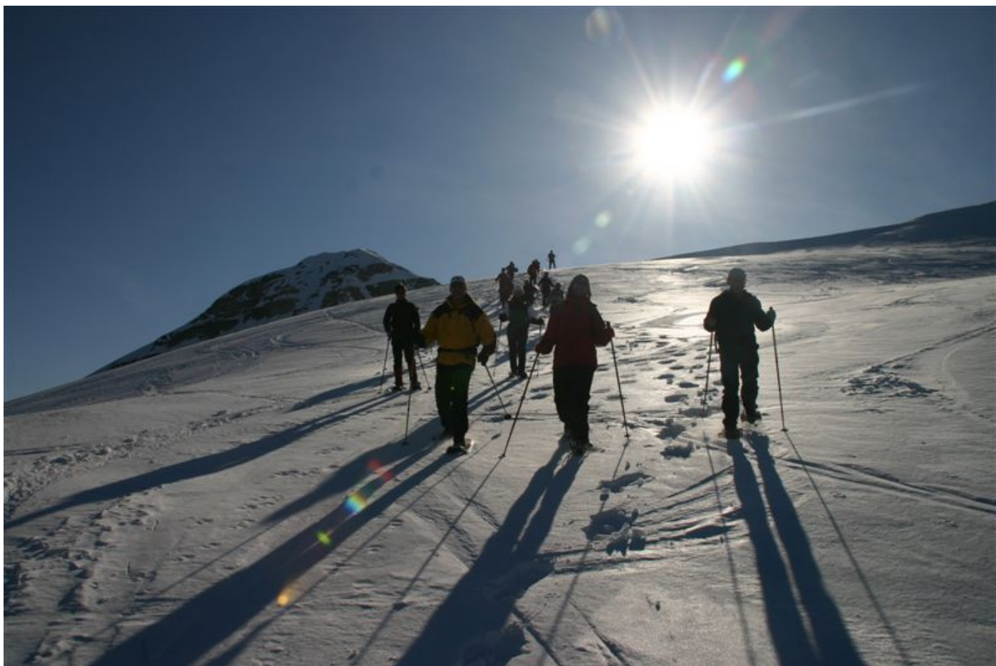
Abstieg nach ...