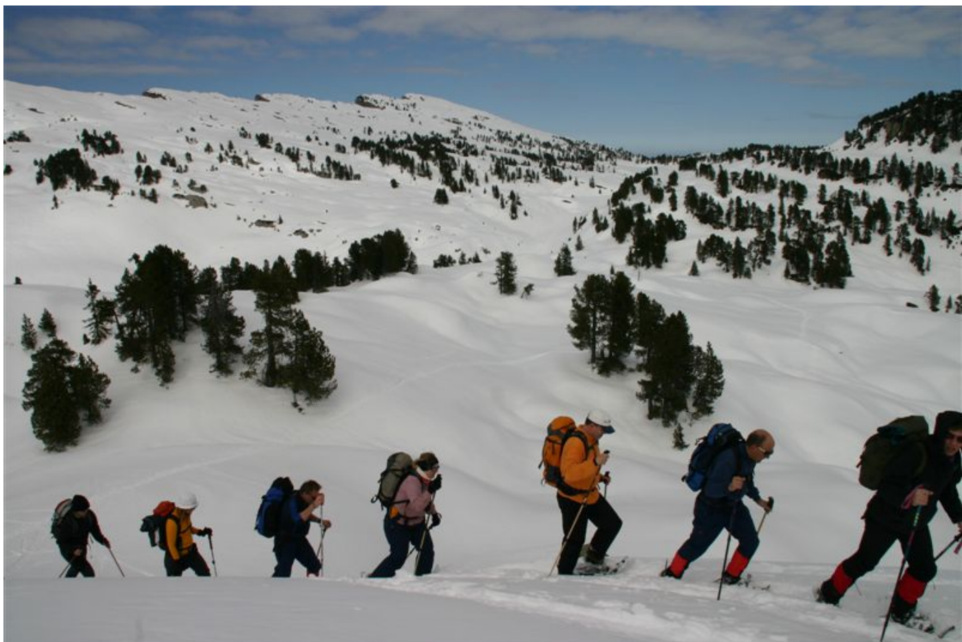
Gegenaufstieg Richtung Gemmenalphorn (dafür reichte es dann doch nicht mehr)