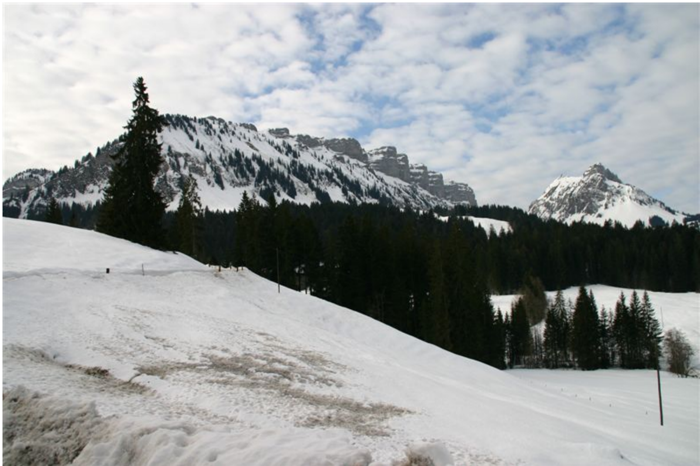
Siebenhengste von Nordwesten