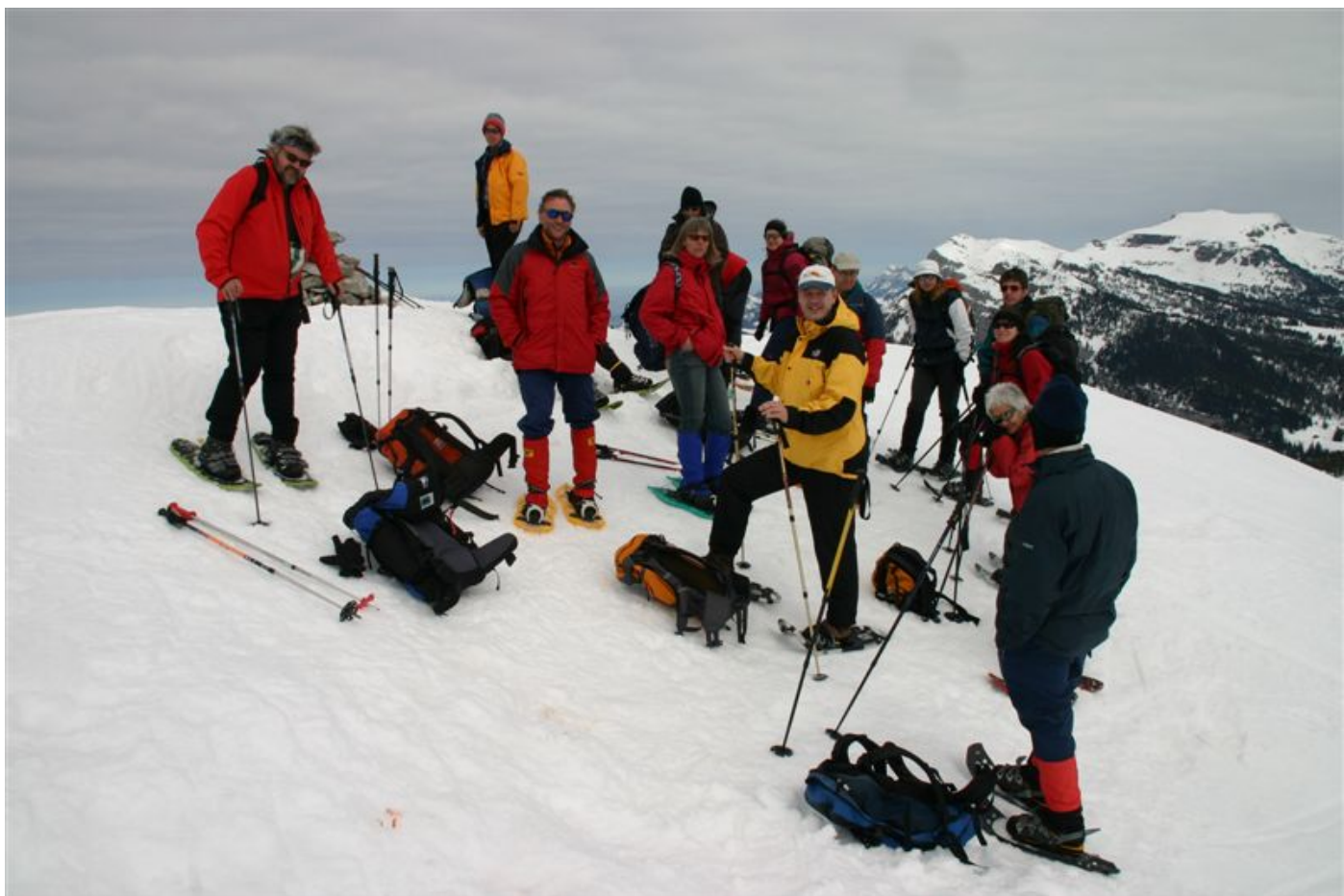
Auf dem Hauptgipfel der Siebenhengste