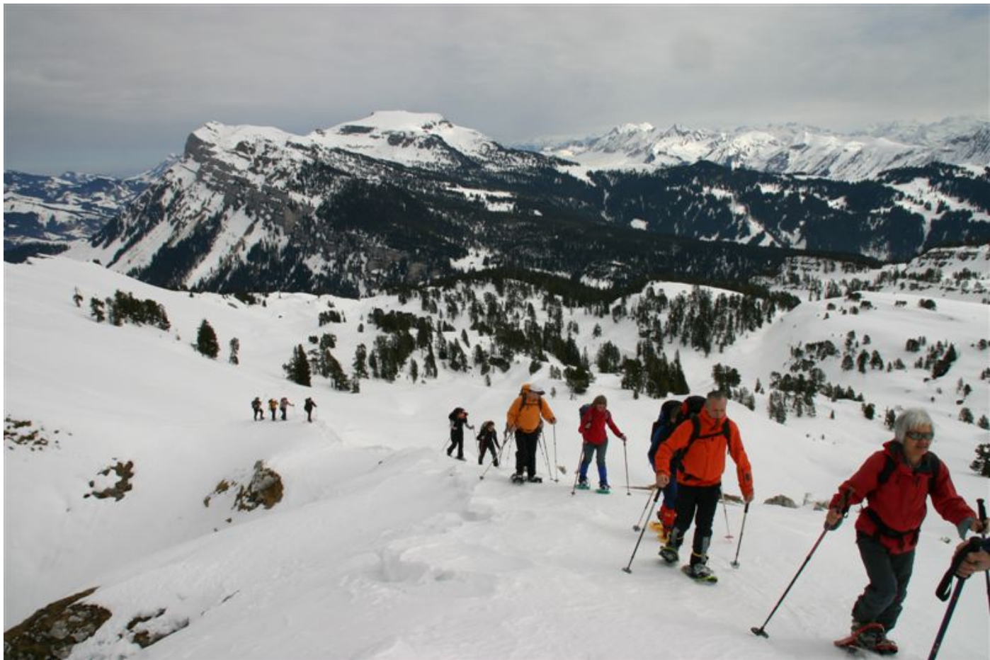
Nun ist es fast geschafft