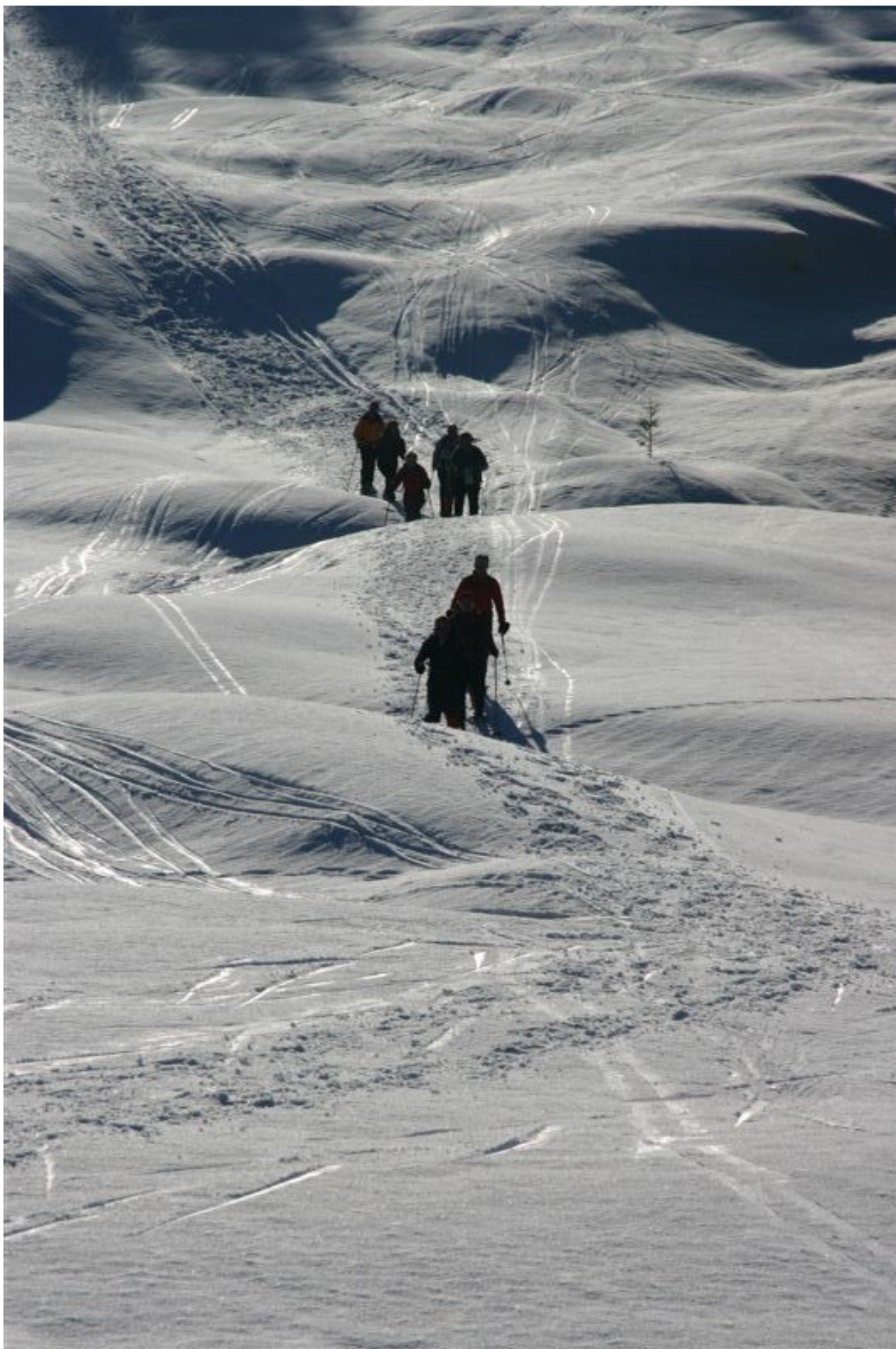
Das Restaurant ist nicht mehr weit!