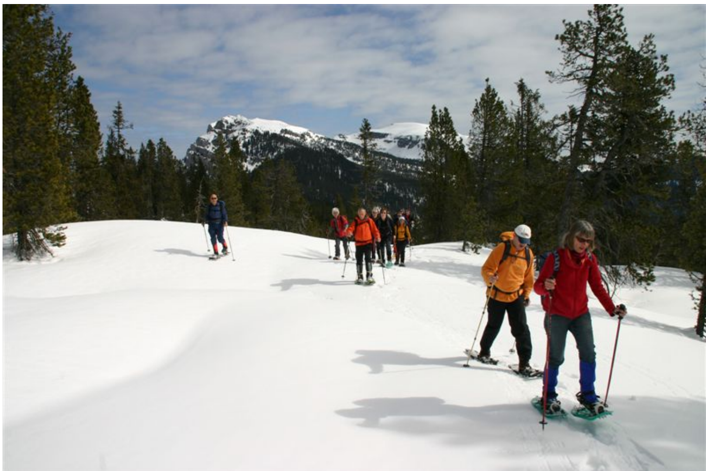
Der Gipfel naht