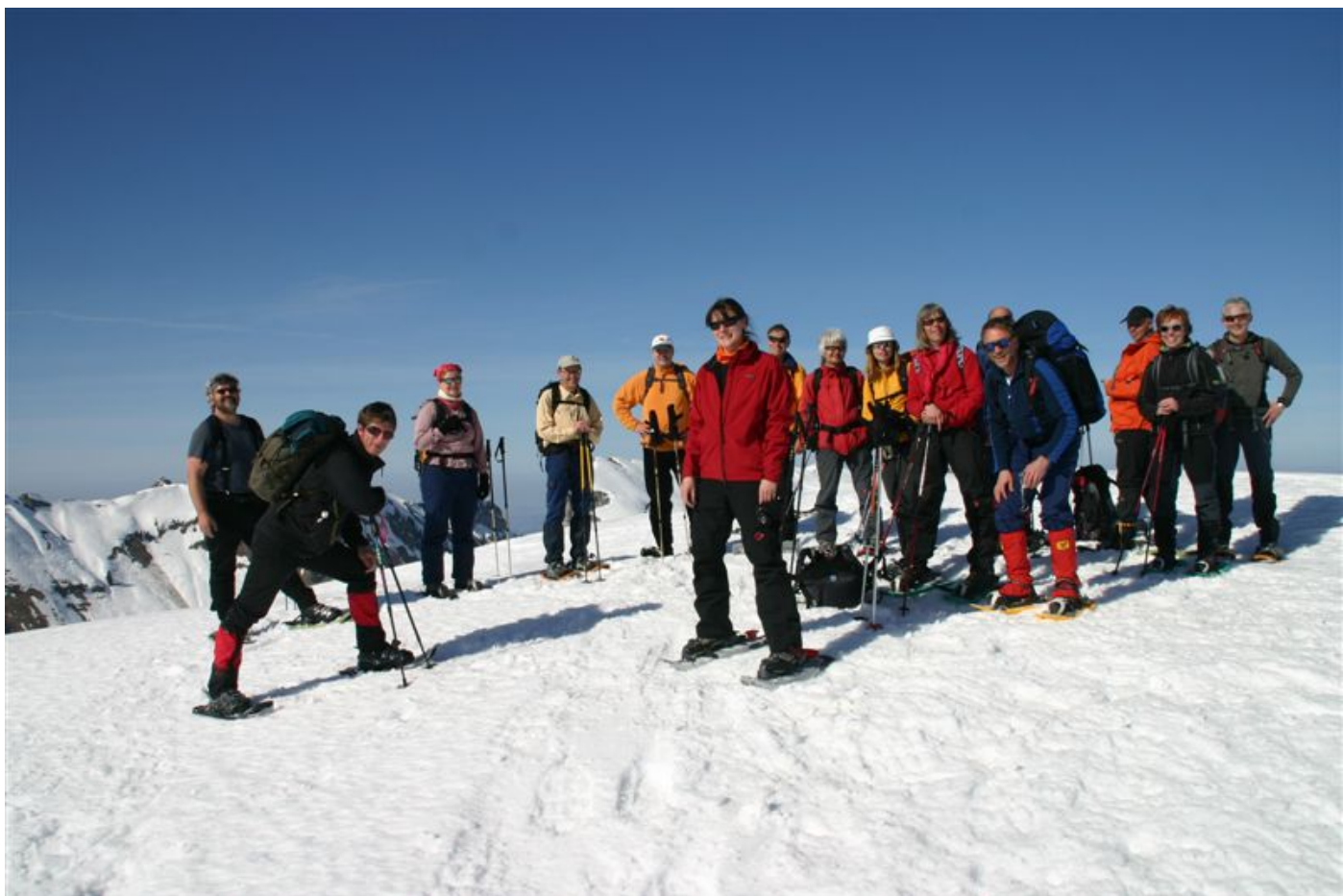
Auf dem Nebengipfel des Gemmenalphorns...