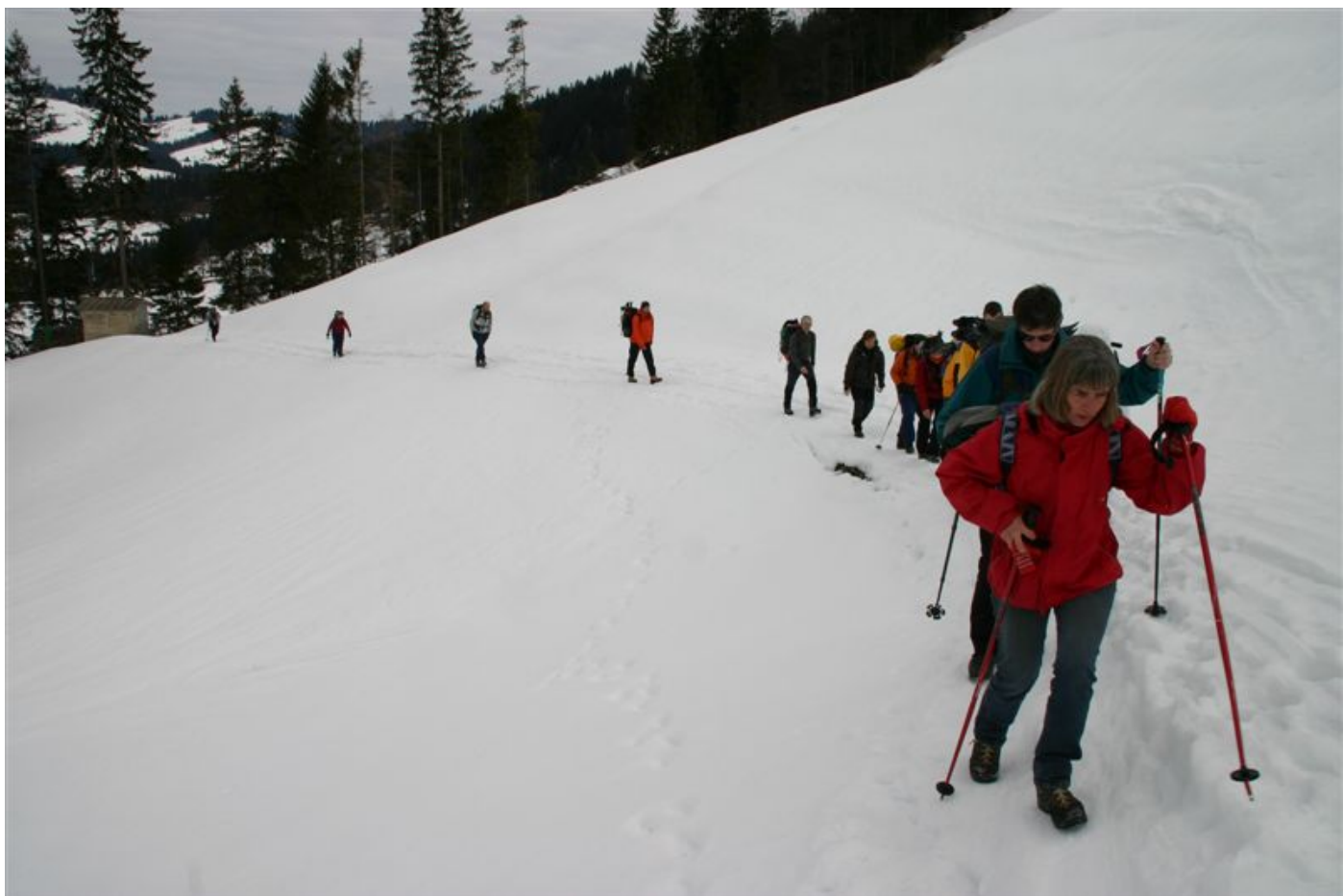
Noch ohne Schneeschuhe...