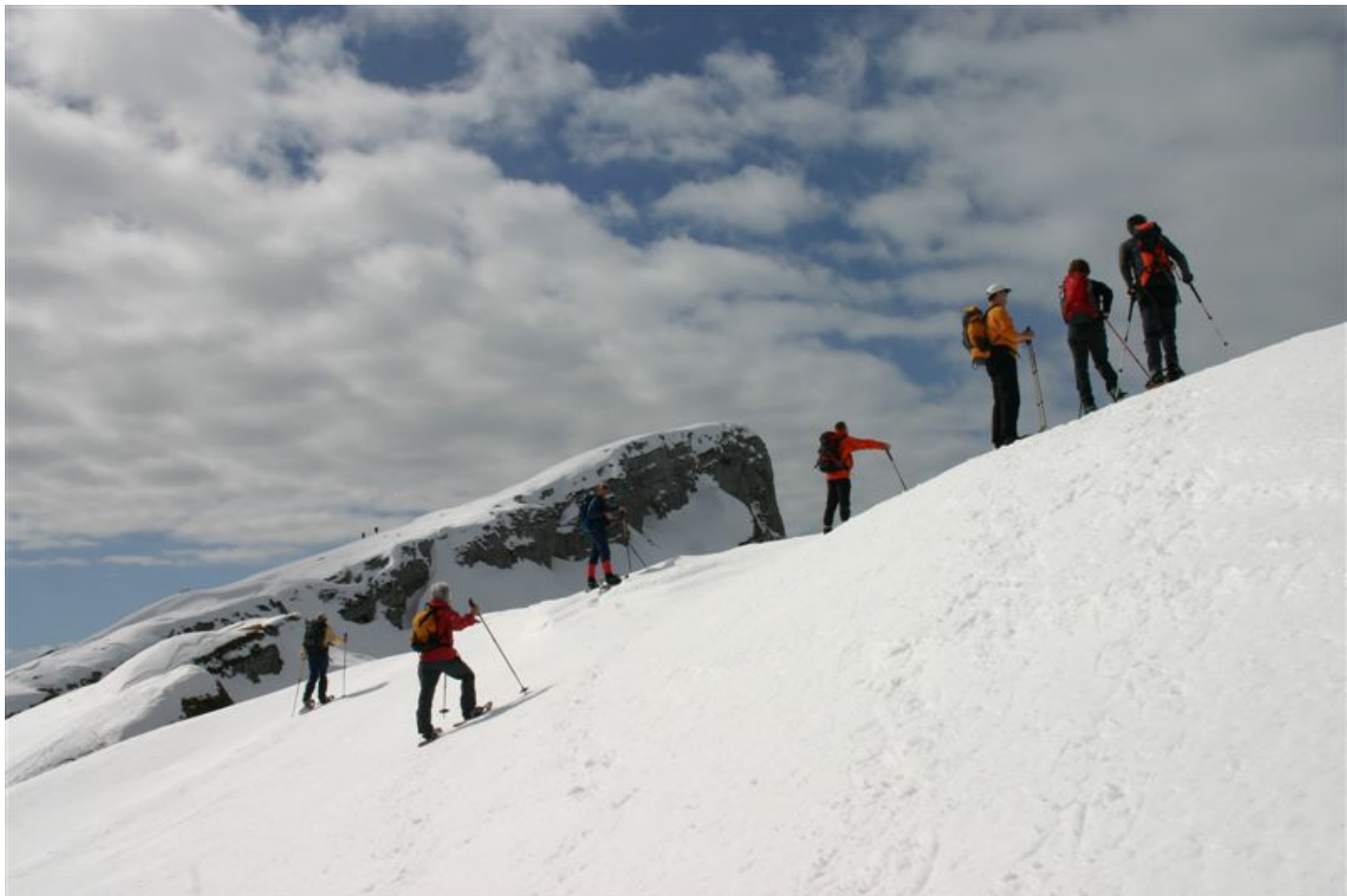
Auf dem Gipfelgrat