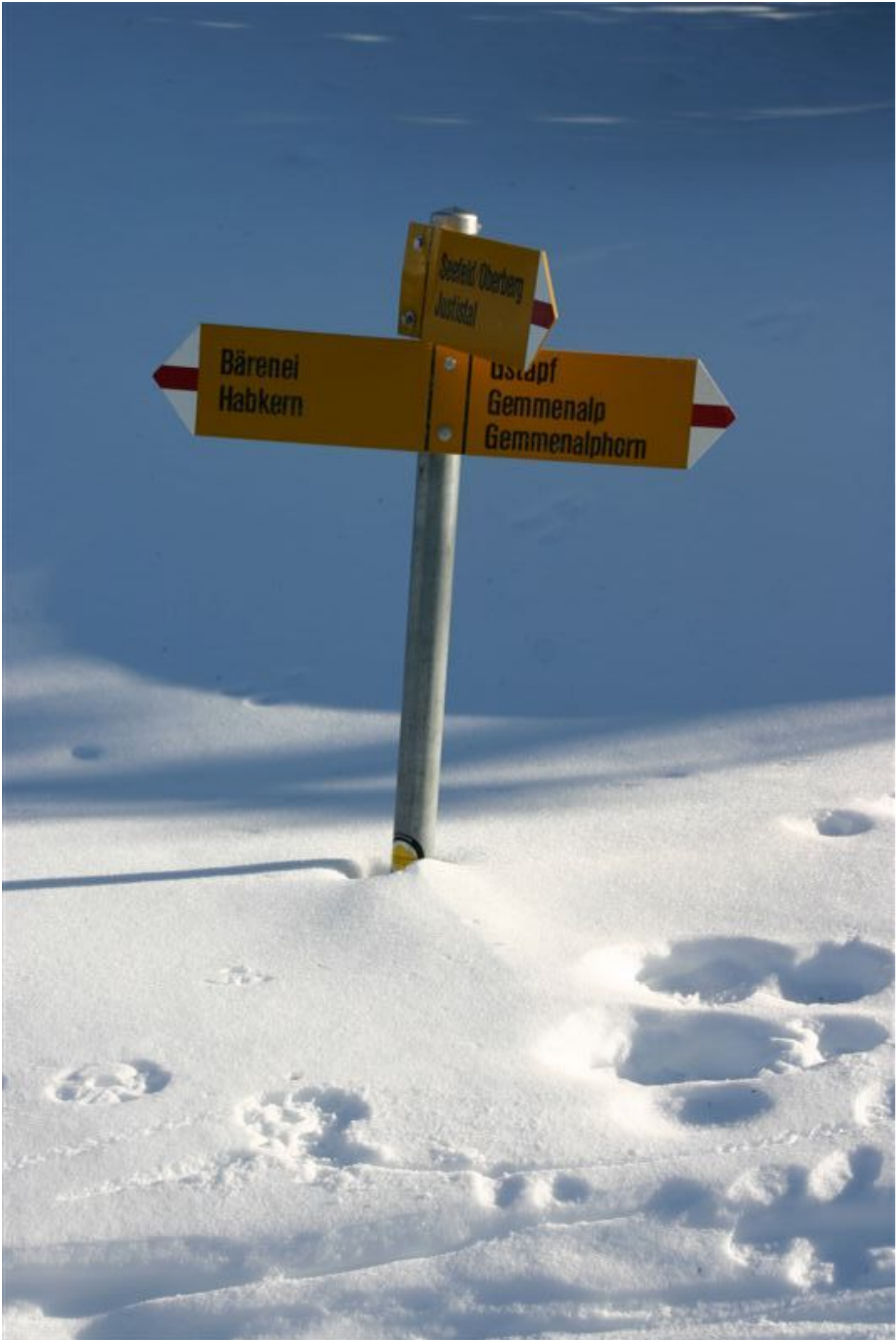
Schnee hatte es mehr als genug!