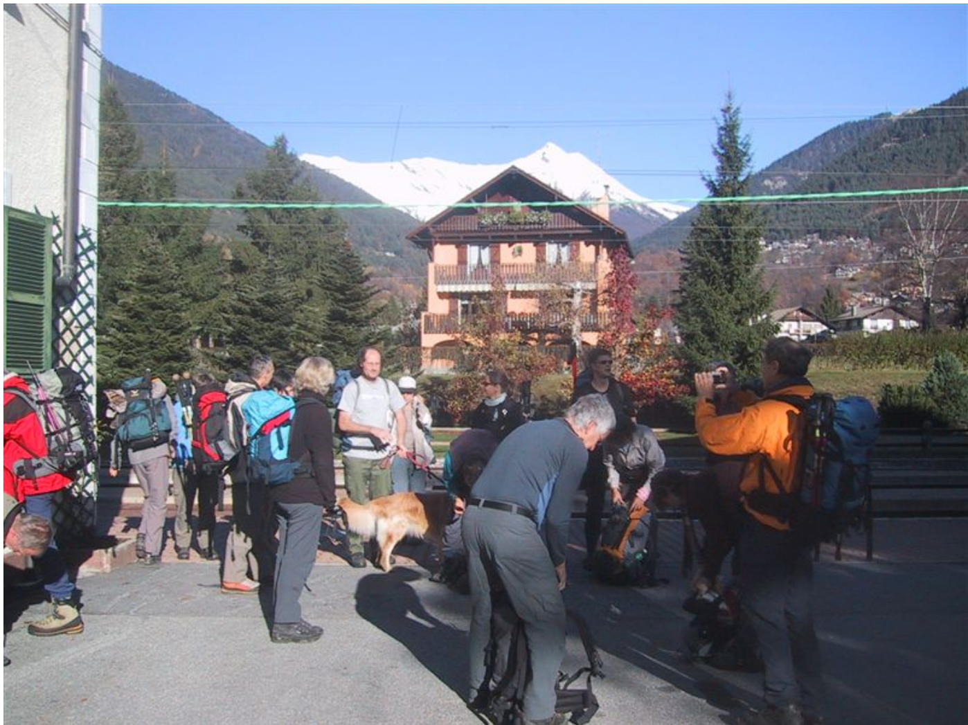
am bahnhof von sta. maria maggiorre war endstation