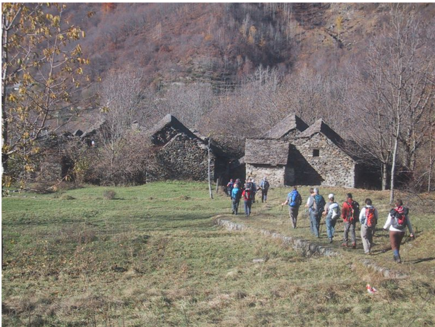
es ging weiter durch geister dörfer