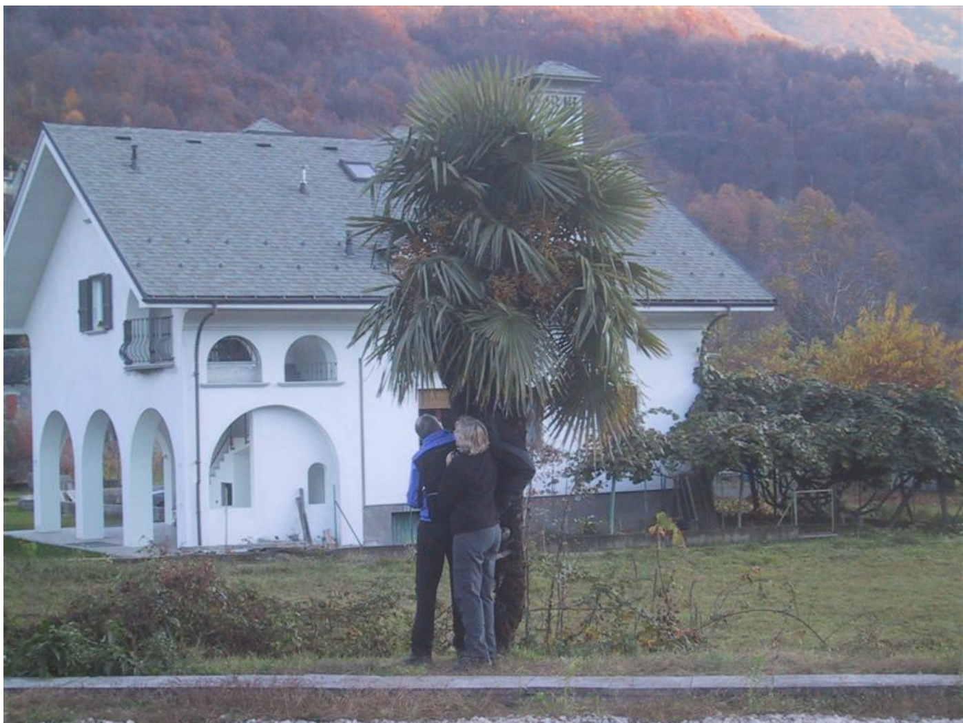
vernichten der letzten kräften