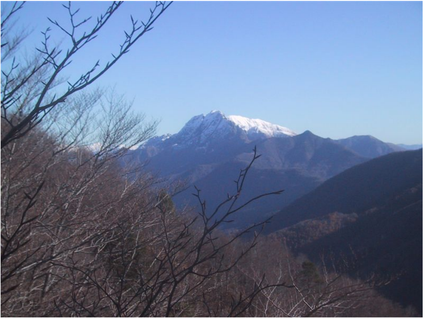
...oder träumen vom letztjährigem gipfel (gridone)