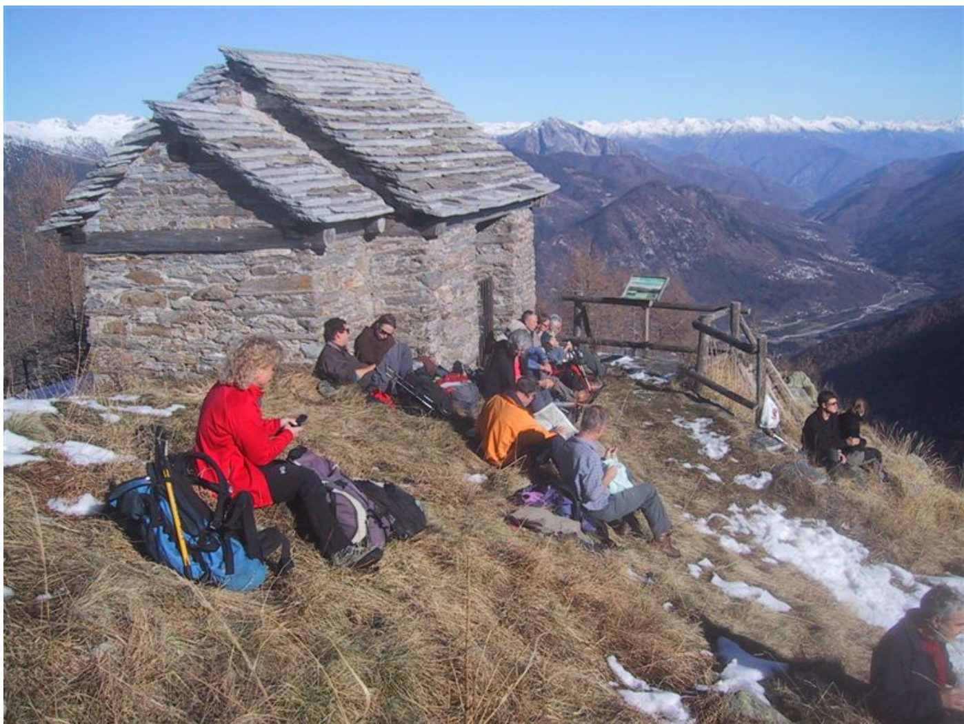
mittagsrast und geniessen..