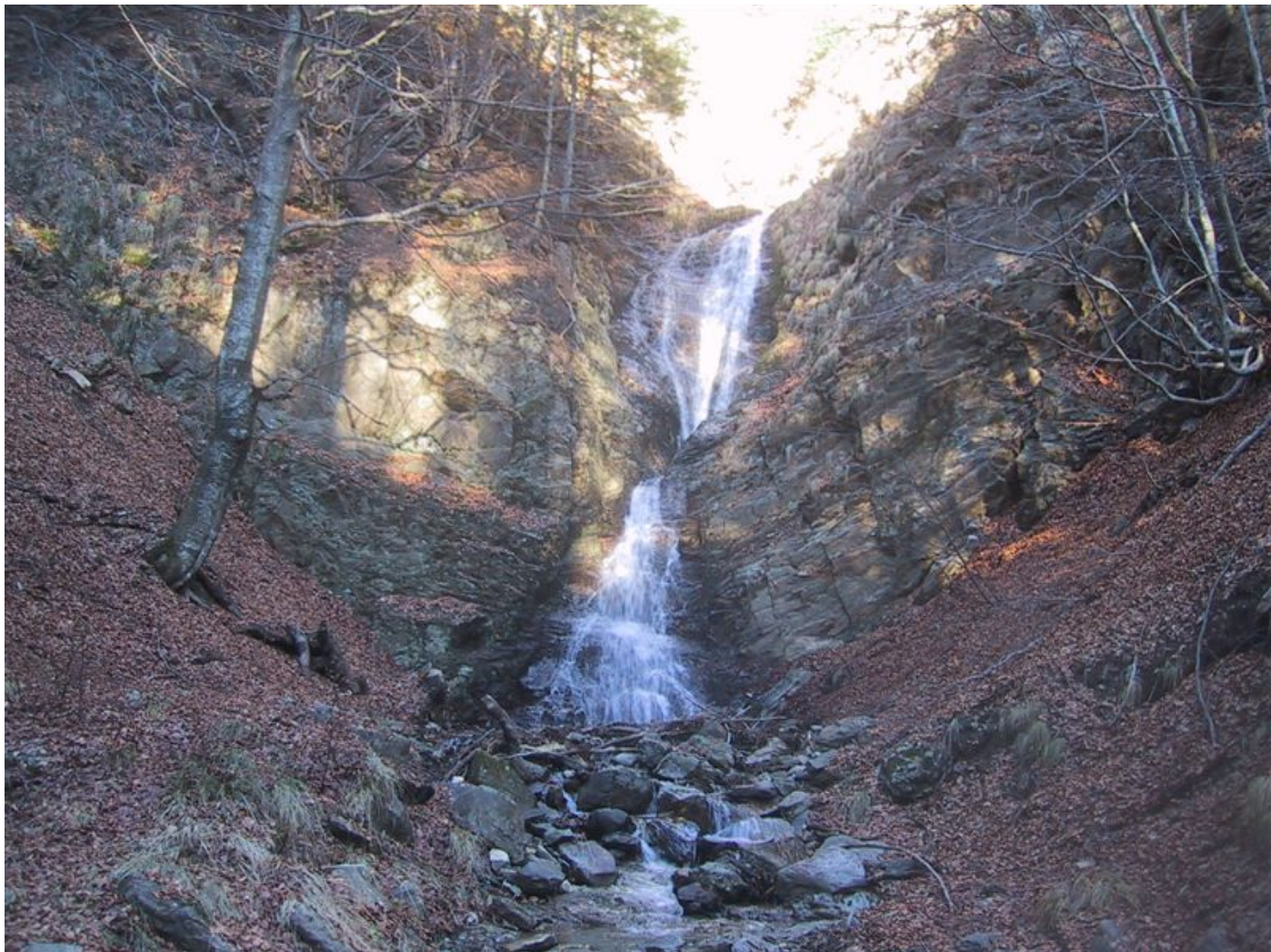
...vorbei an wasserfällen