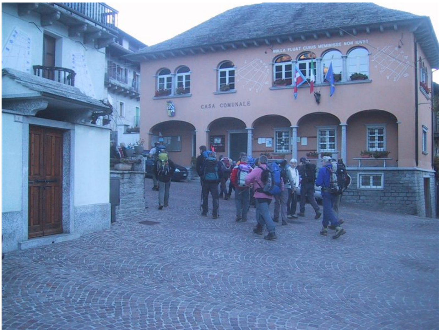
abmarsch richtung dommodossola...