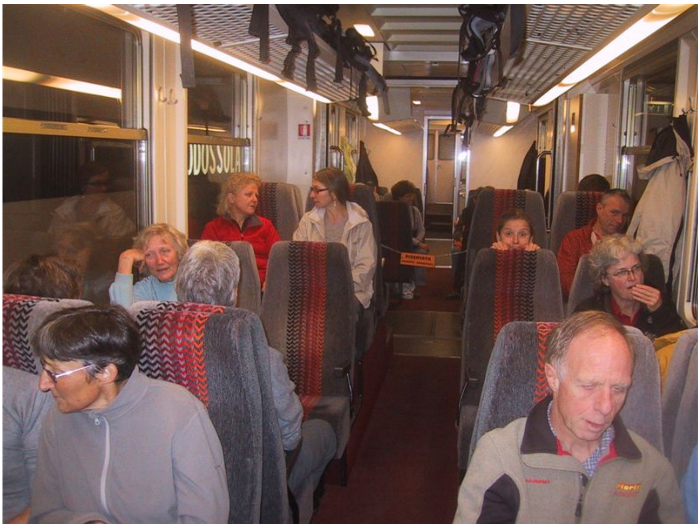
alle fanden einen platz in der centovalli-bahn und sind gespannt wie es weiter geht.