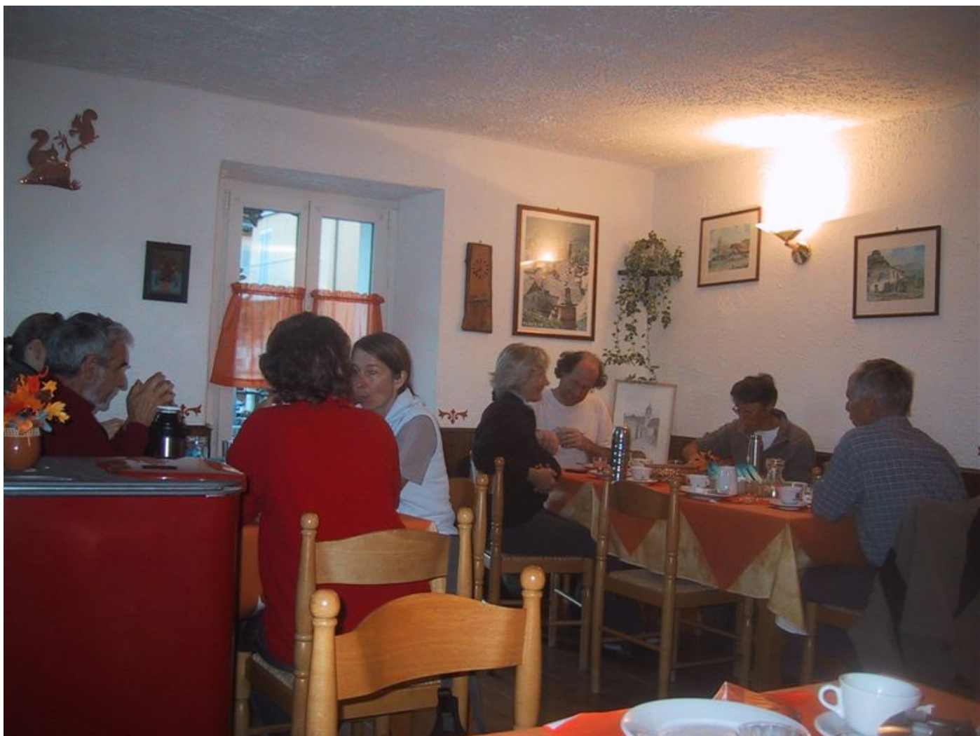
neue kräfte werden gesammelt beim frühstück