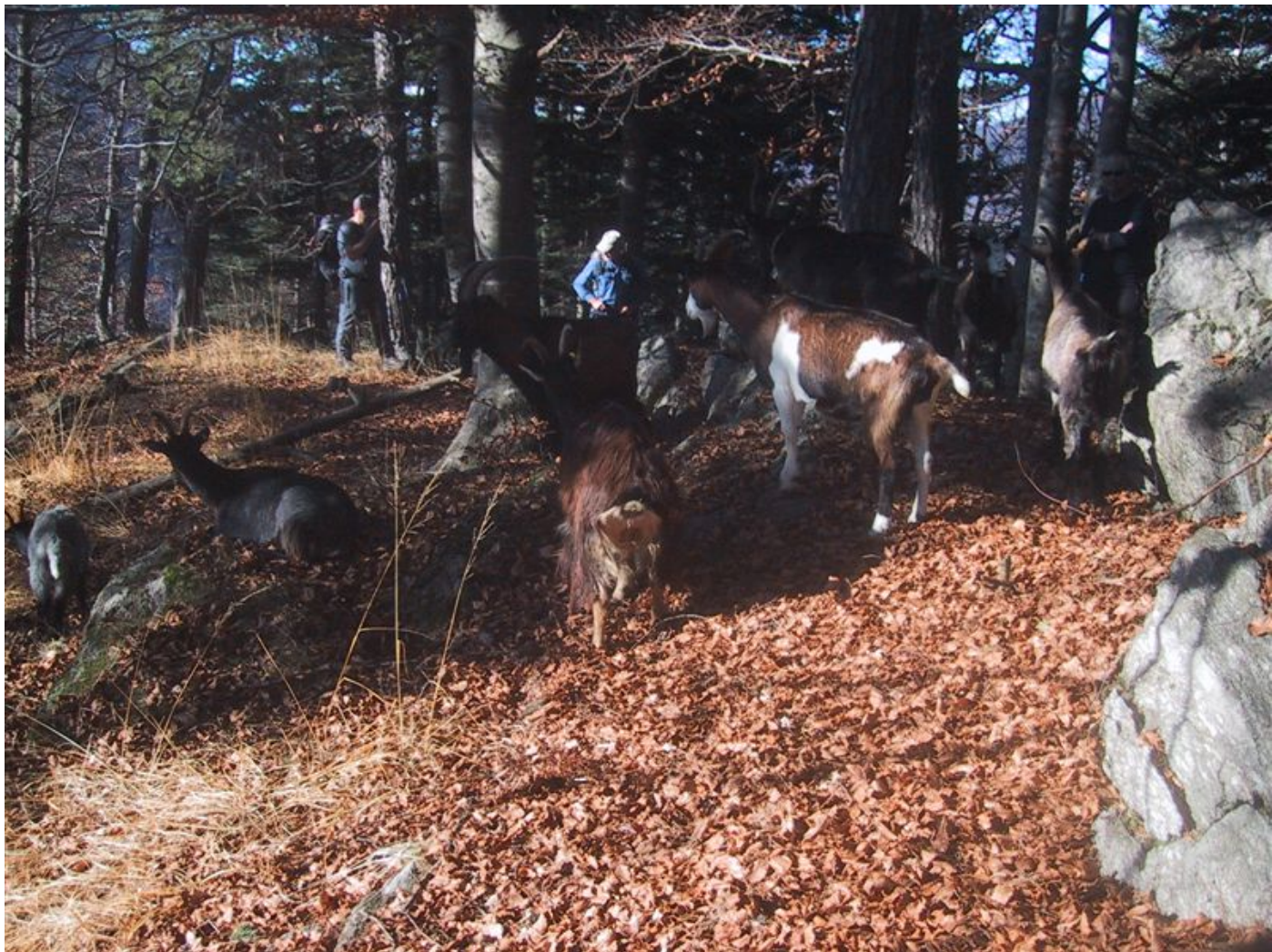
mitten im wald eine ziegenherde, was für ein...