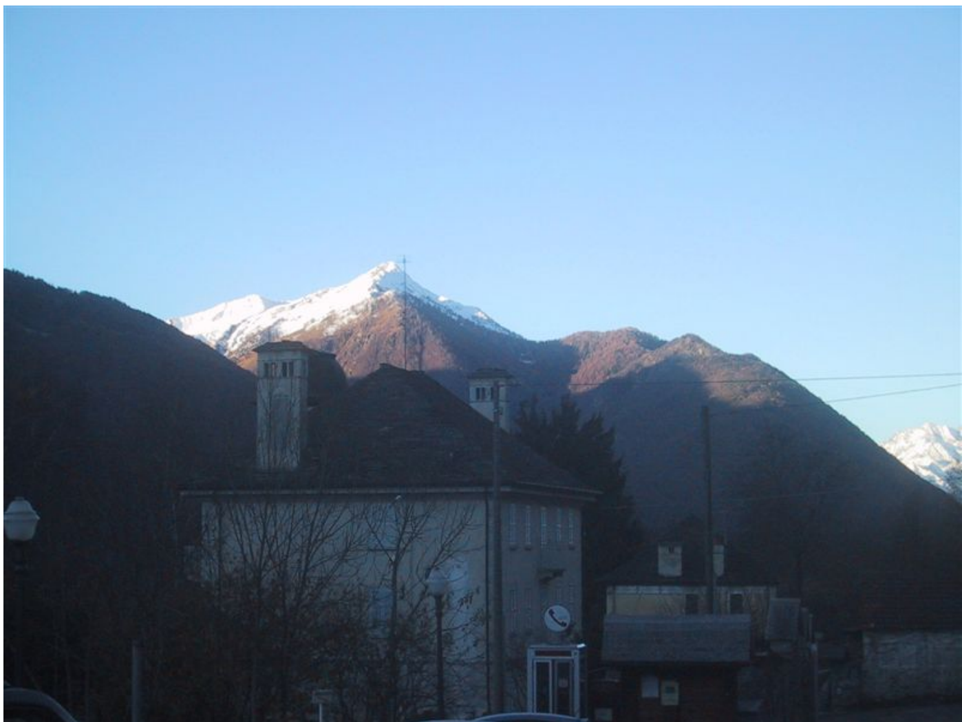
blick zurück auf den ersten tag (leider nicht bis ganz nach oben, der winter war schneller oben)