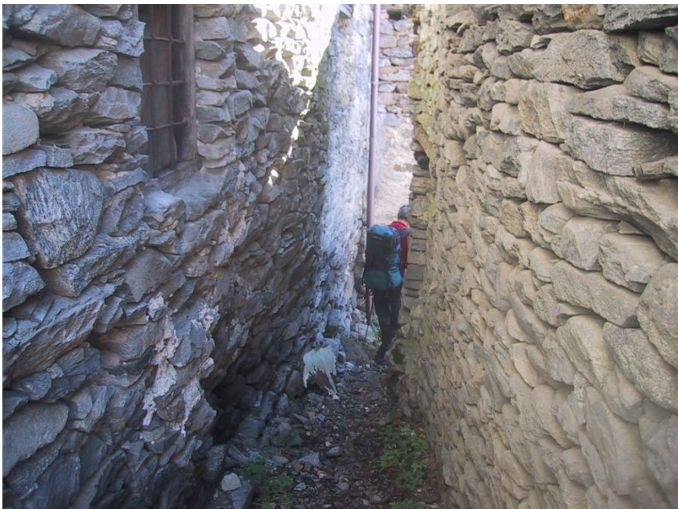
weiter durch häuserschluchten..