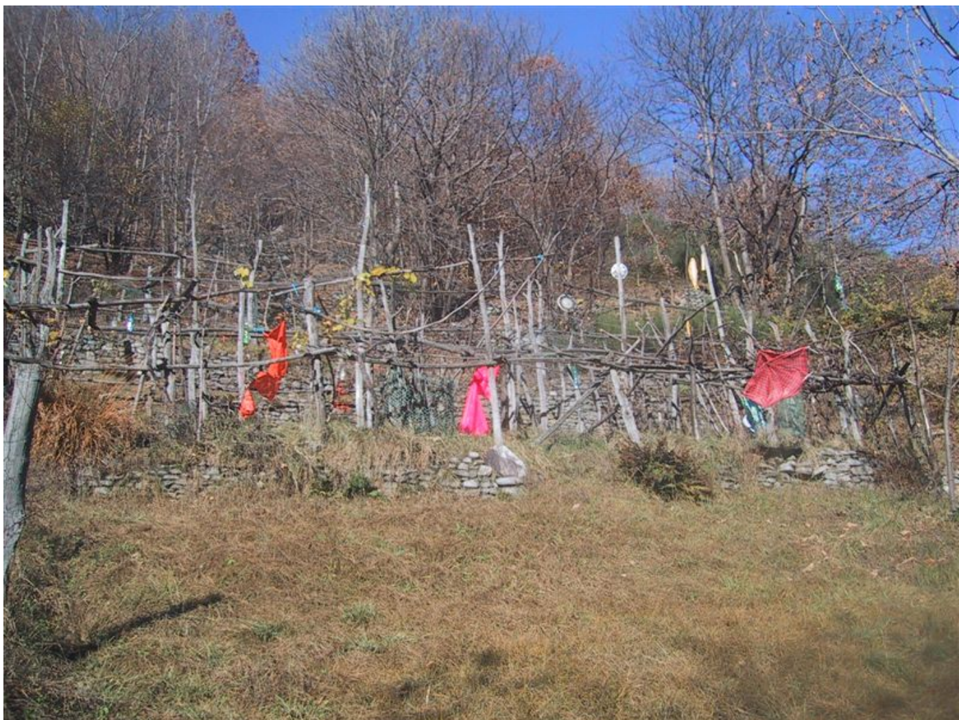
bei soviel schreckhaften, sind auch die rebstöcke abgehauen...