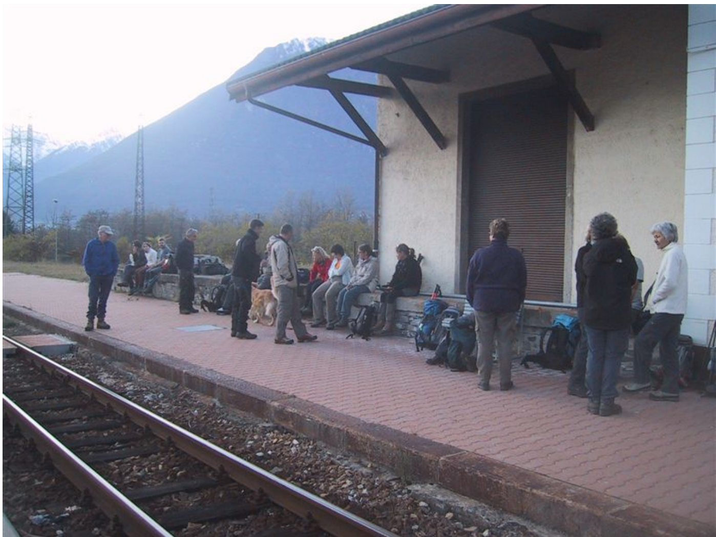
das grosse warten auf die öv.