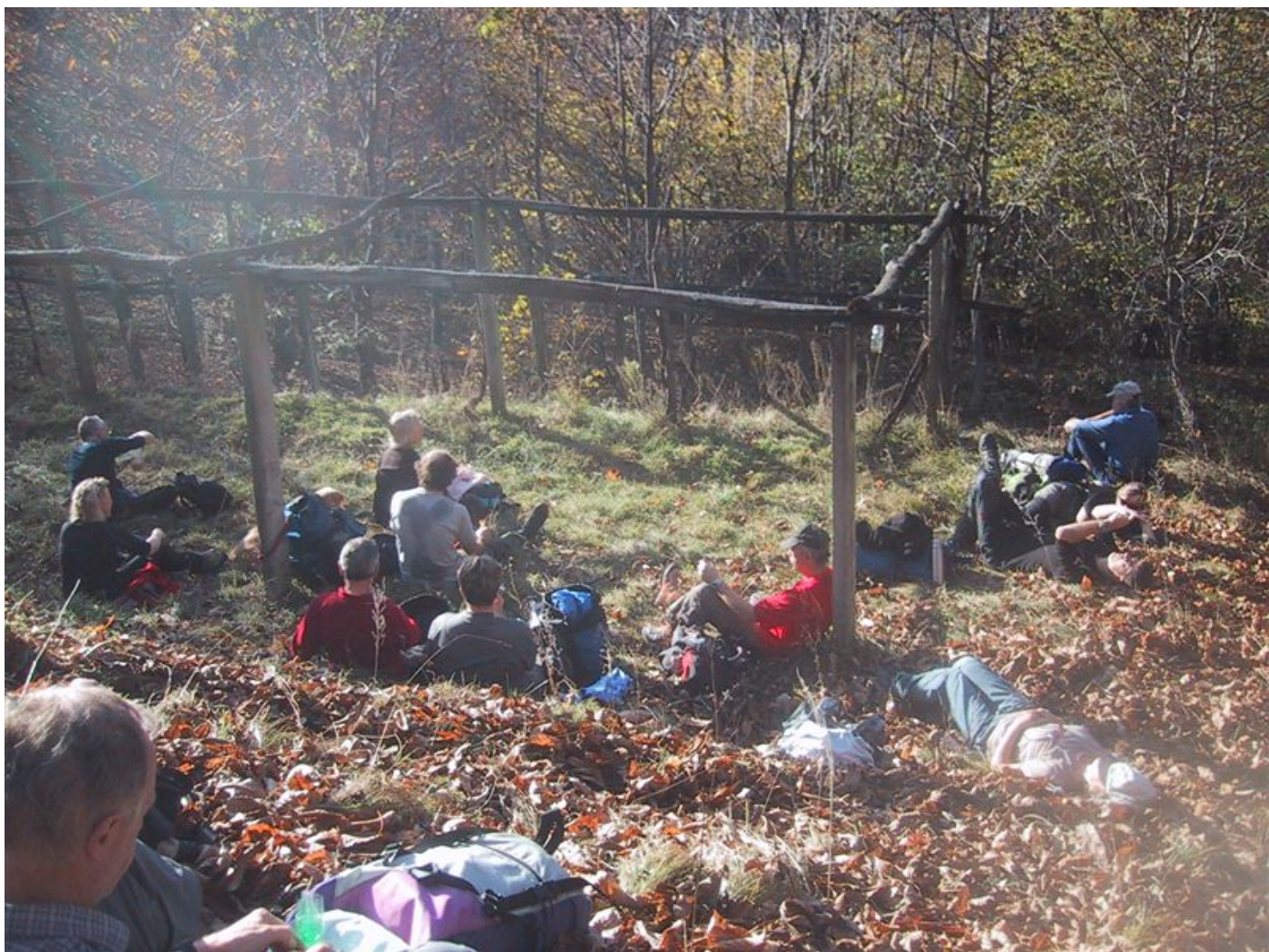
die letzten sonnenstrahlen werden genossen