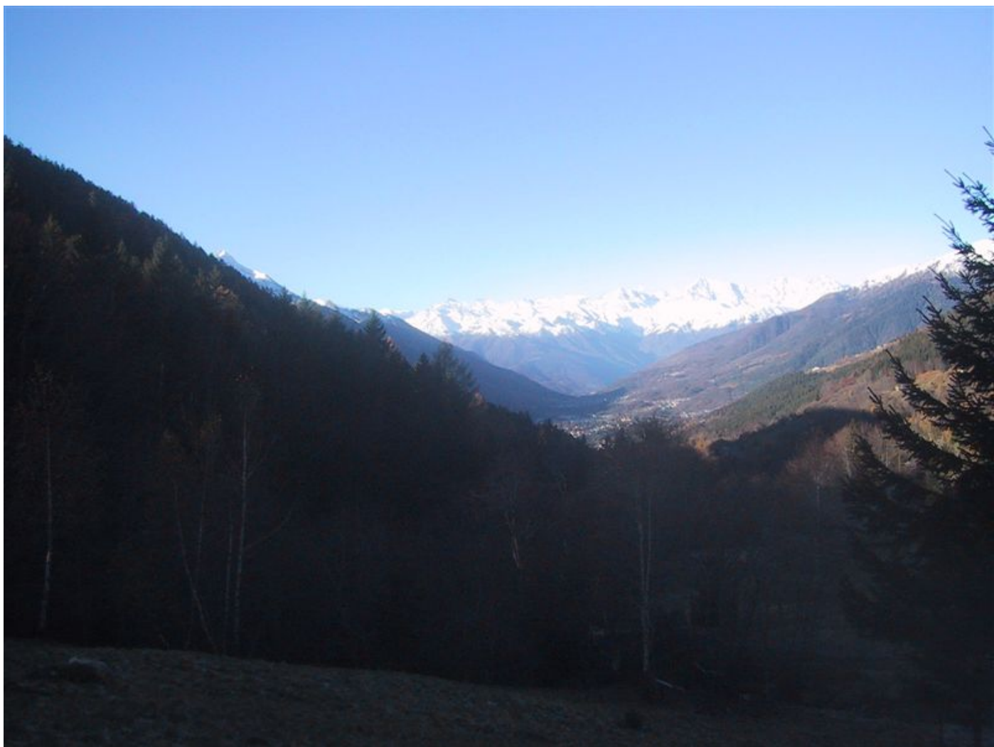
den wald verlassen geniessen wir das herrliche panorama