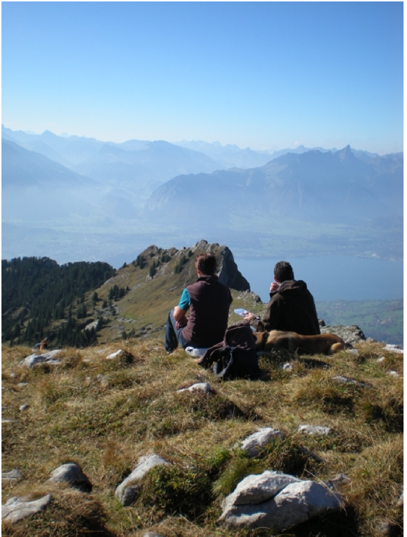
und schon oben