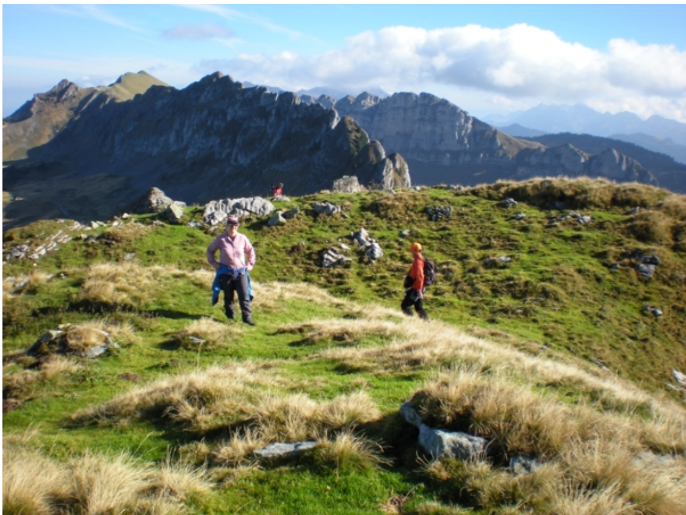
Vor dem Geierhorn