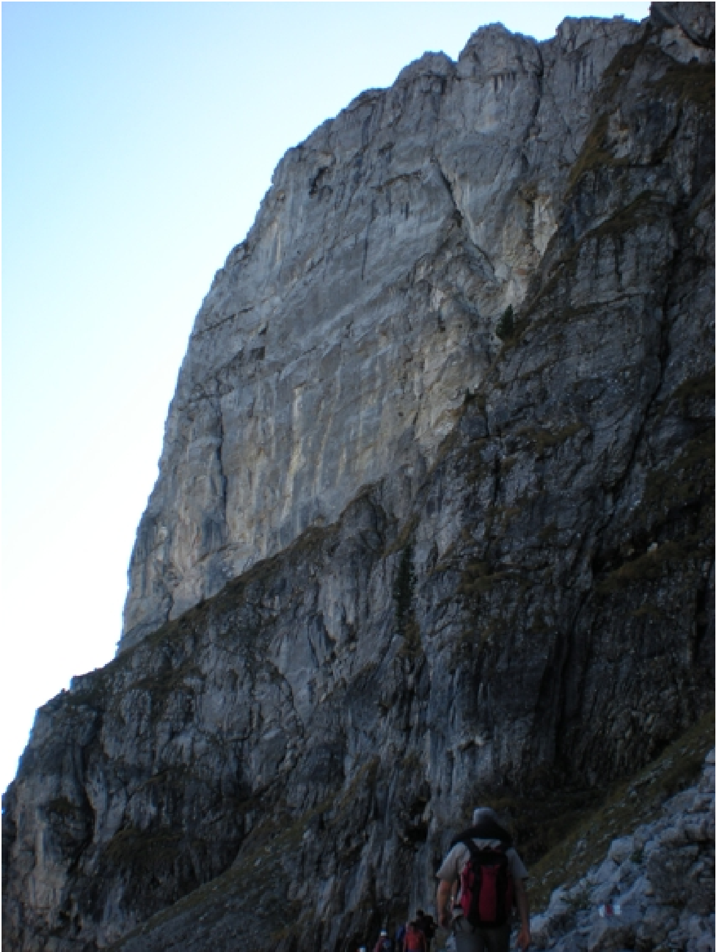
Zum Glück müssen wir da nicht rauf