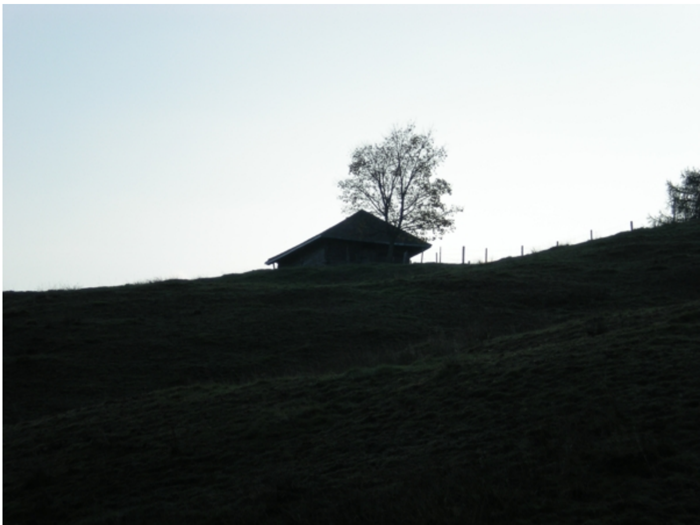
Morgenstimmung beim Aufstieg von Eriz