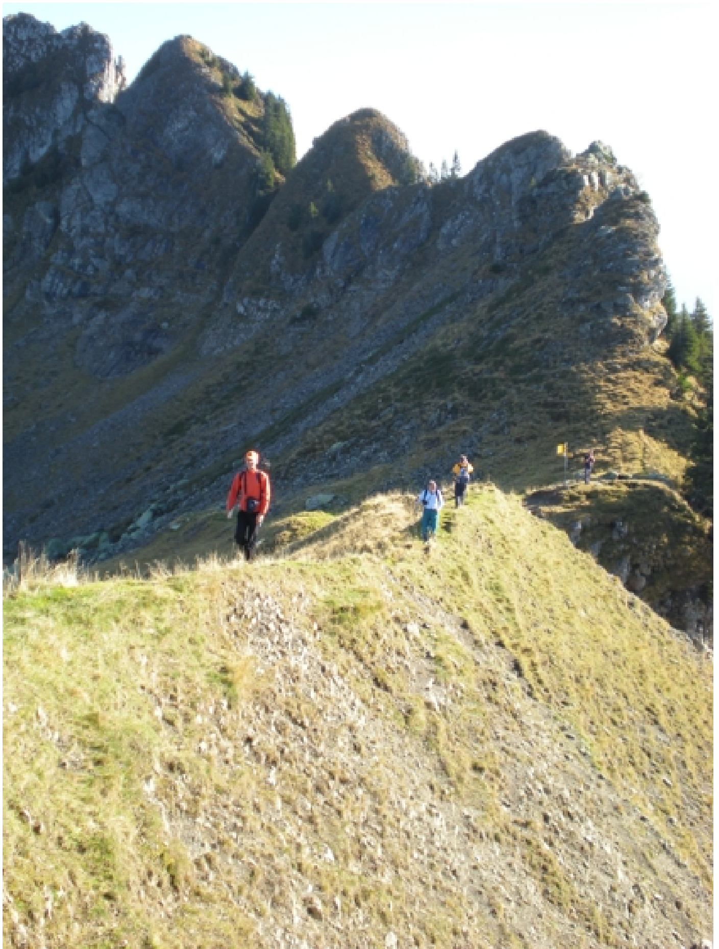
Auf dem Grat