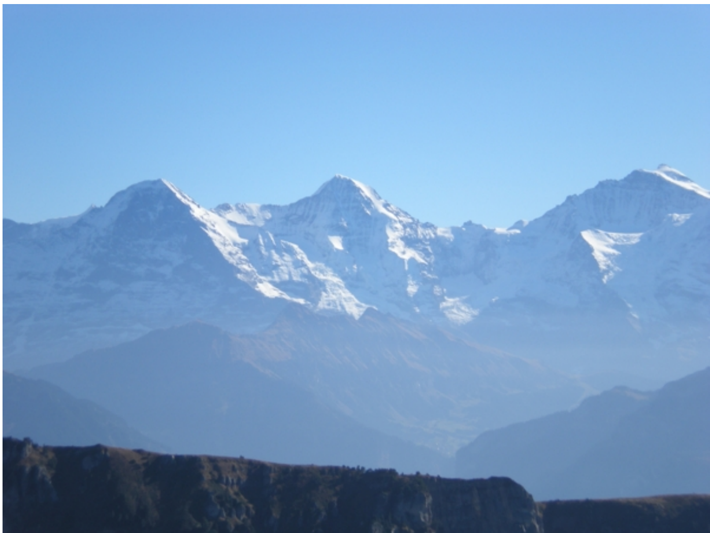
Das bekannte Dreigestirn