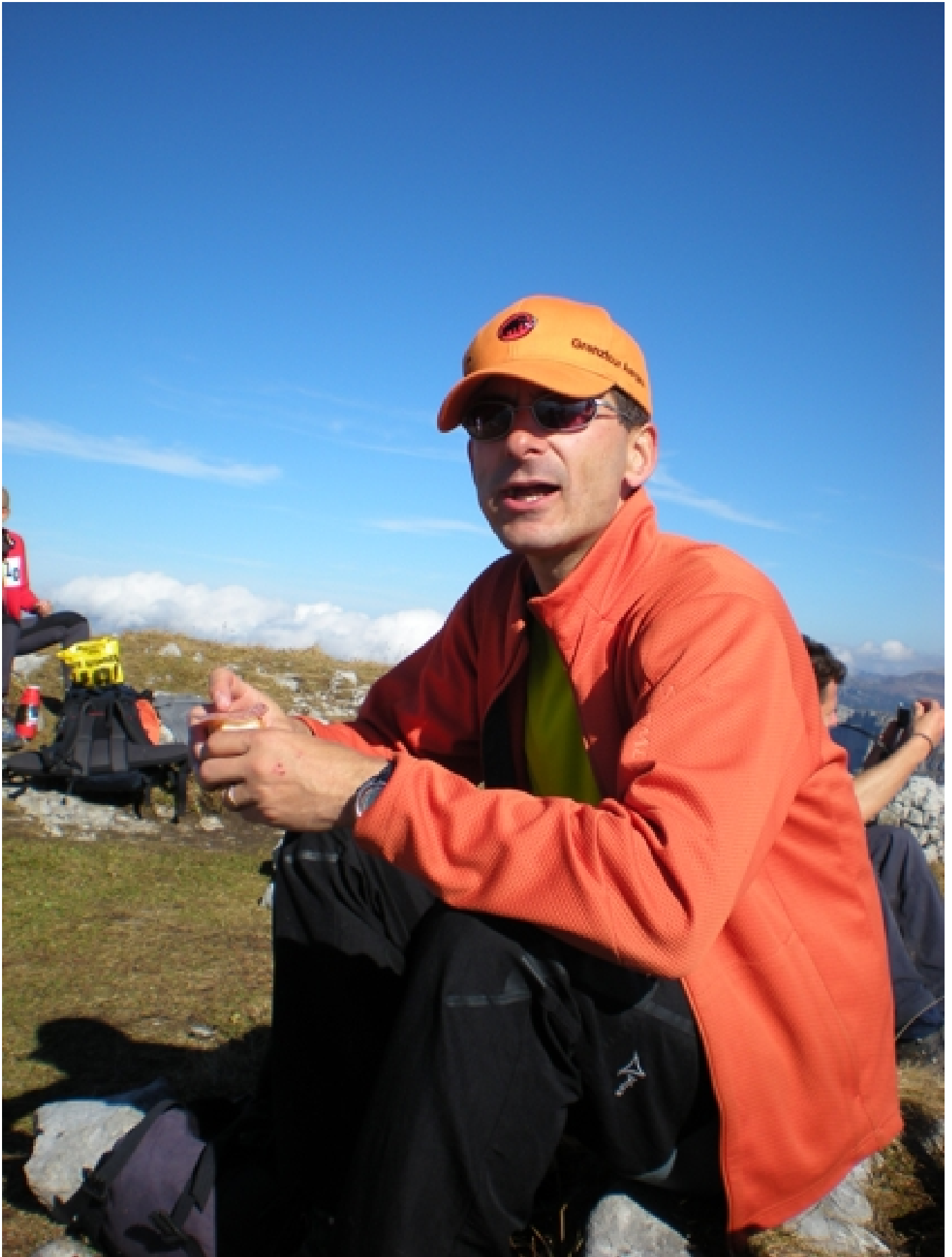
Ein anderer Vogel