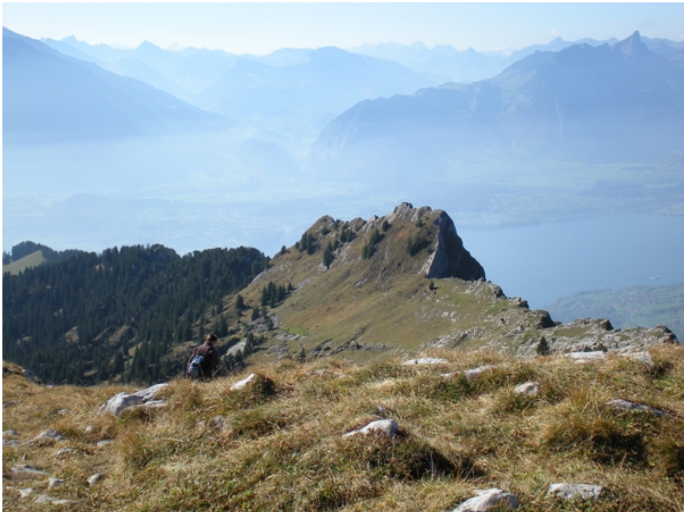
Abstieg in Richtung Oberbärgli mit Blick auf den Thunersee, rechts das Stockhorn