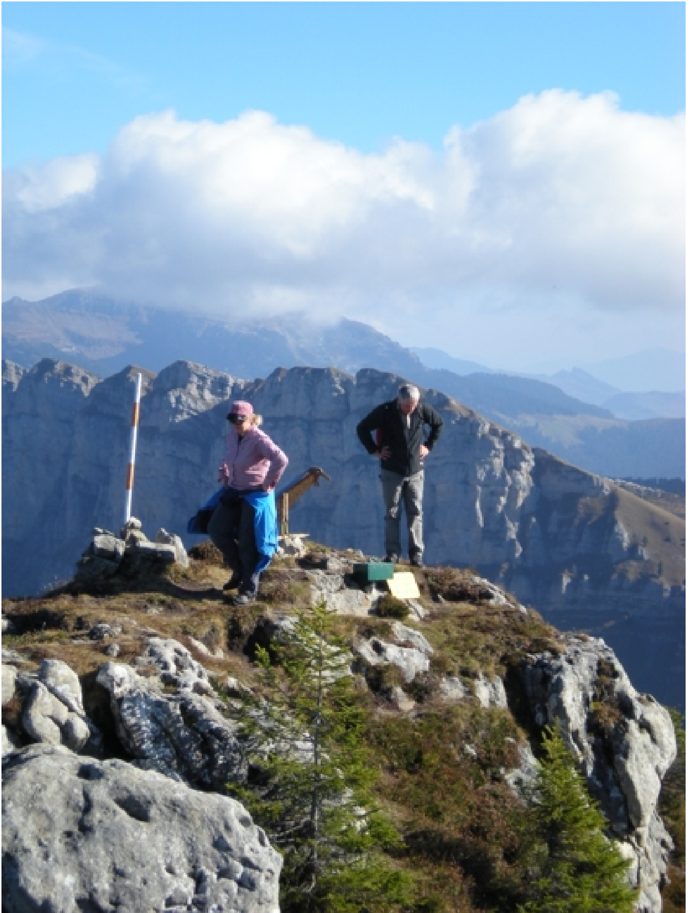
Die ersten Gipfelstürmer