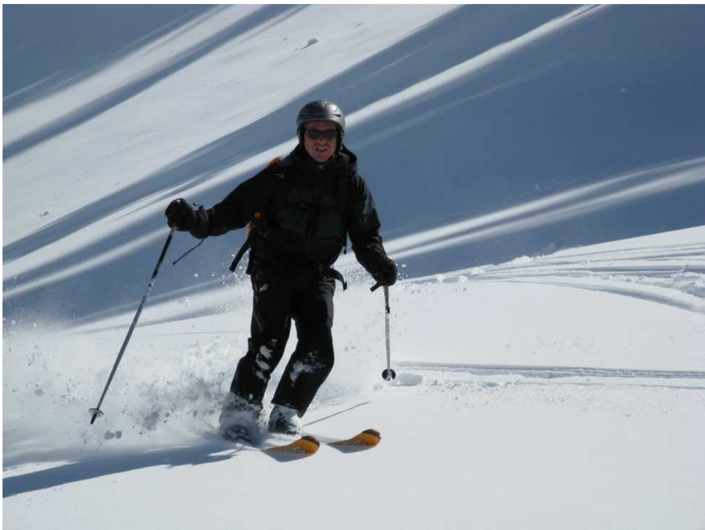
Der Chumlig gibt echt was her