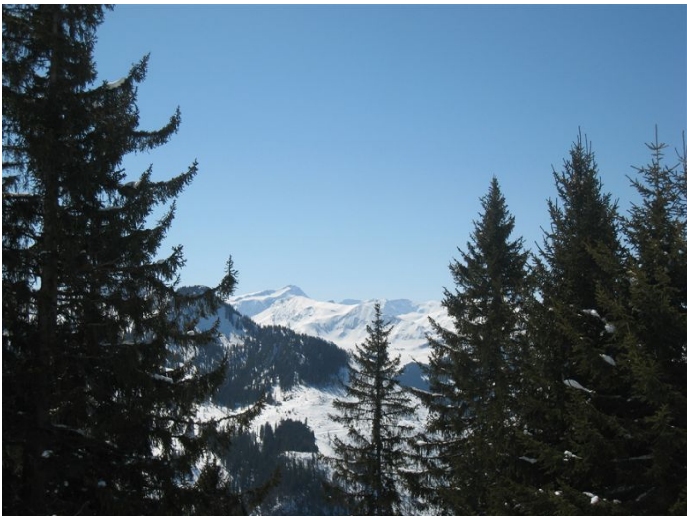
Wildhorn zwischen Tannenwipfeln