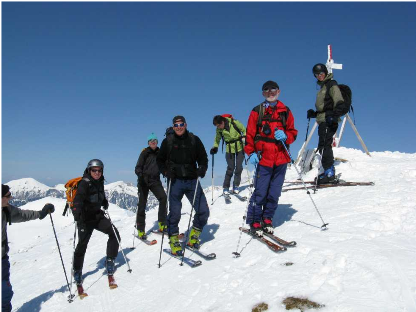
Jeder freut sich auf die Abfahrt