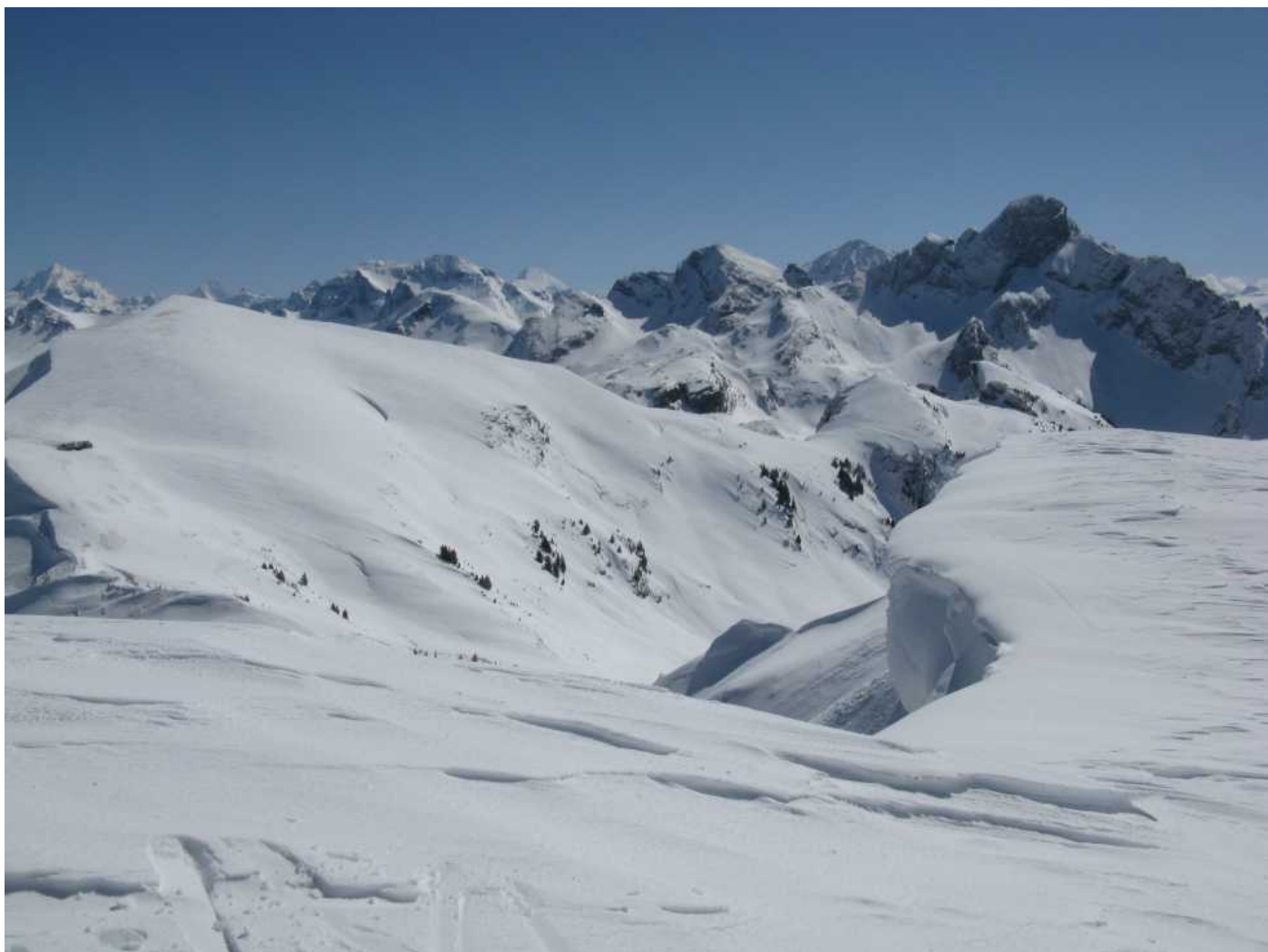
Grosse Waechten auf dem Gipfel