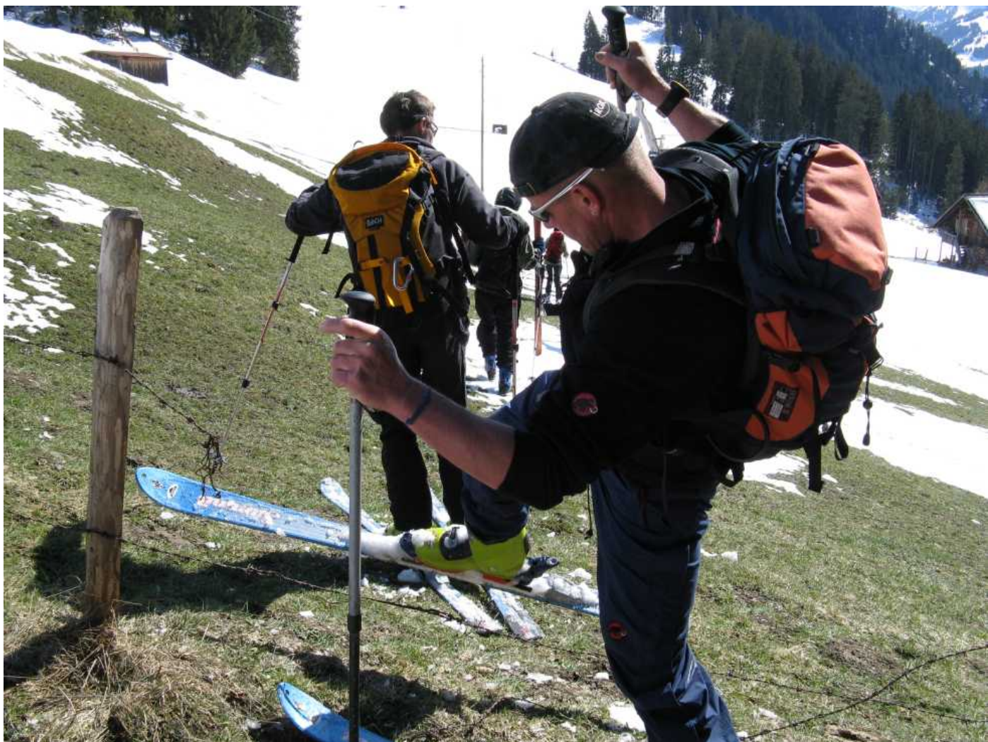
Hindernisse werden souverän bewältigt