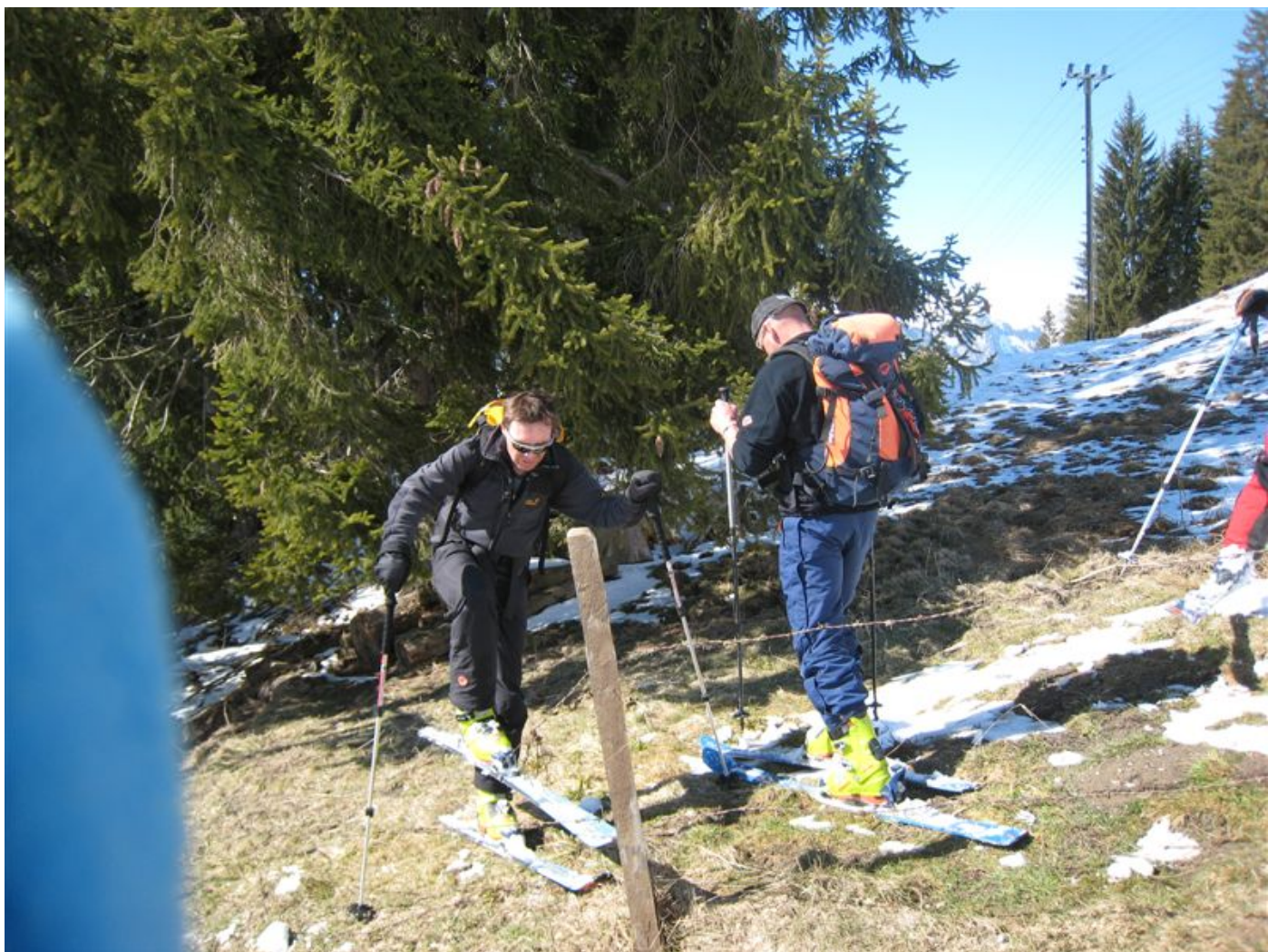
ganz eindeutig fehlt der Schnee