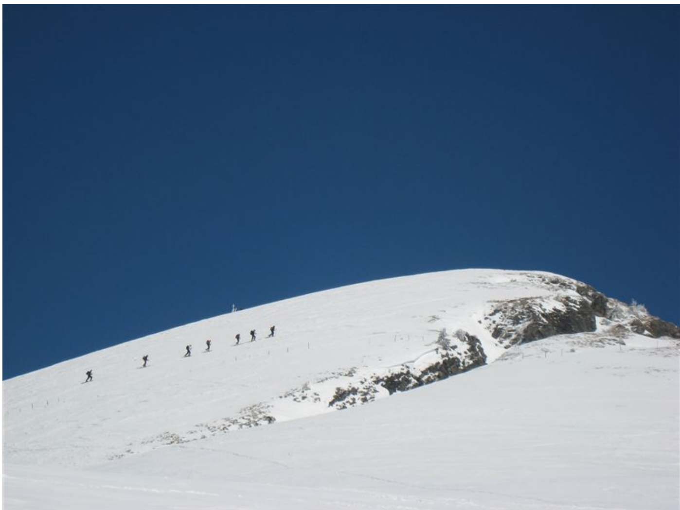
auf den letzten Metern