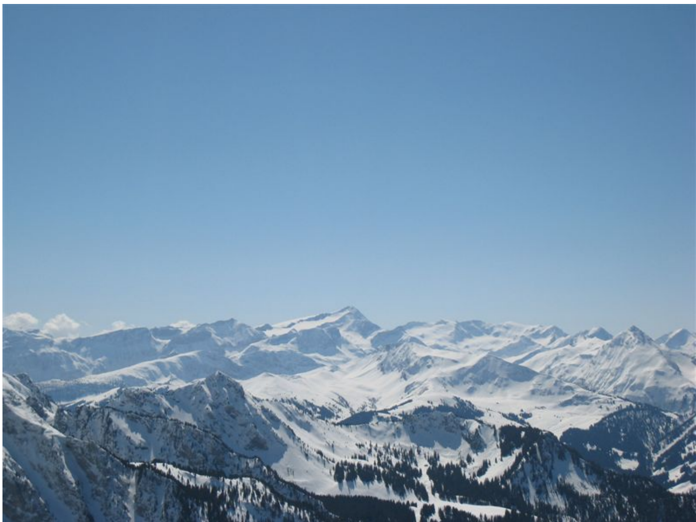
und das Wildhorn von oben