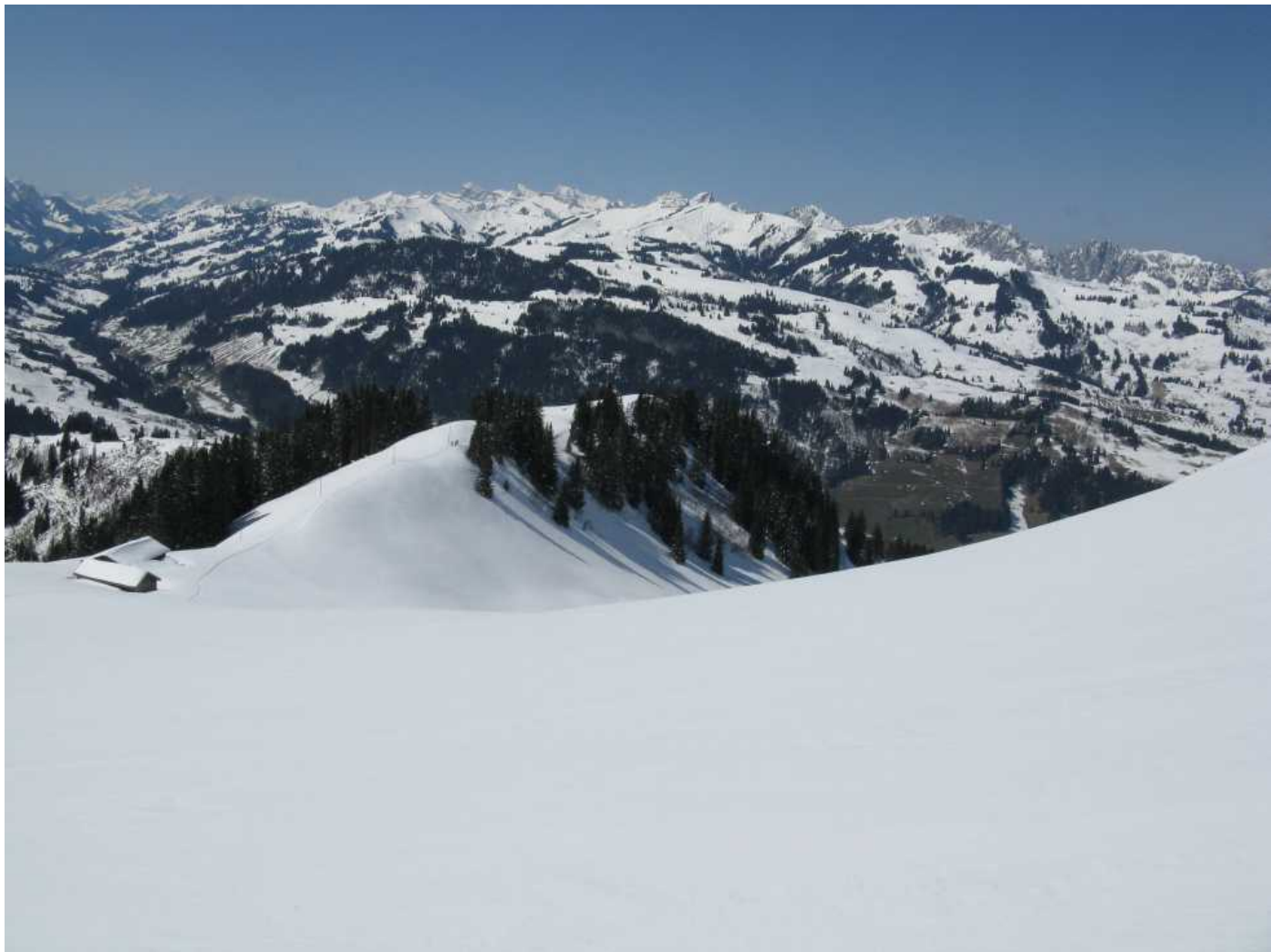
Blick Richtung Lenk