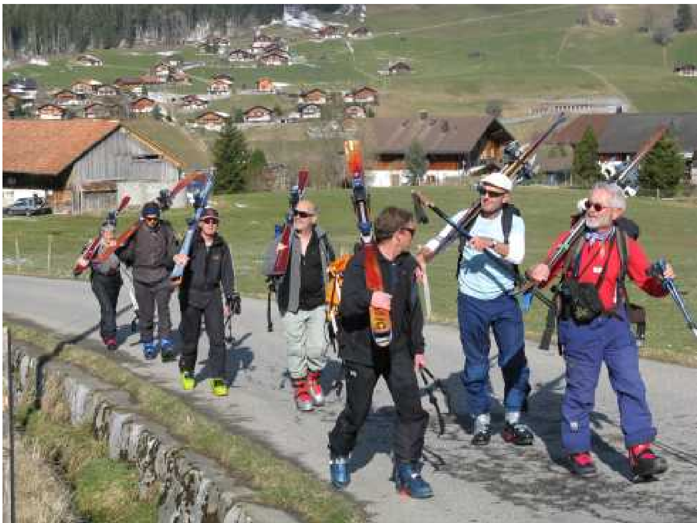
vom Bahnhof Zweisimmen