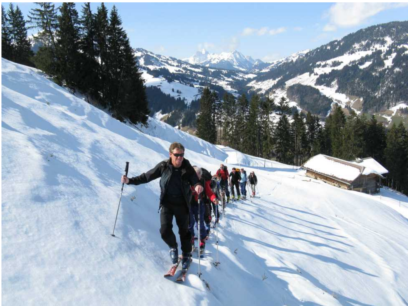
Aufstieg bei mildem Klima