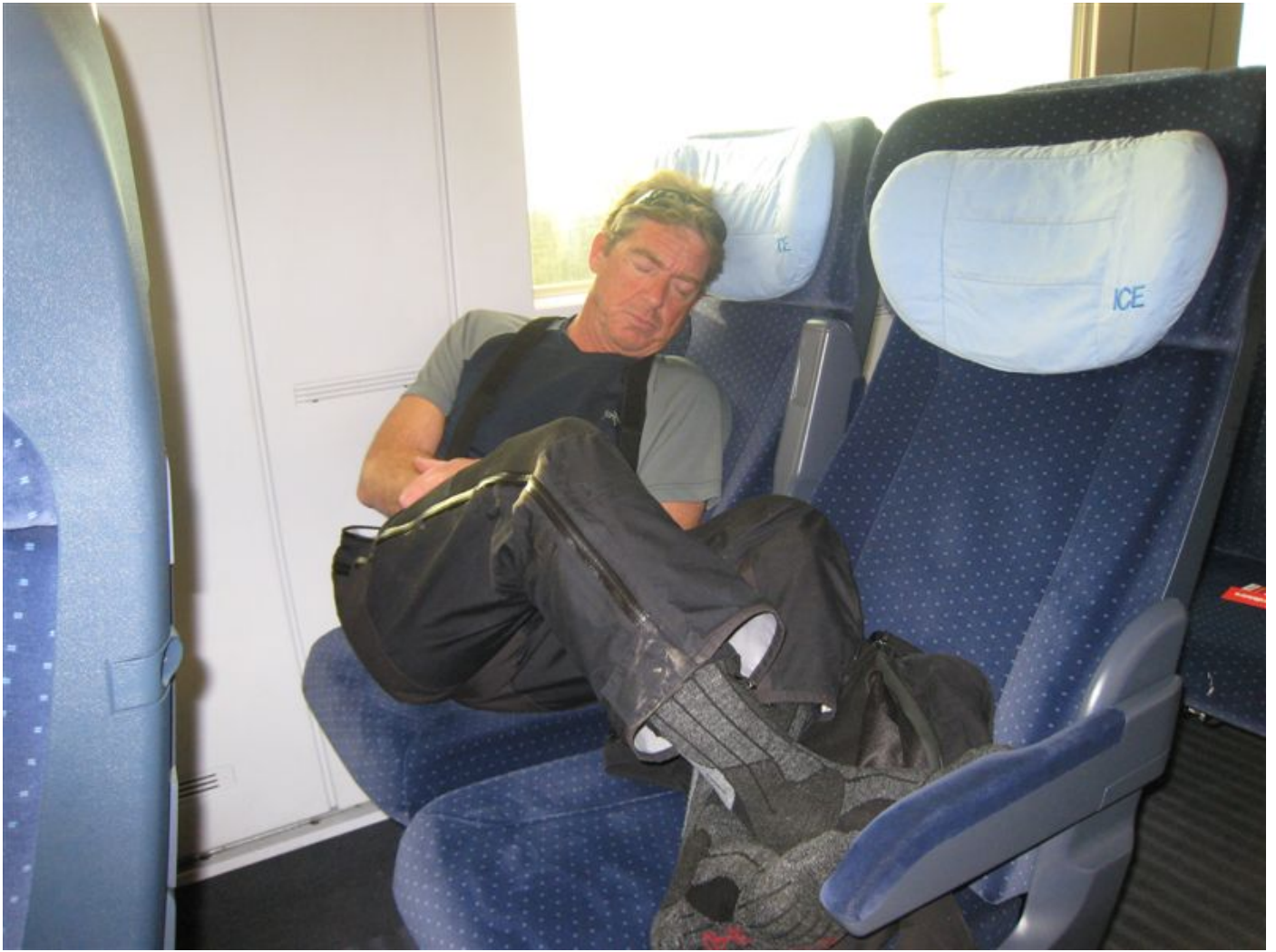
Müde von des Tages Last