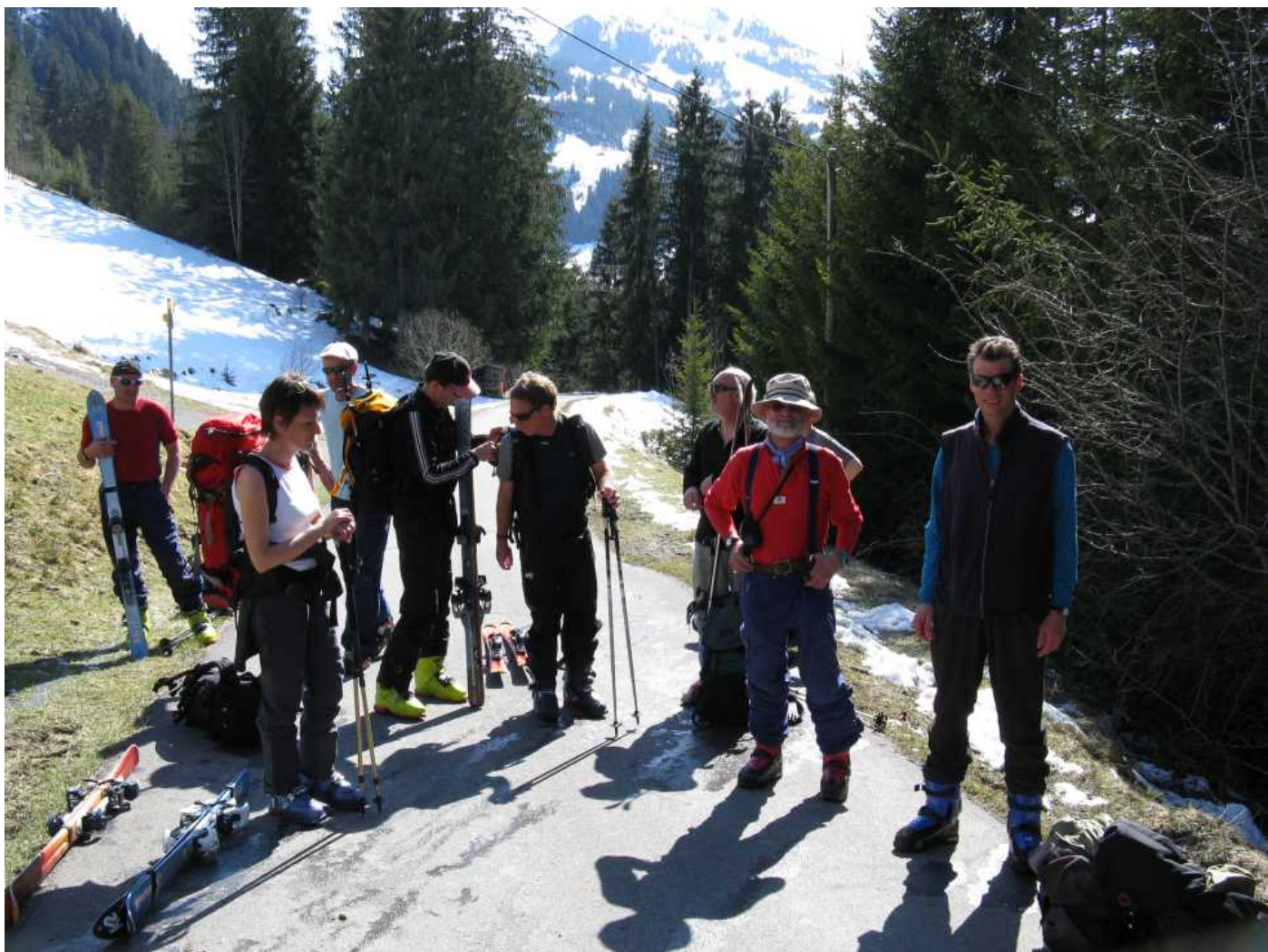
Das war echte Teamarbeit...