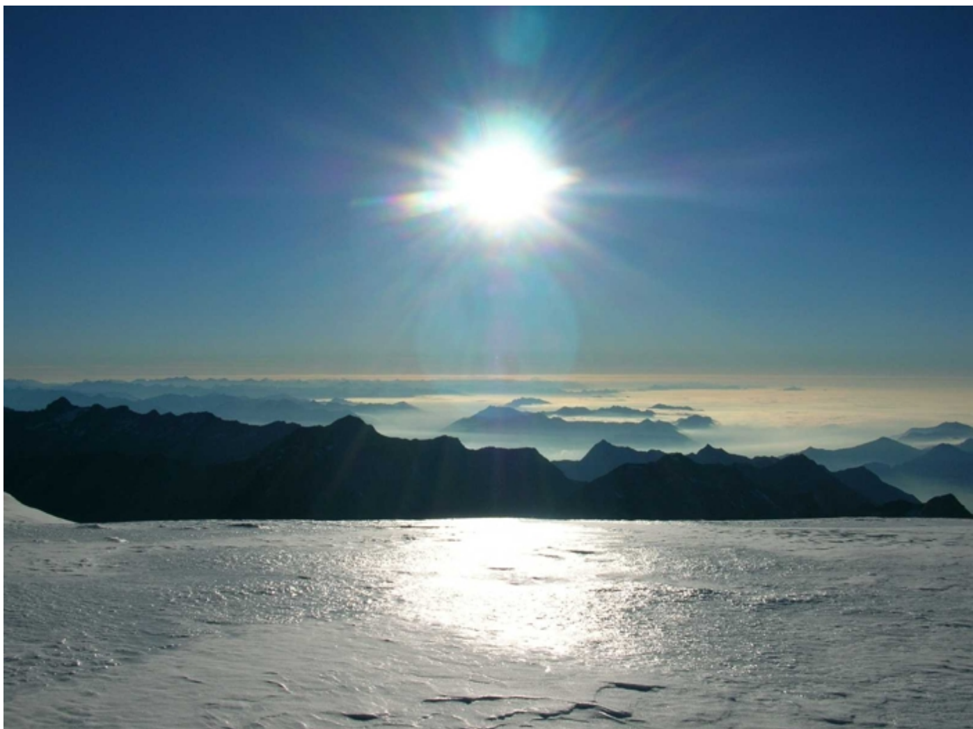
auf dem Plateau