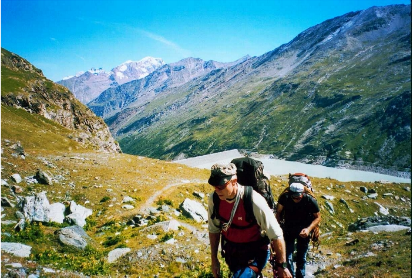
Auf den Spuren unserer südlichen Nachbarn (über den Südgrat verläuft die bevorzugte Route der Italiener)