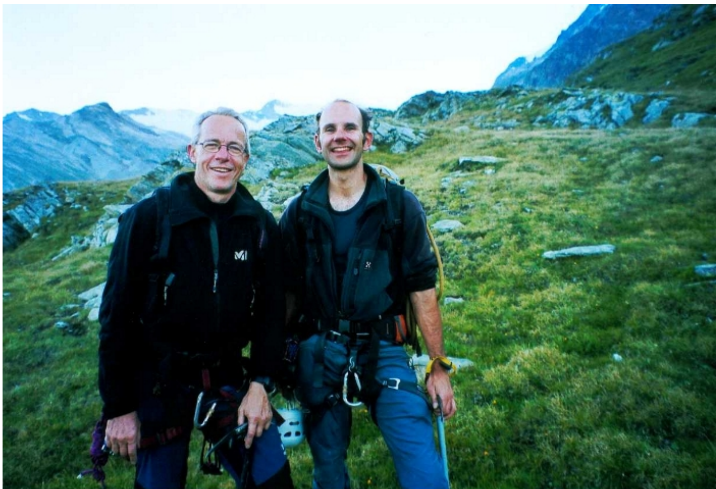
und endlich zurück