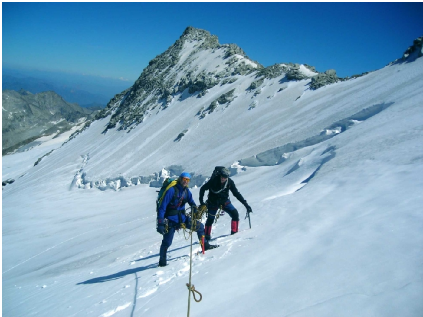
Oben beim Schwarzberggletscher