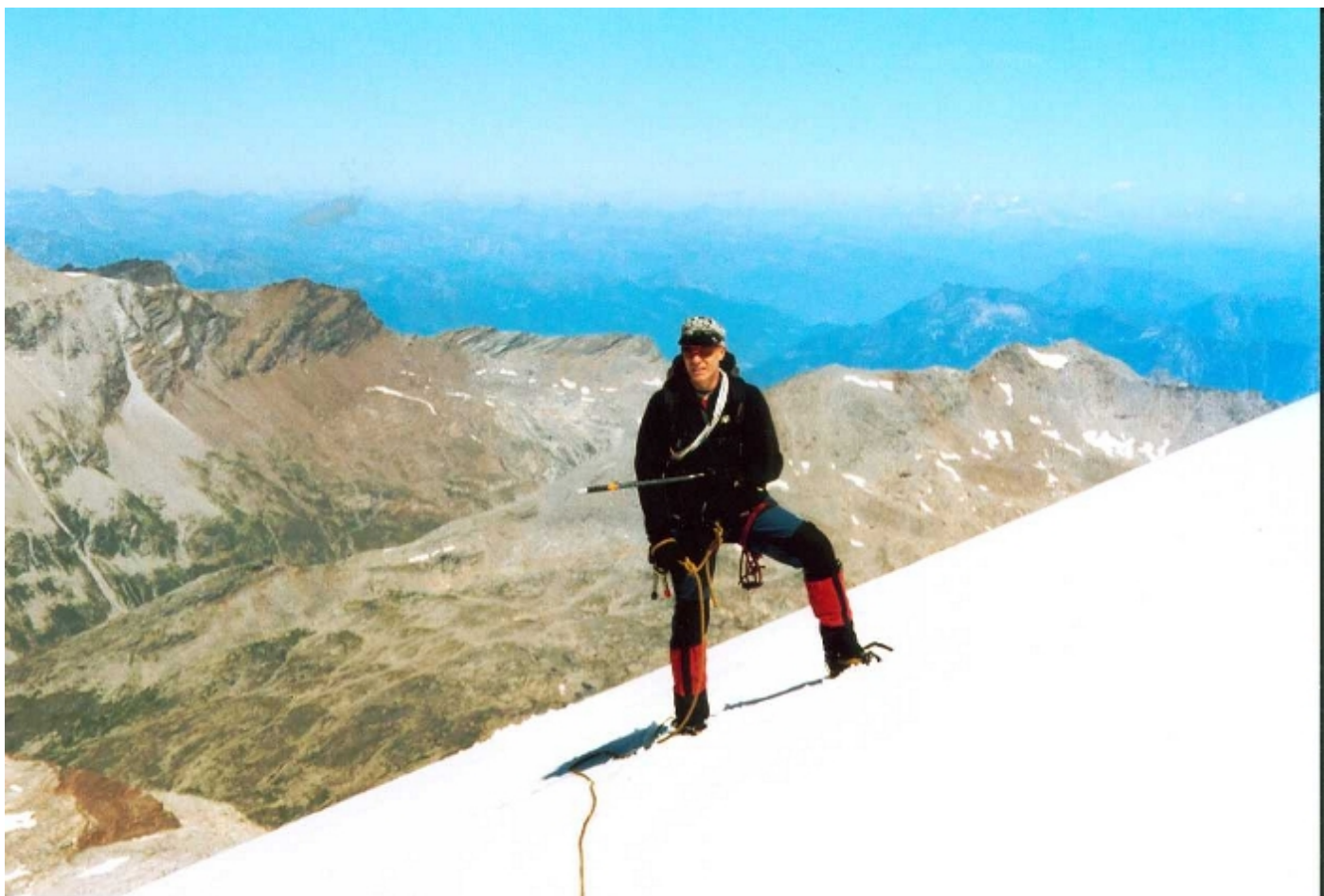
Da geht's hin