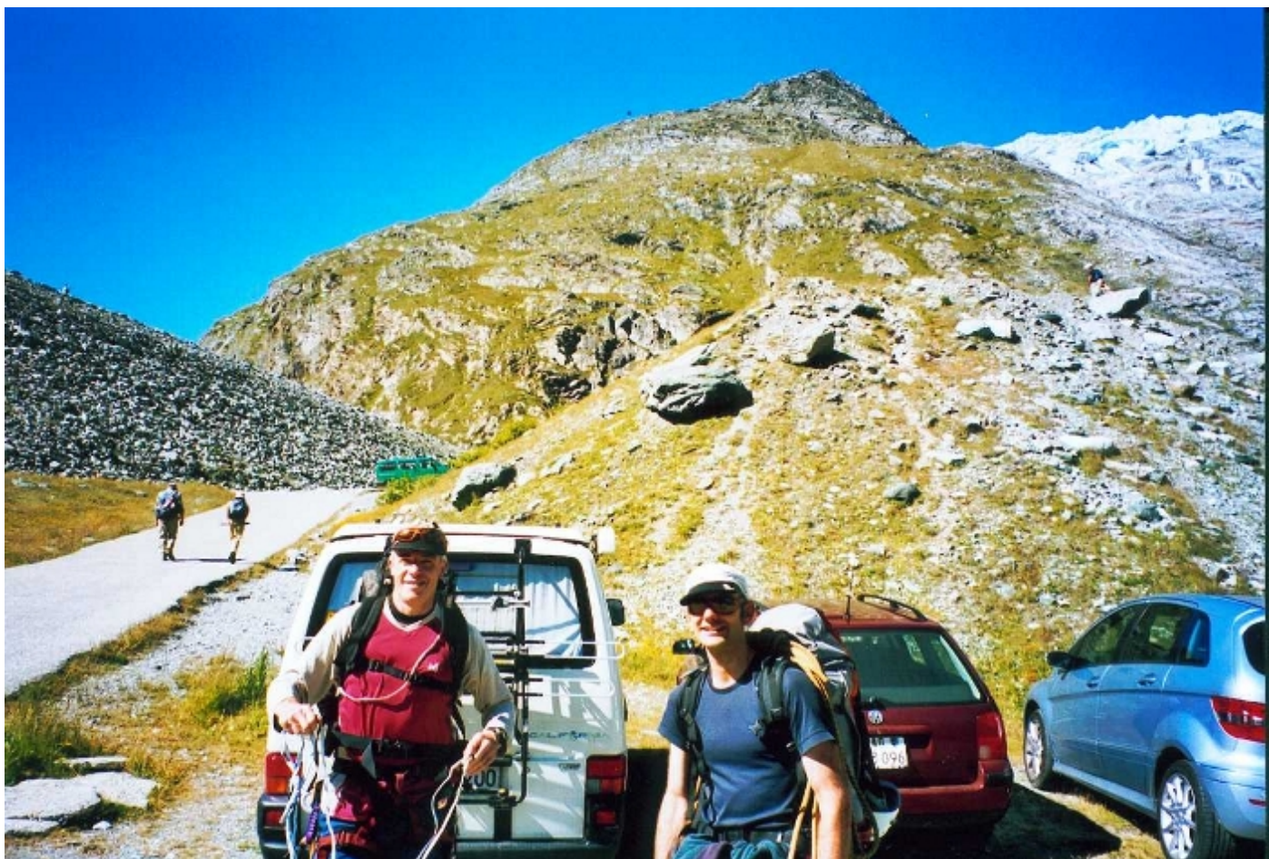
Wie alles begann... beim Mattmarksee