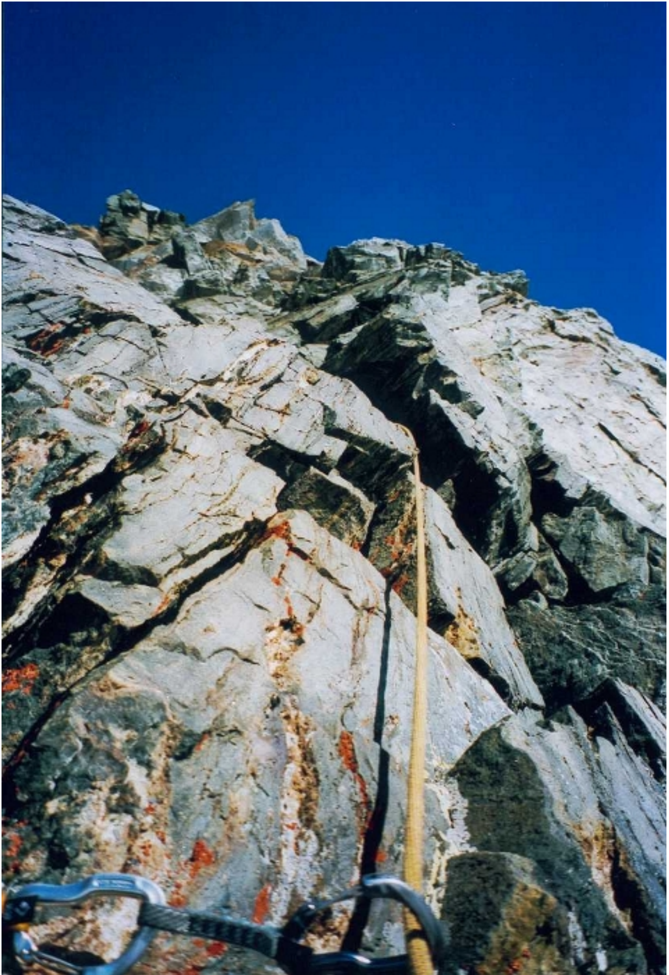
und mitten im Grat