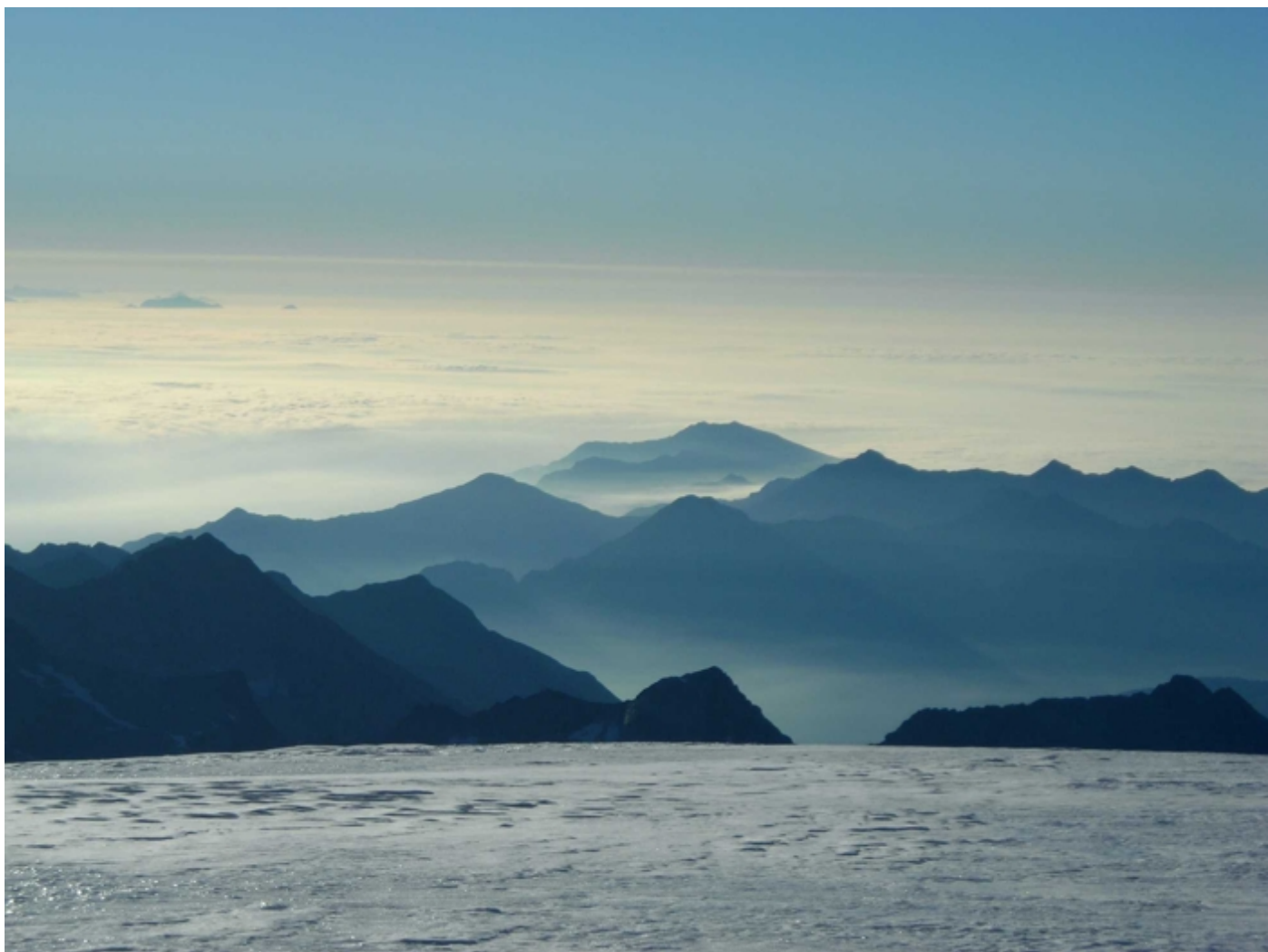
auf dem Plateau