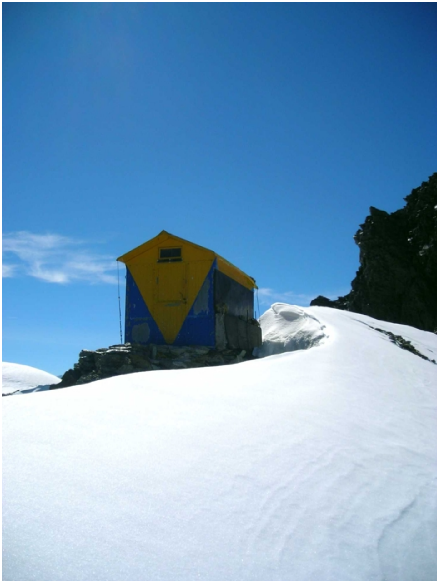
Biv. Citta di Luino