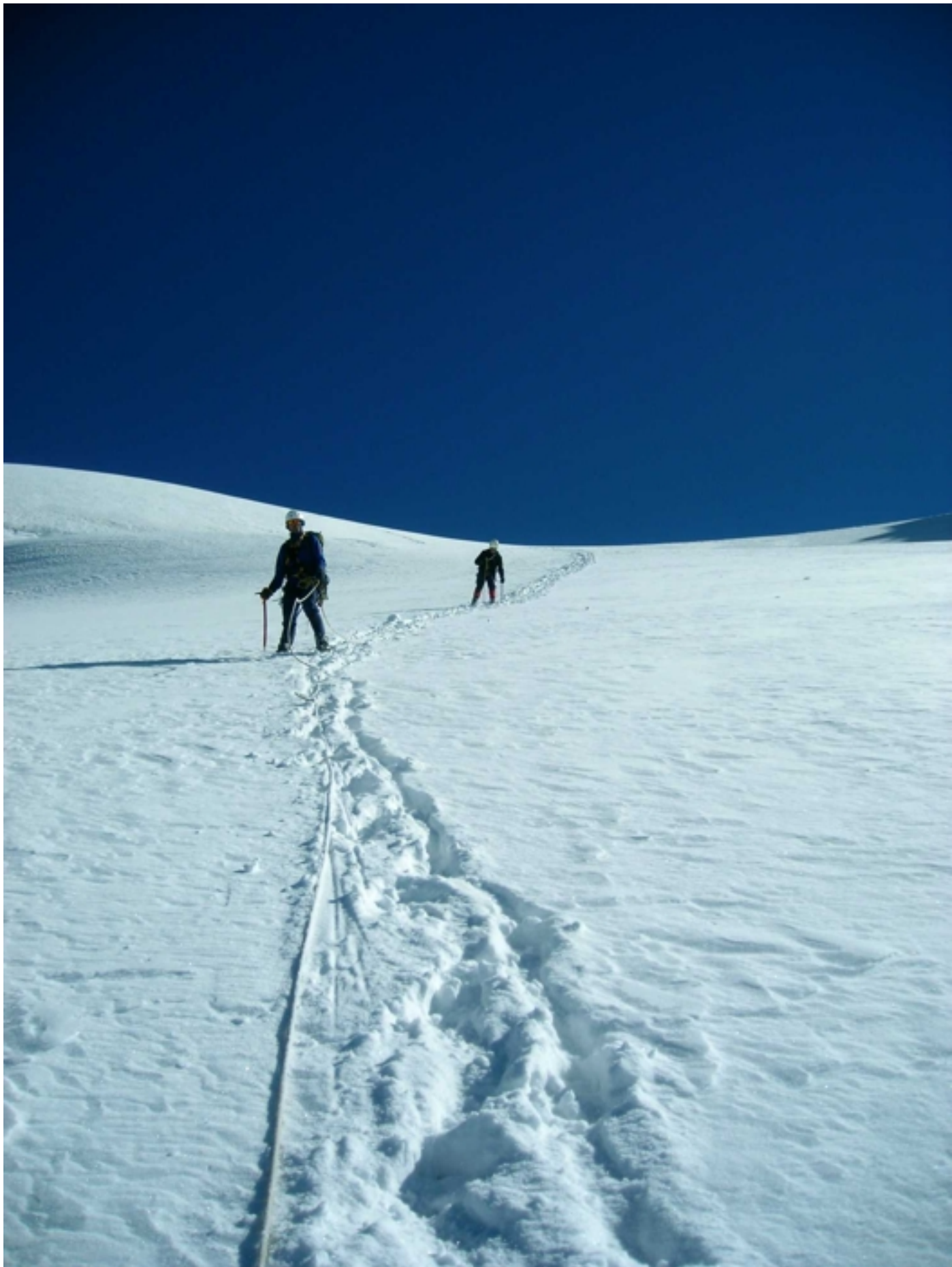
auf dem Abstieg