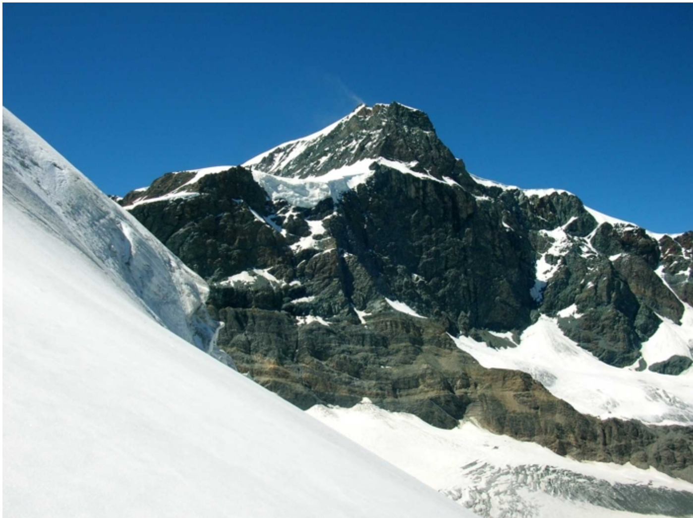
Ein stolzer Berg, so von der Südseite