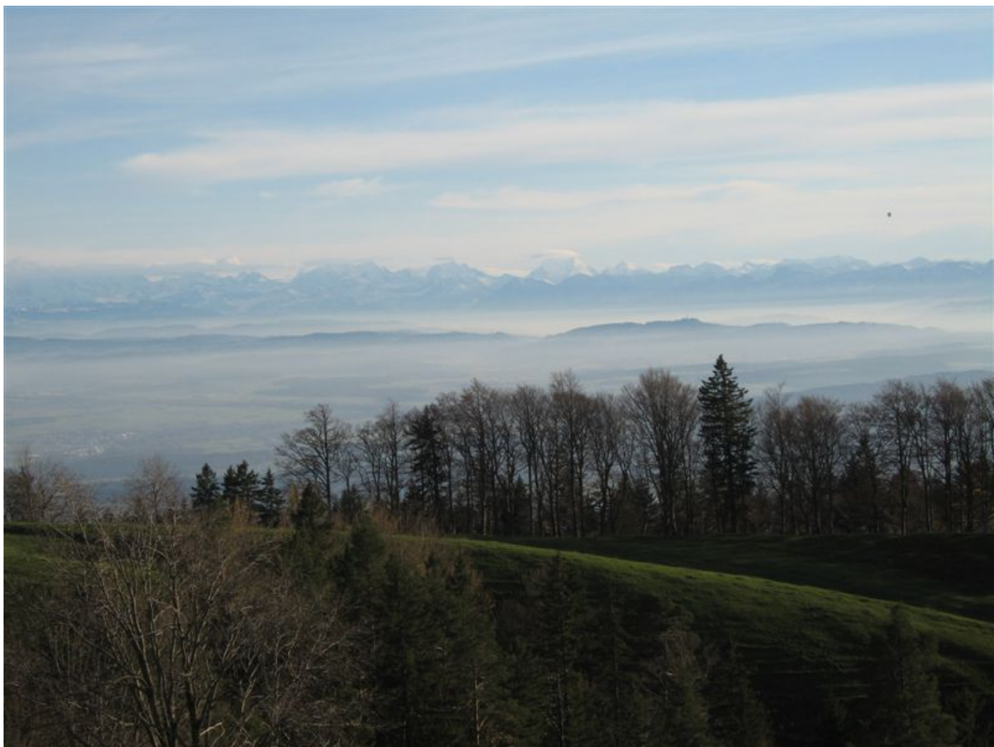
Bild 19 - Herbstliche Aussicht - wie im Bilderbuch