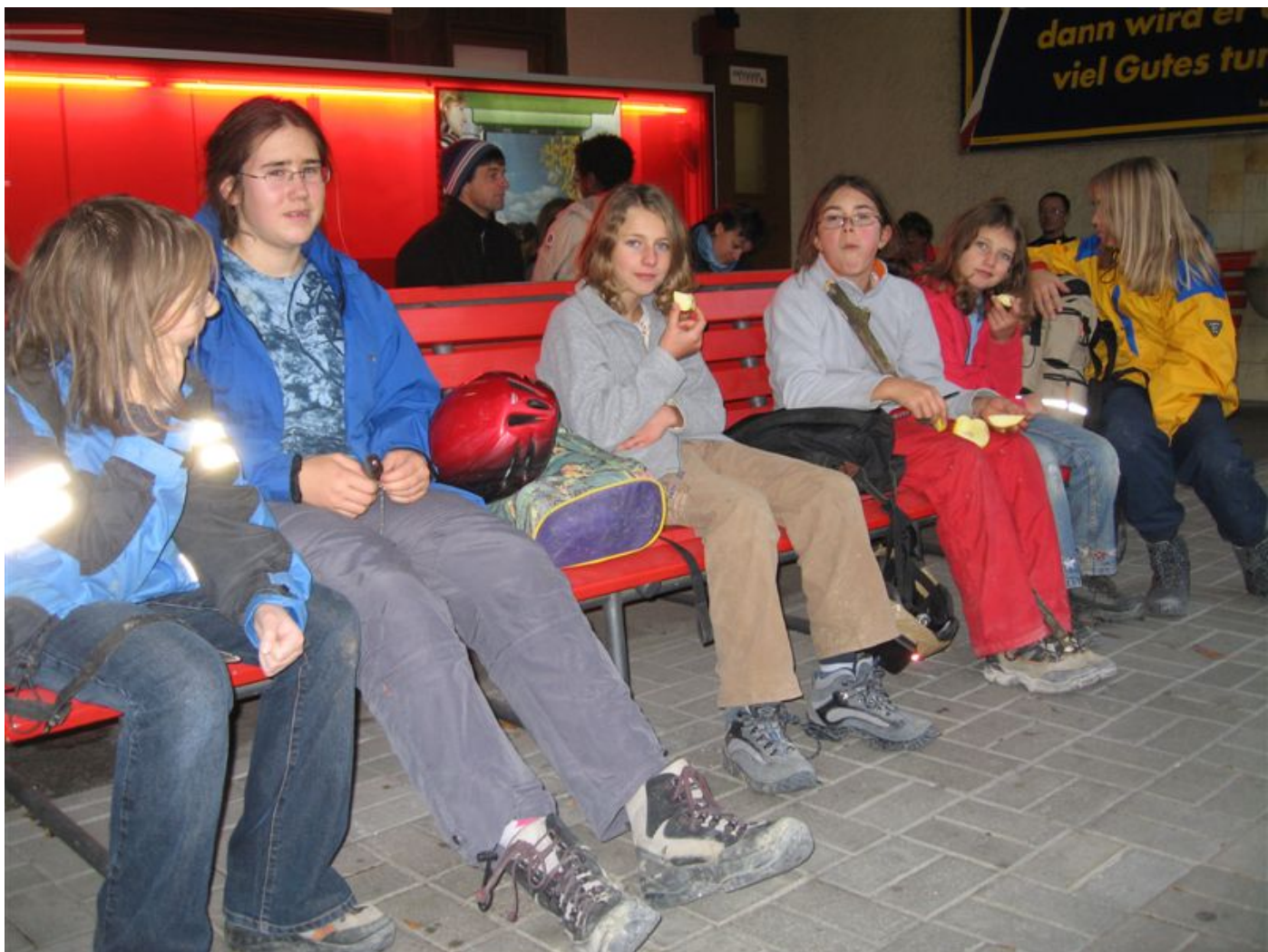
Bild 28 - Bald komm der Zug von Moutier