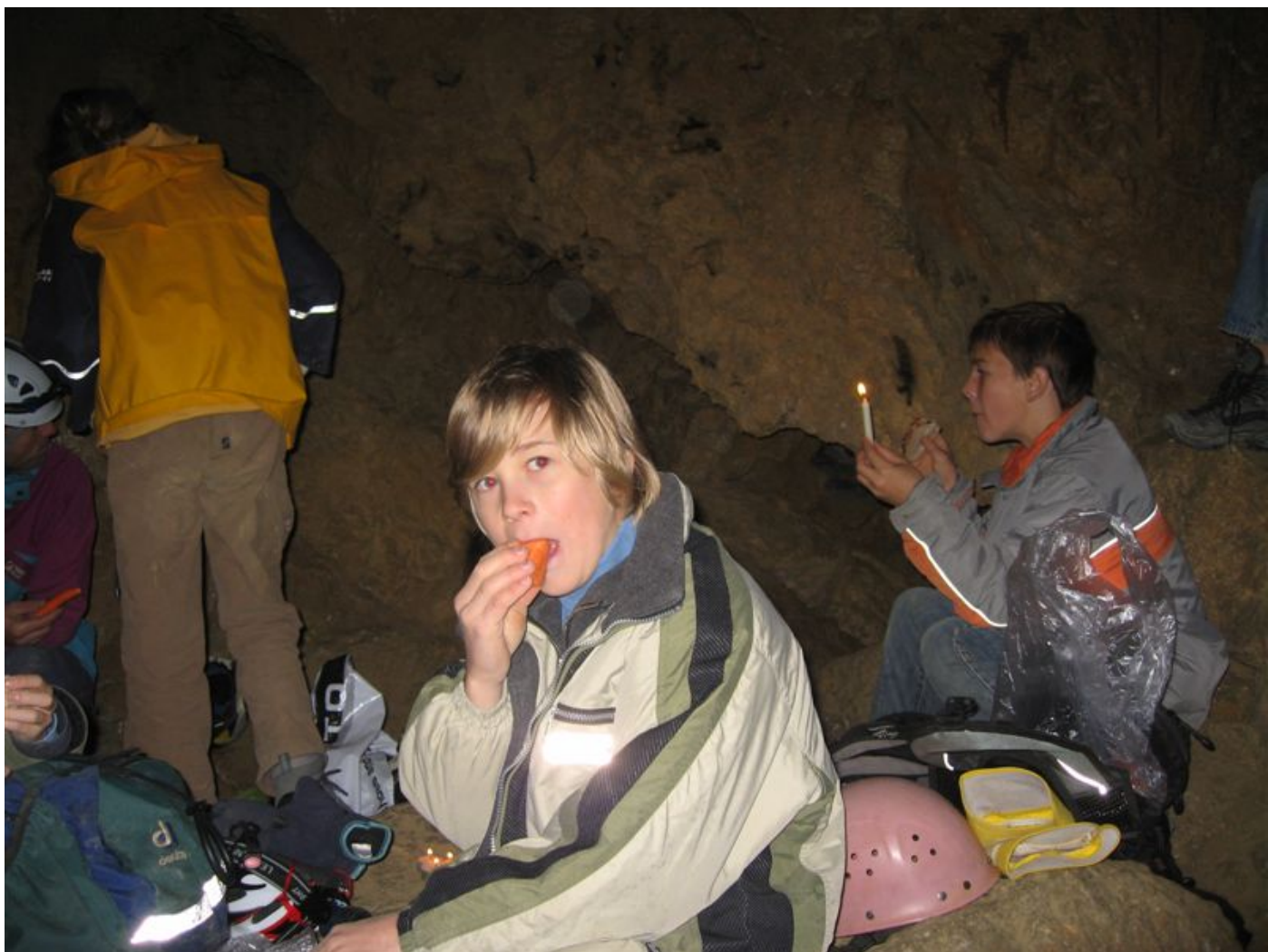
Bild 11 - Mittagsrast bei Kerzenlicht