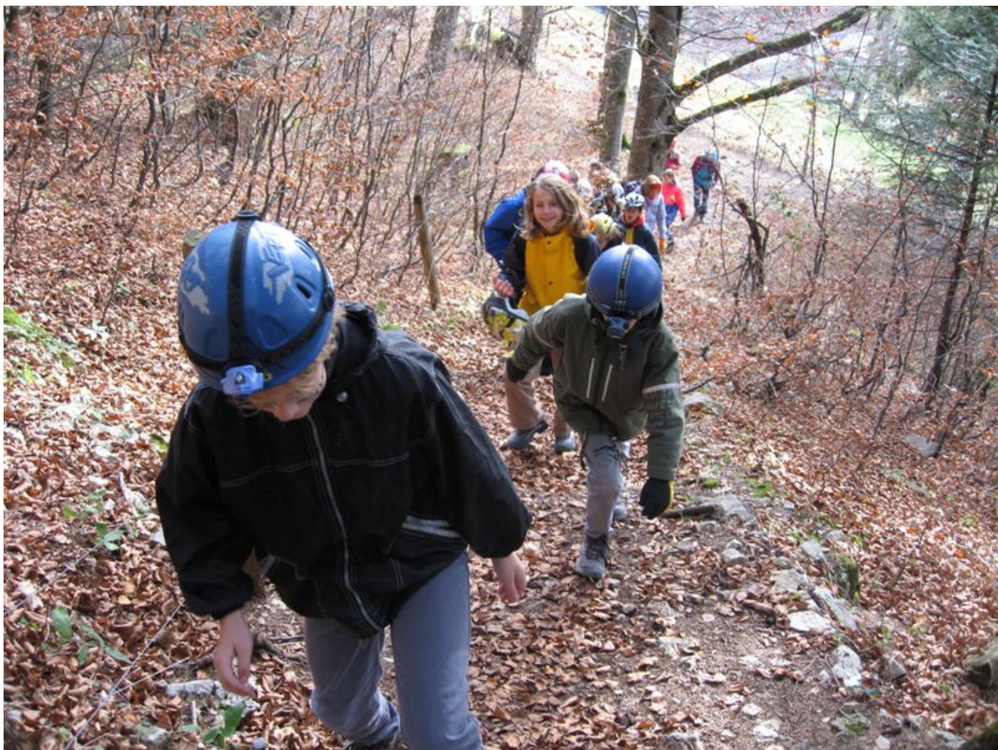
Bild 4 - Kurzer Aufstieg durch den Herbstwald