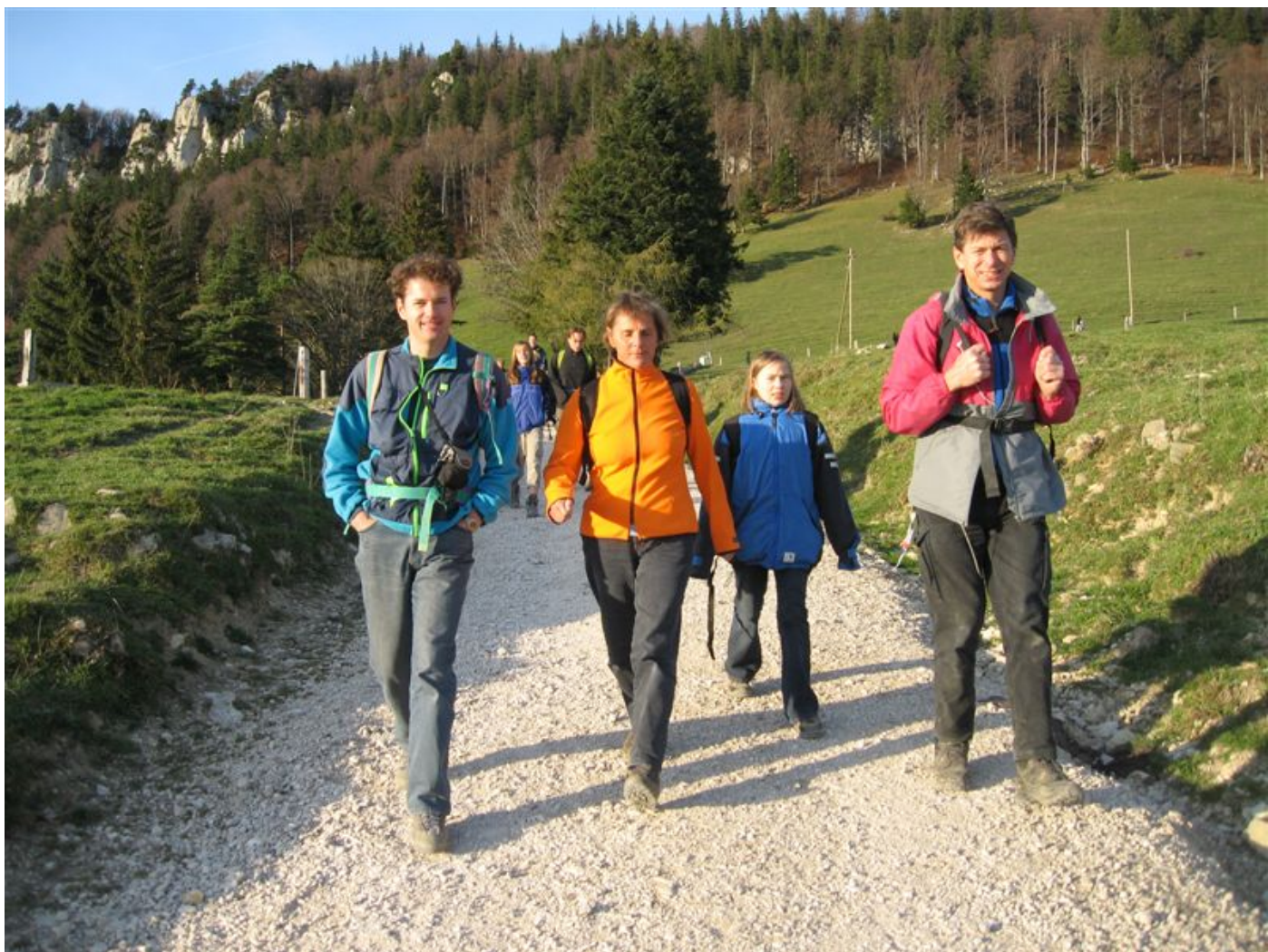
Bild 22 - Links, rechts, links, rechts...