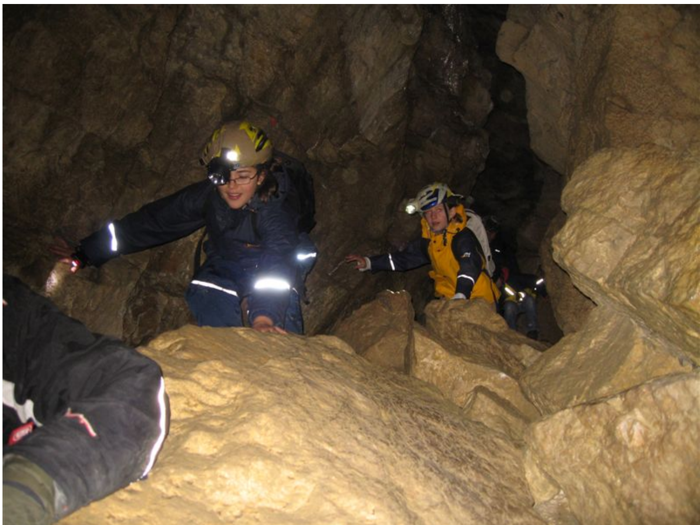
Bild 6 - Jetzt sind wir unter Tag