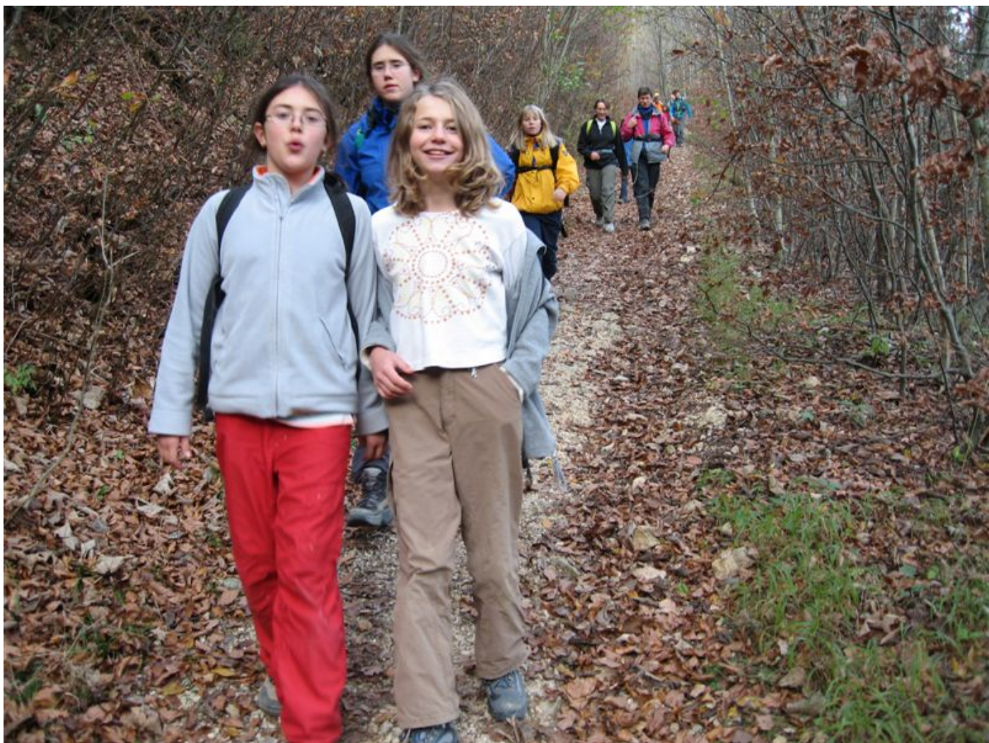
Bild 26 - Freundinnen