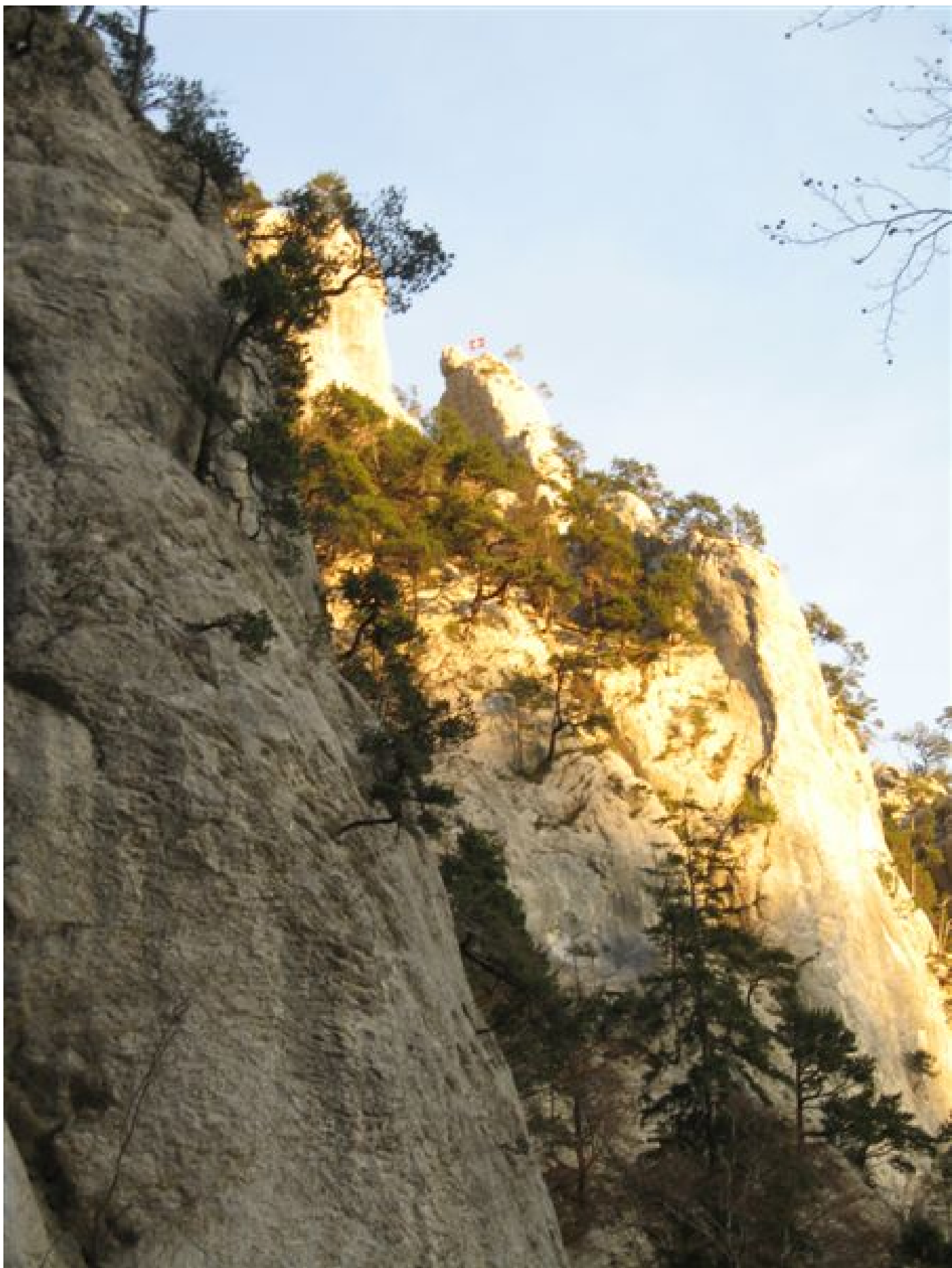
Bild 27 - Abendsonne in der Oberdörfler Chluis. Hier werden wir am 24. Juni 06 klettern!