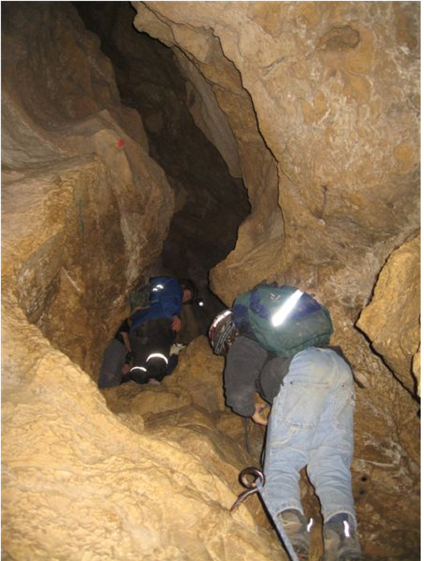
Bild 15 - Durch diese Schlucht toste einst das Wasser