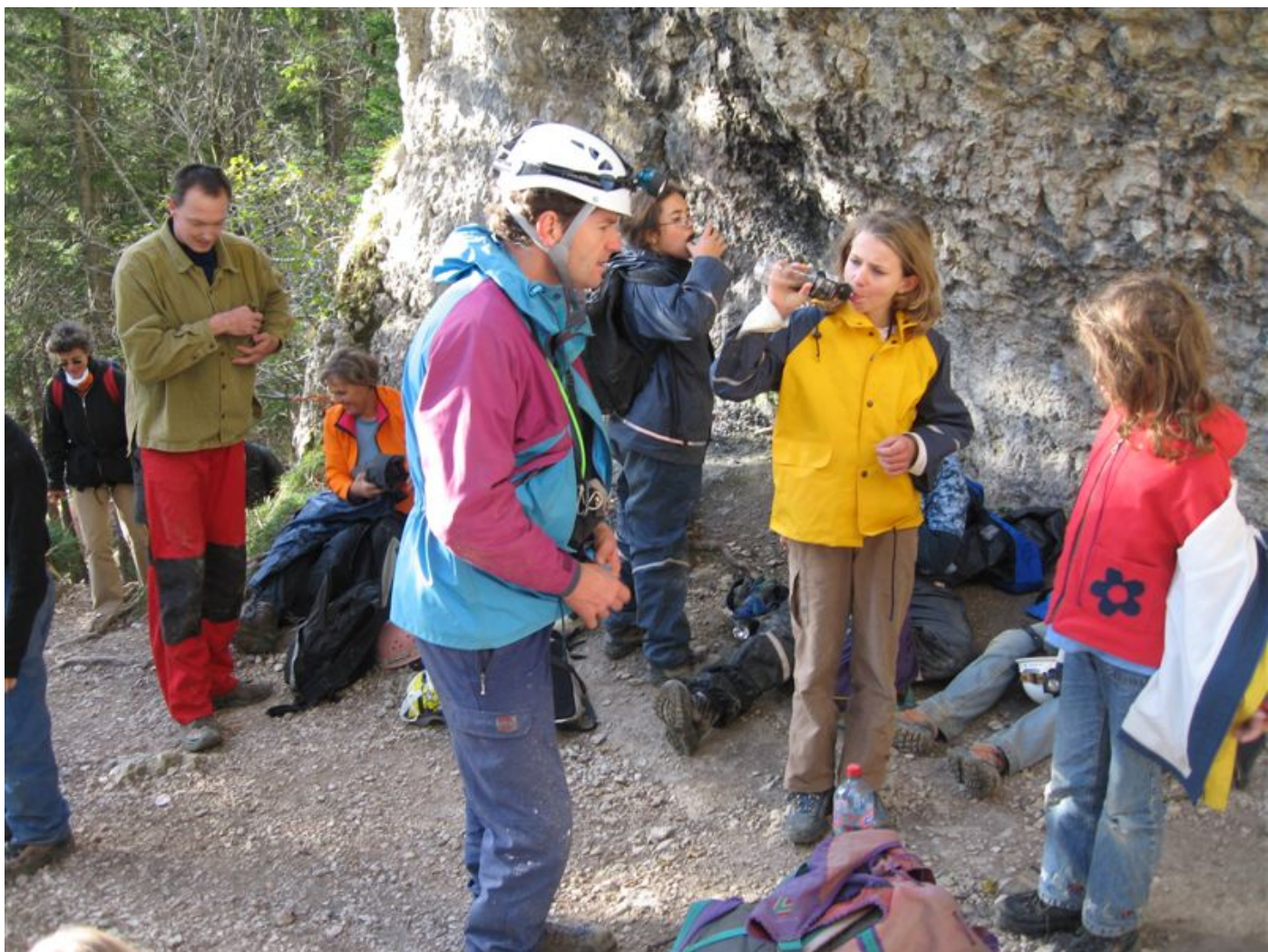
Bild 18 - Jetzt darf auch wieder getrunken werden