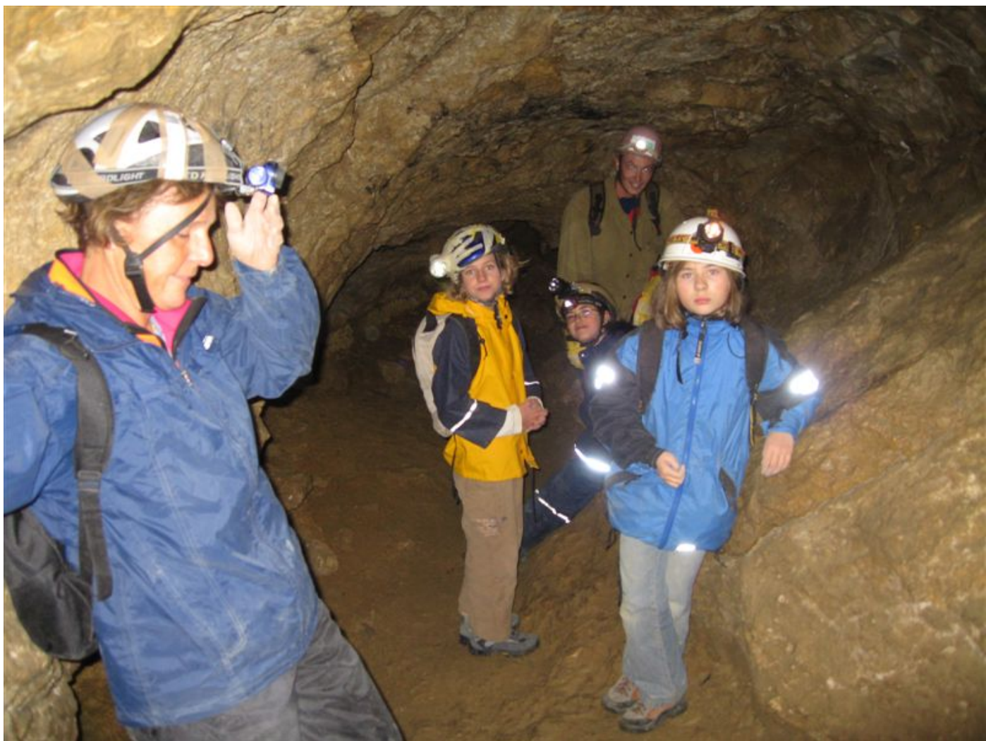
Bild 16 - Ein wenig müde sind wir doch geworden