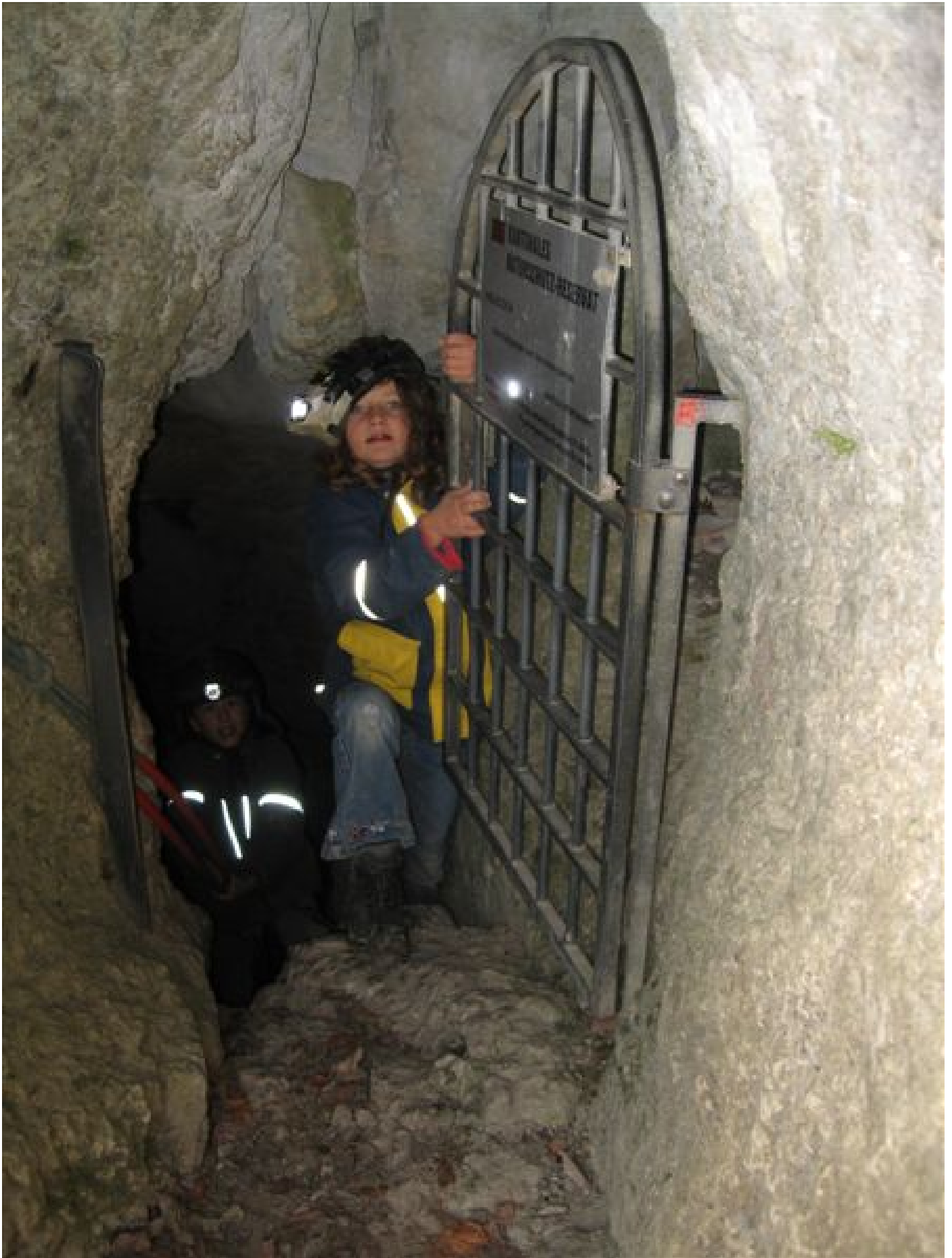
Bild 17 - Zurück ans Tageslicht