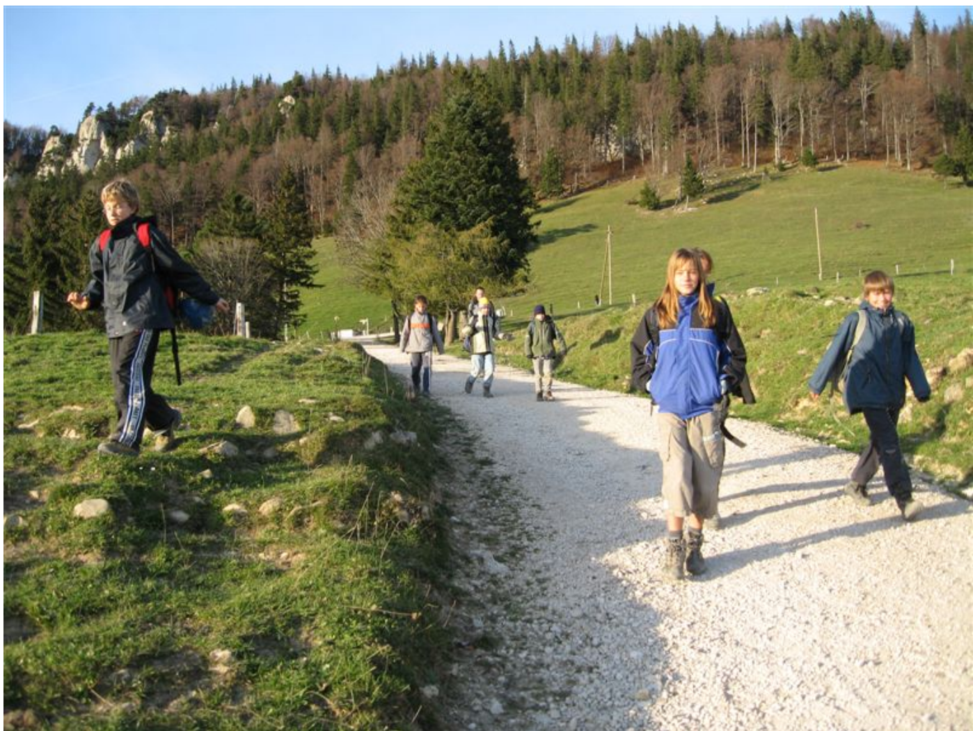
Bild 23 - Lockerer Spaziergang