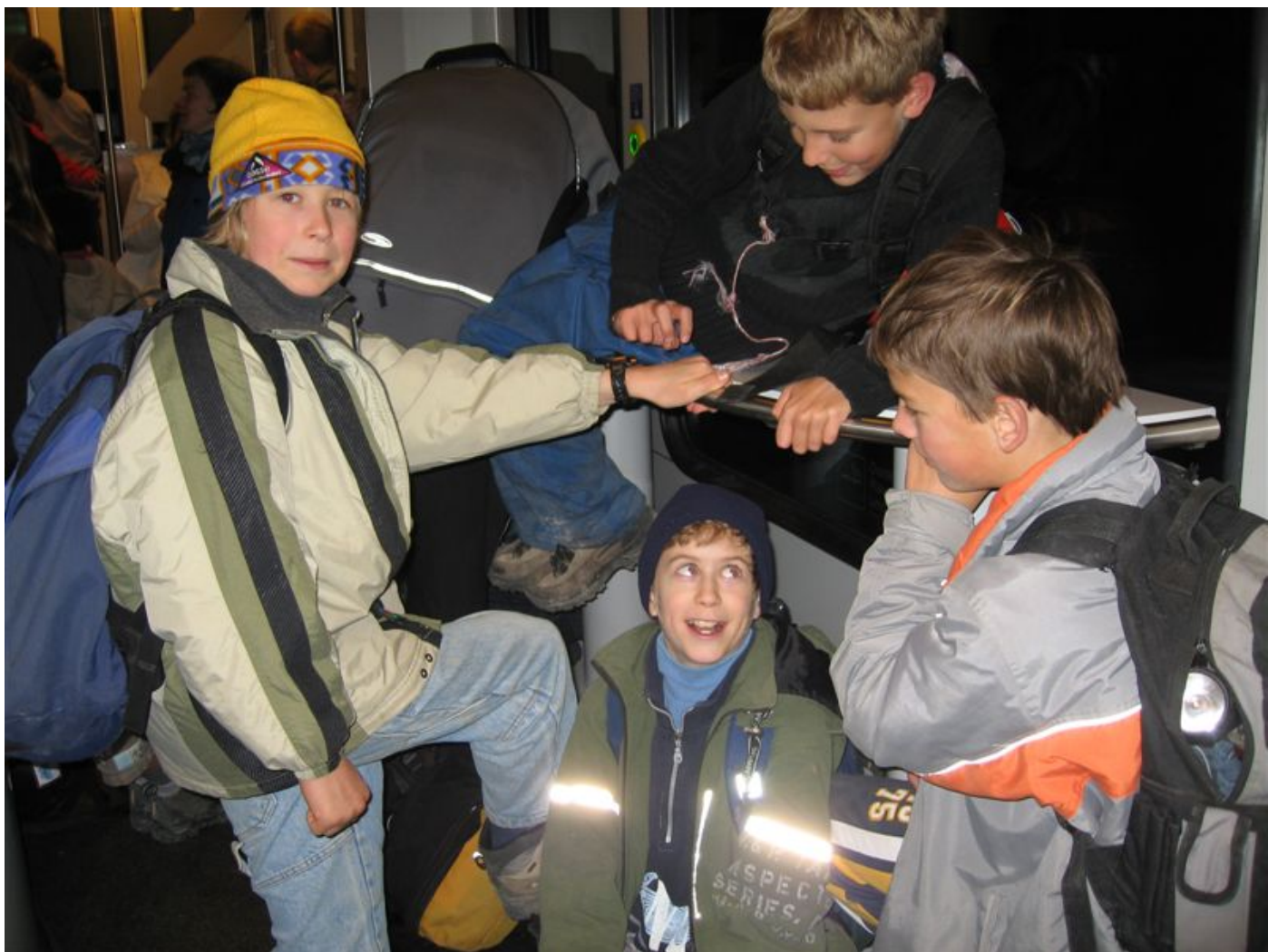
Bild 29 - Fröhliche Heimreise