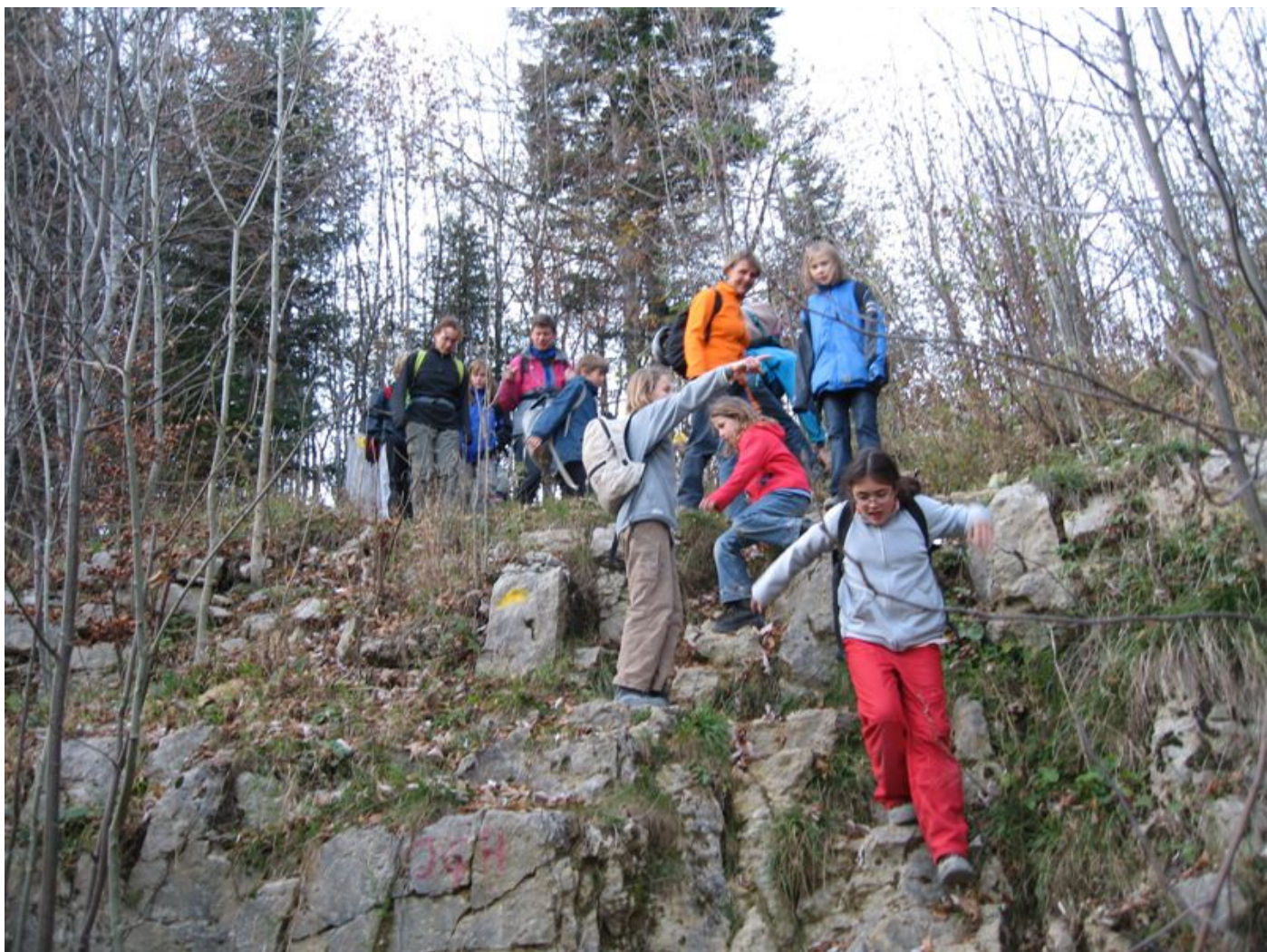
Bild 25 - Über Stock und Stein schwingt sich das Bein