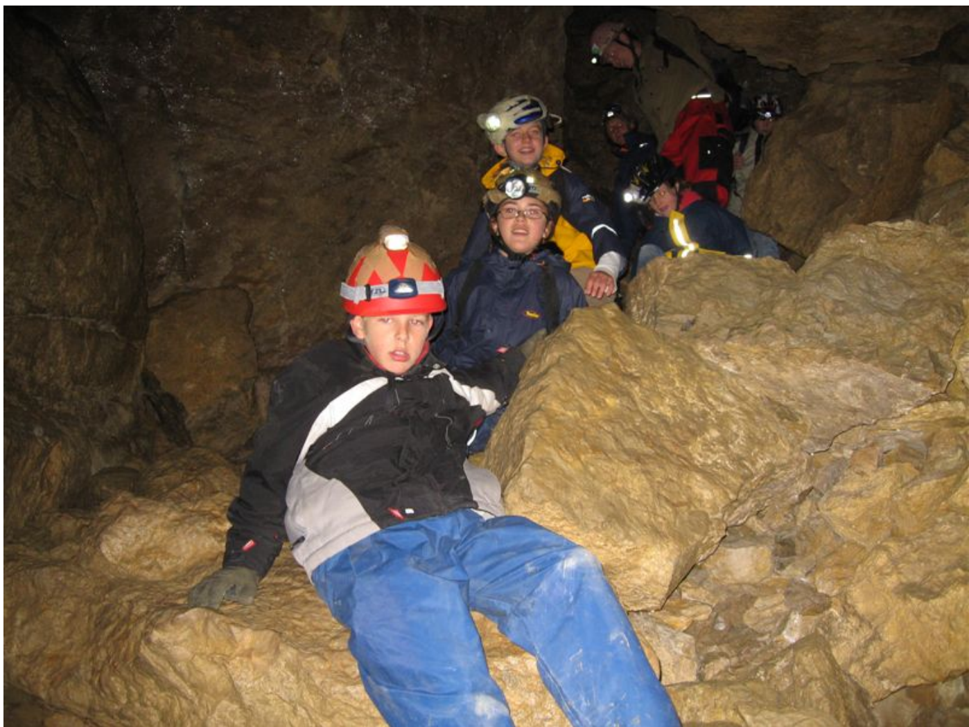
Bild 7 - Am besten über die Kante rutschen