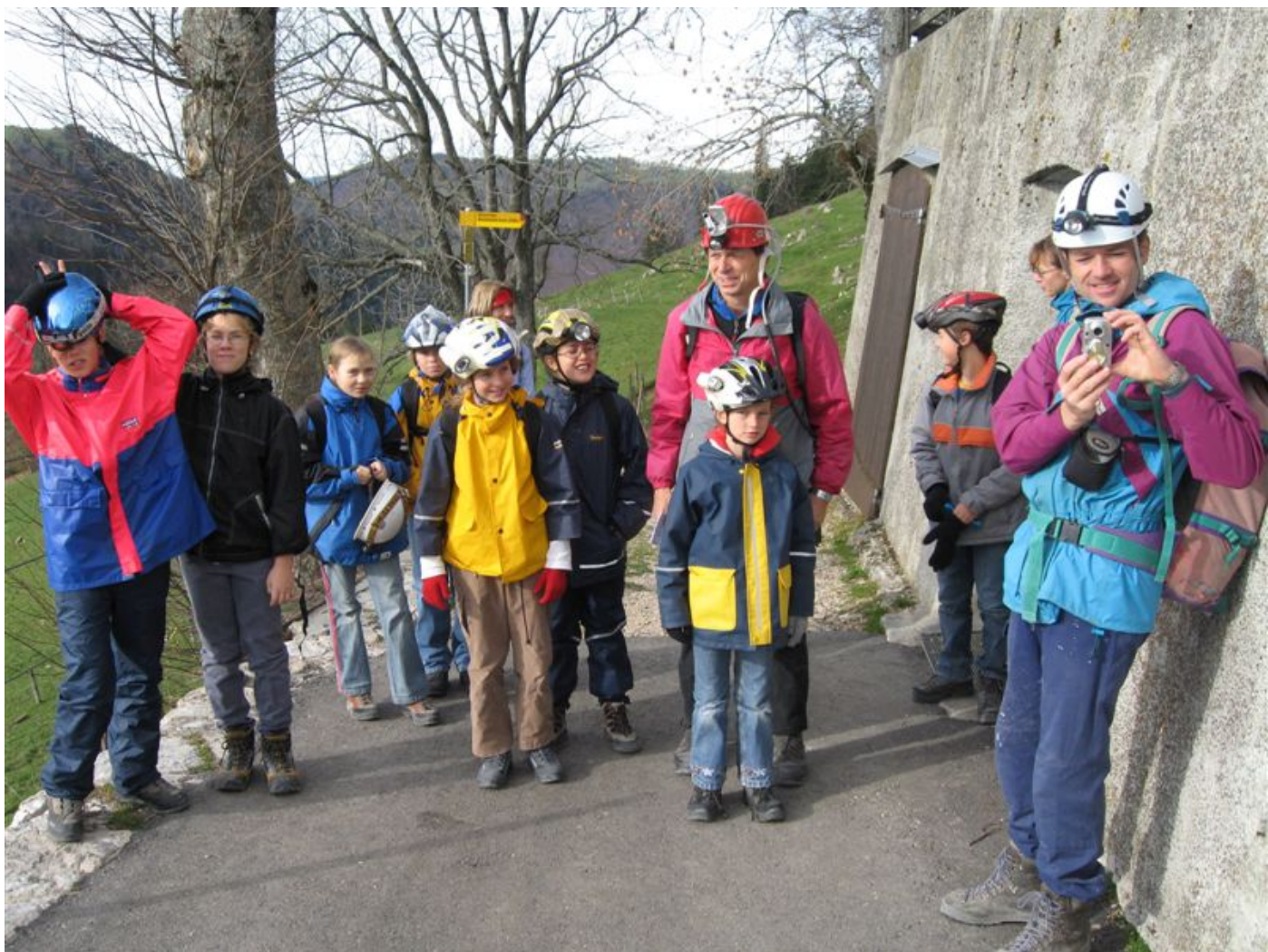
Bild 3 - Bereit für die Höhle