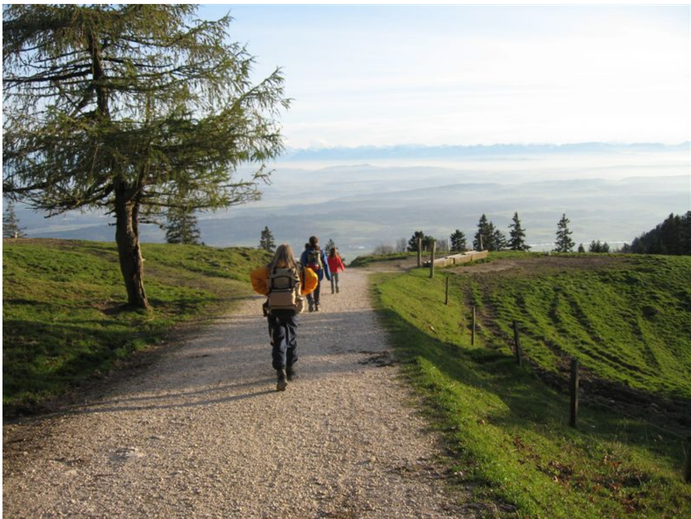
Bild 21 - In fröhlicher Stimmung bergab