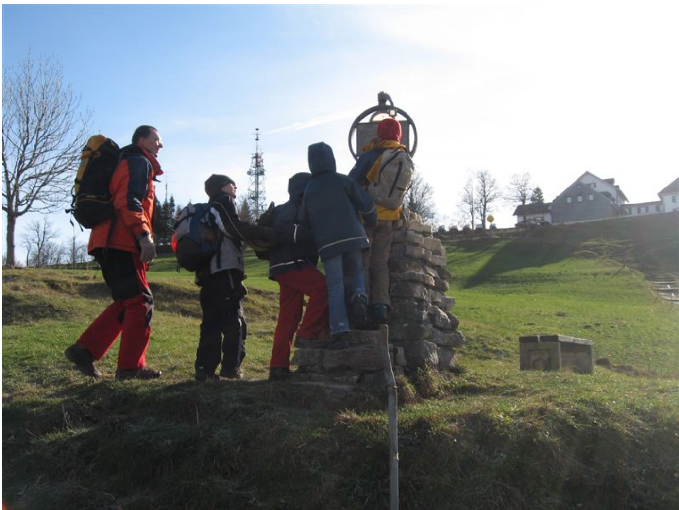
Bild 1 - Der Planetenweg vom Weissenstein zur Hasenmatt ist eine Attraktion