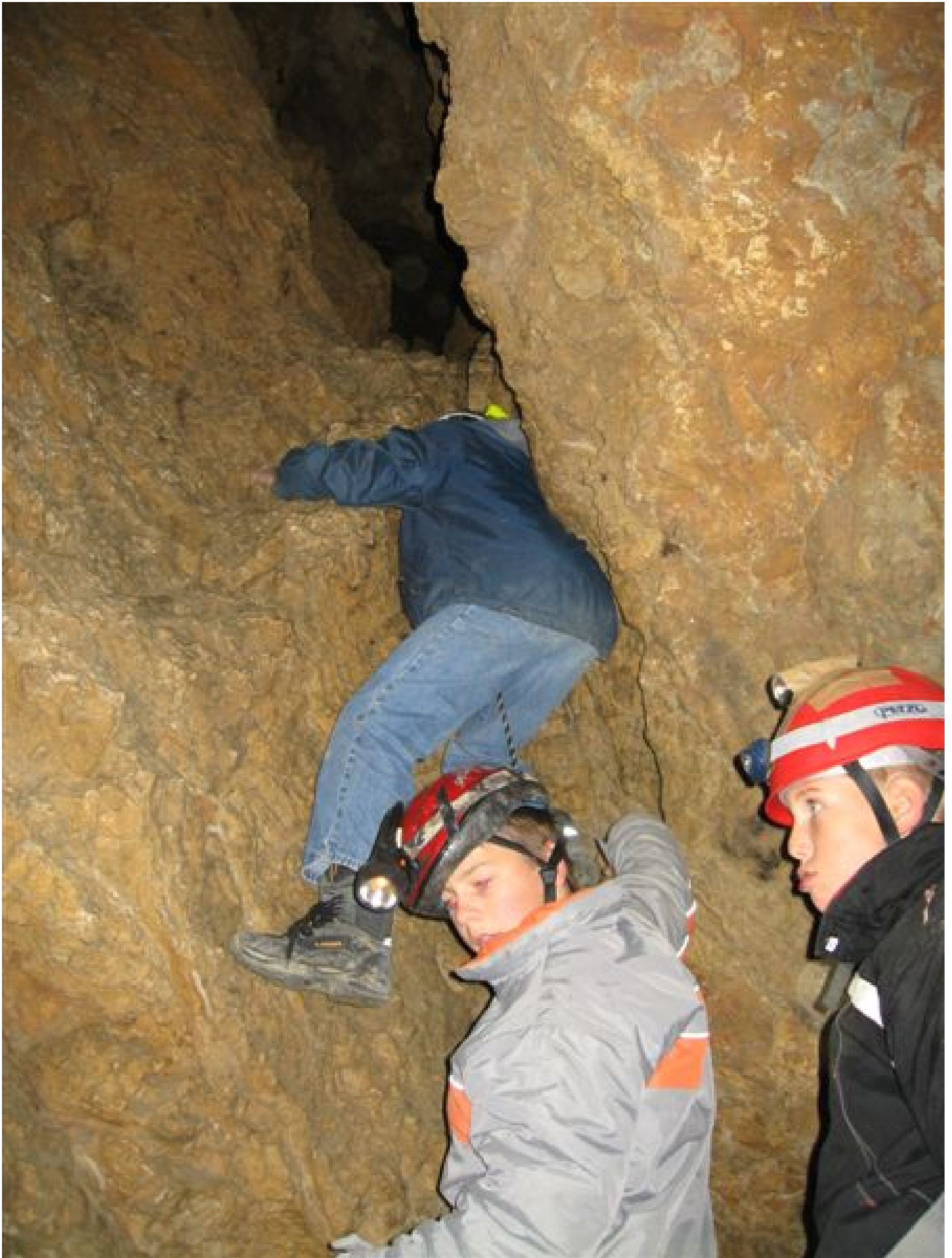
Bild 10 - Auch diese Klippe wird überwunden