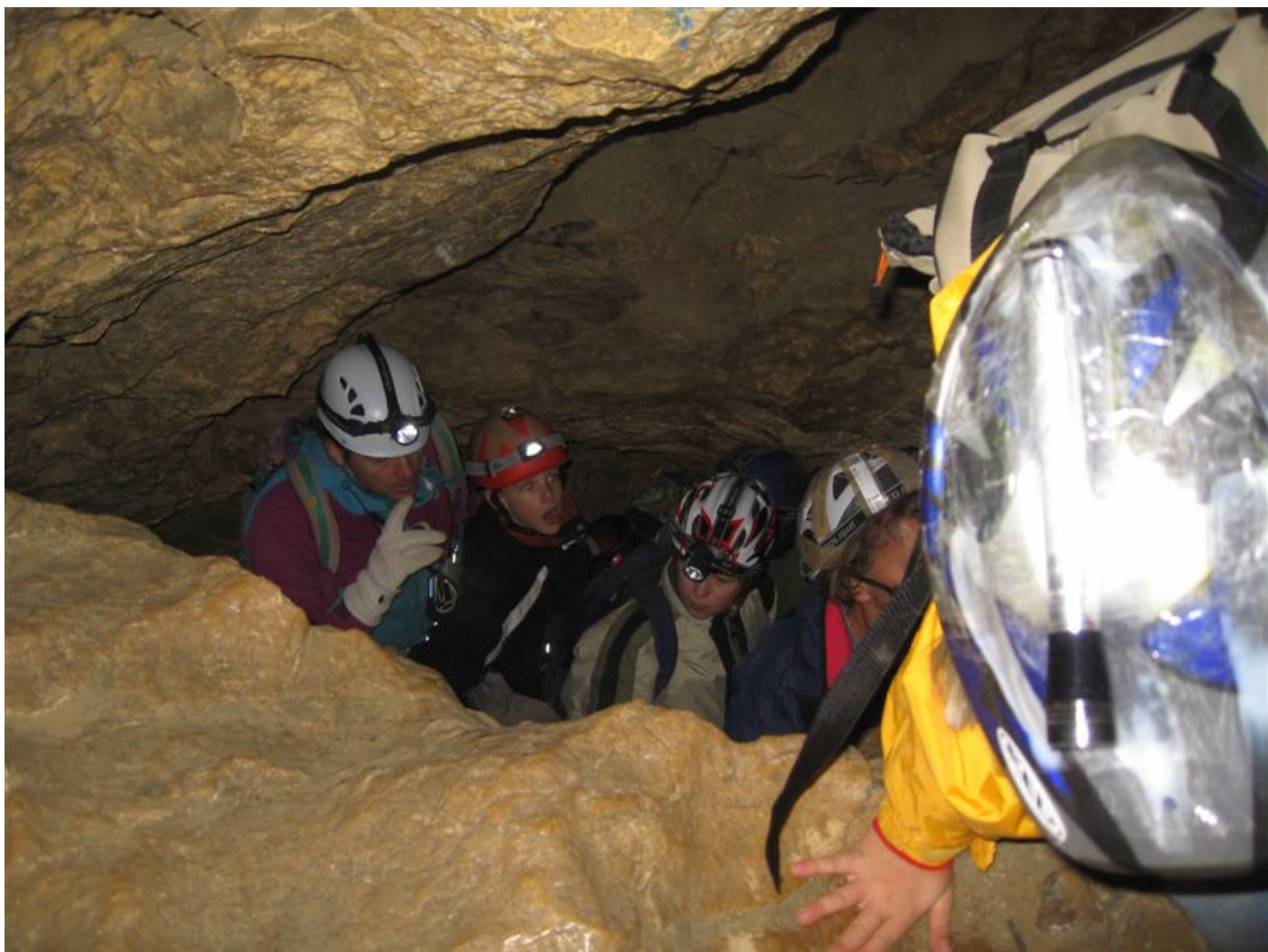
Bild 13 - Schlange stehen vor dem Hindernis