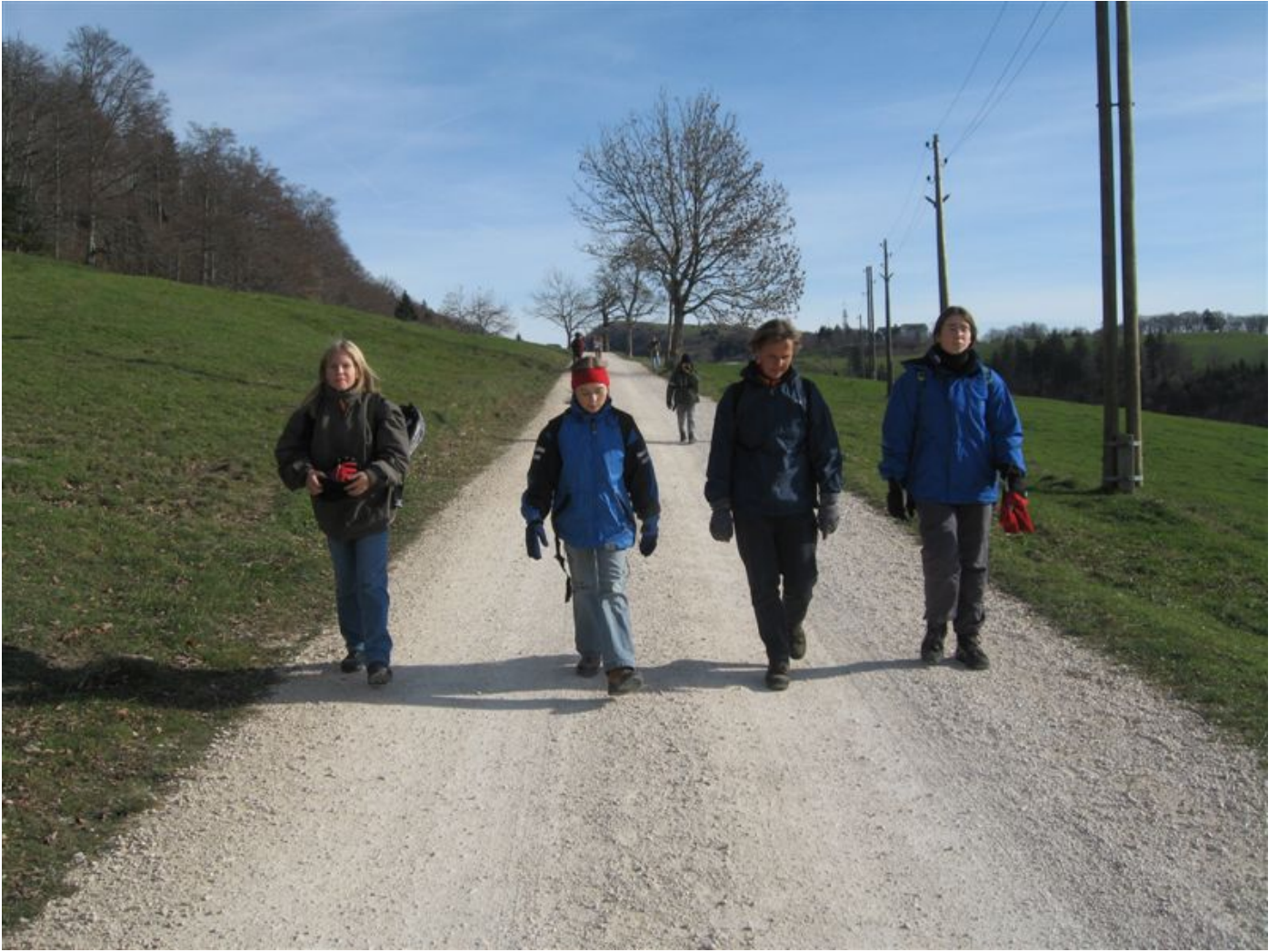
Bild 2 - In der Herbstsonne zum Hinteren