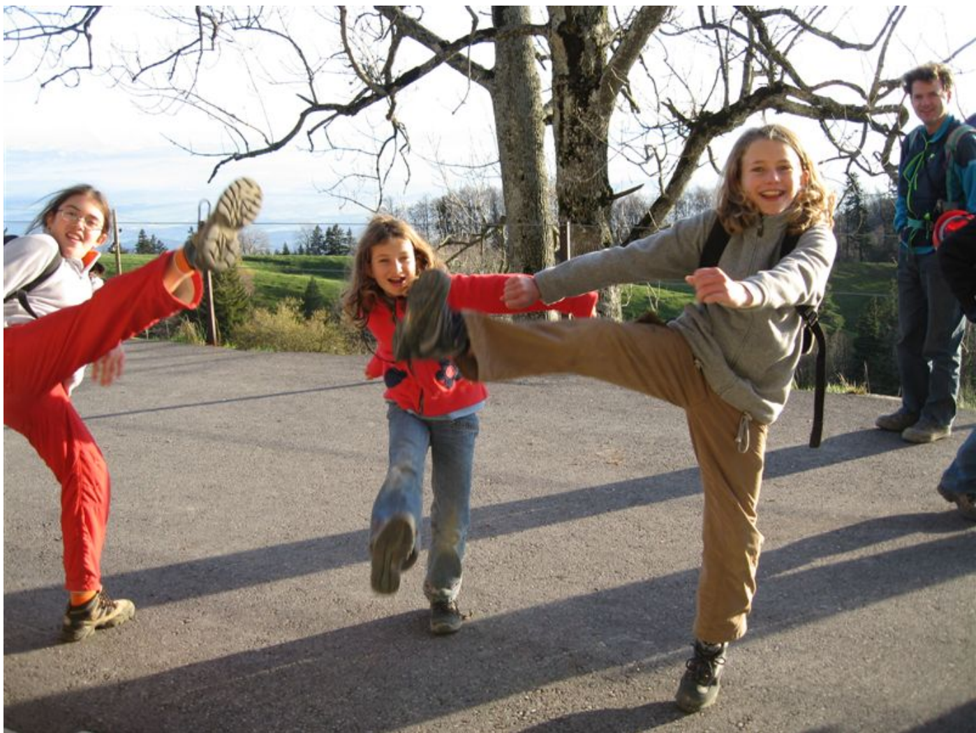
Bild 20 - Die Balleusen vom Weissenstein