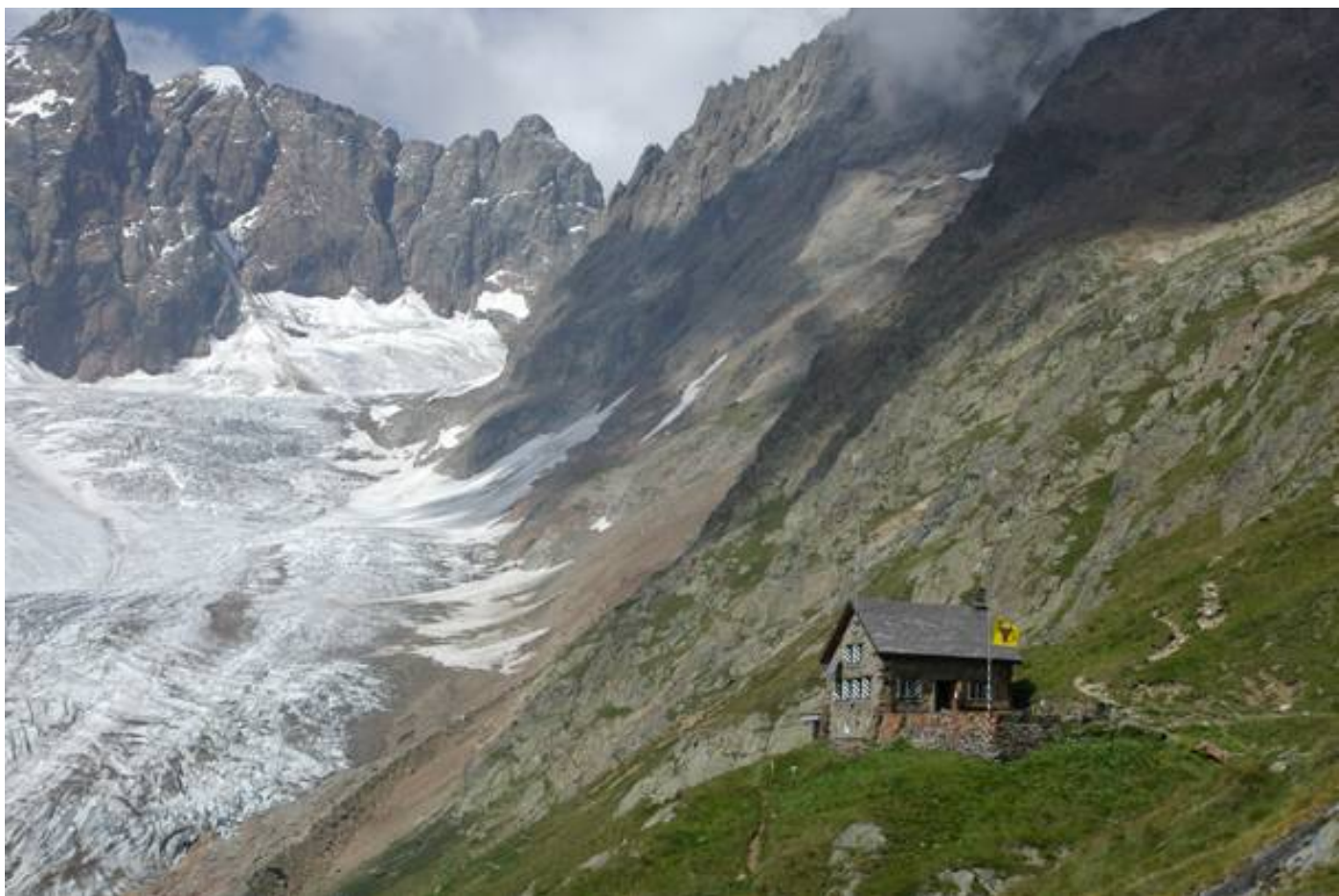
Bild 2 - Hütte von Osten