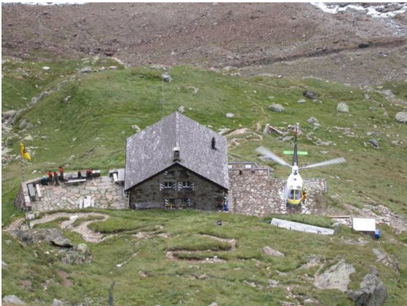
Bild 8 - Nicht jeder hat einen Helilandeplatz auf der Terasse