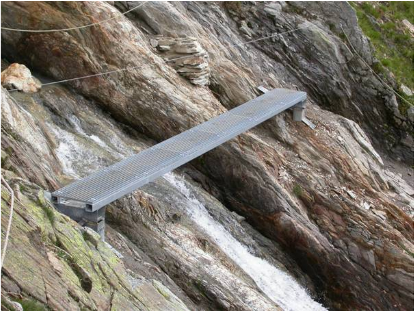
Bild 9 - Im Sommer 2004 wurde eine neue Brücke gebaut, 200m oberhalb der Hütte. Sie soll das Überqueren des Baches neben der Hütte erleichtern, bei starkem Schmelzwasser war es oft sehr schwierig, diese Stelle zu passieren.