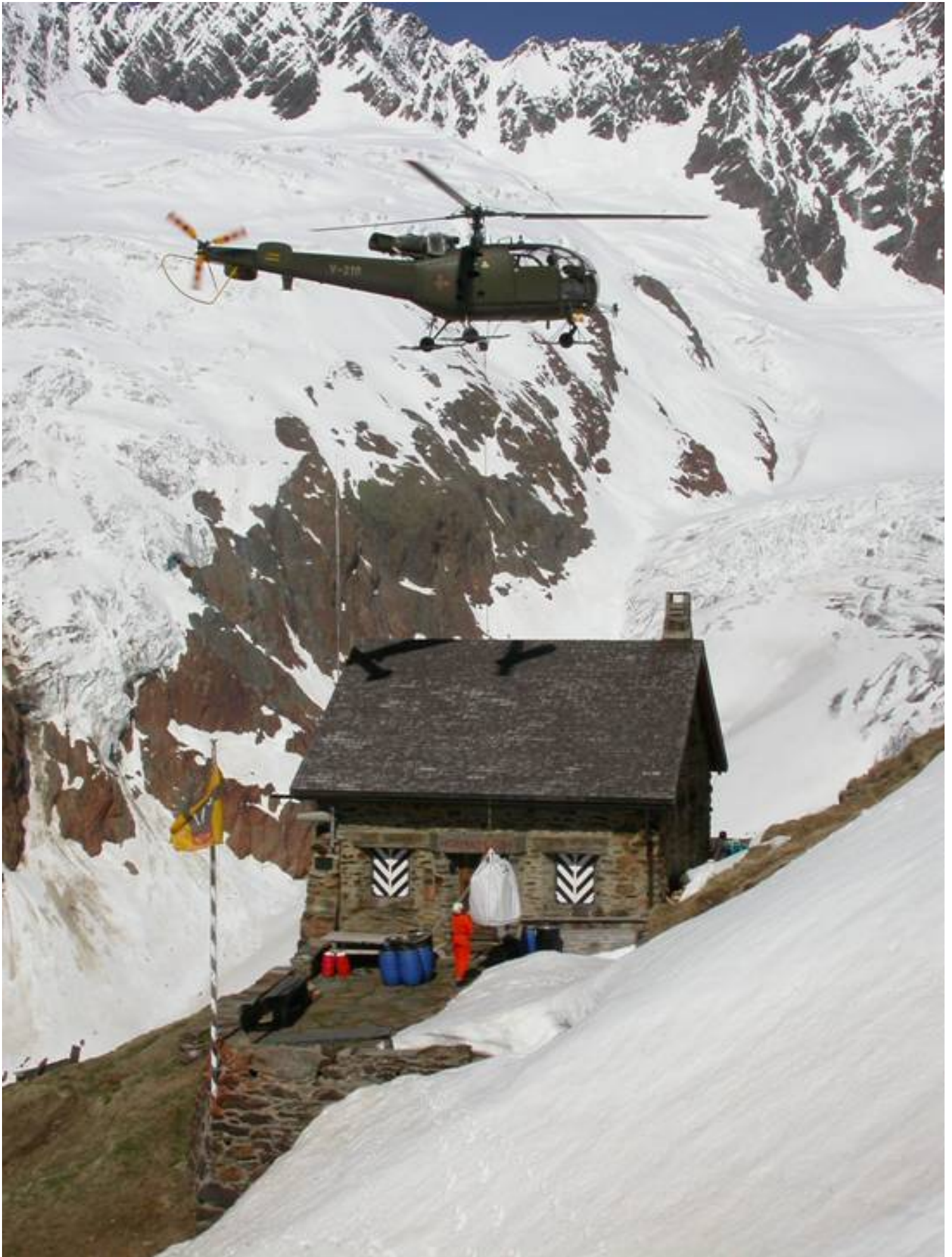
Bild 7 - Versorgungsflug mit der Armee