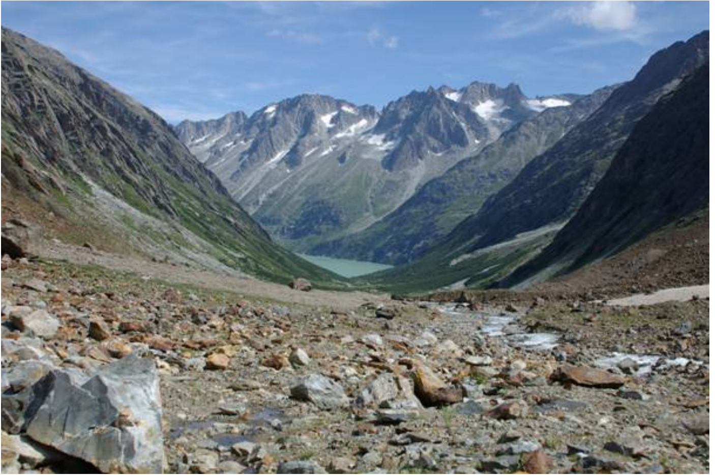
Bild 3 - Chelenalptal Richtung Göscheneralpsee