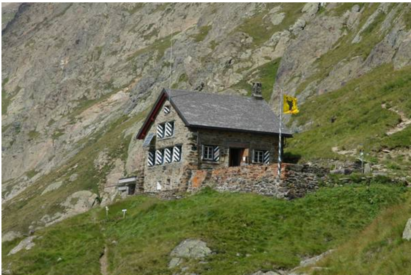
Bild 1 - Die Chelenalphütte