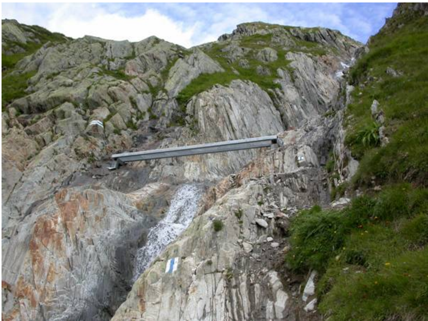
Bild 10 - Die neue Brücke von unten.