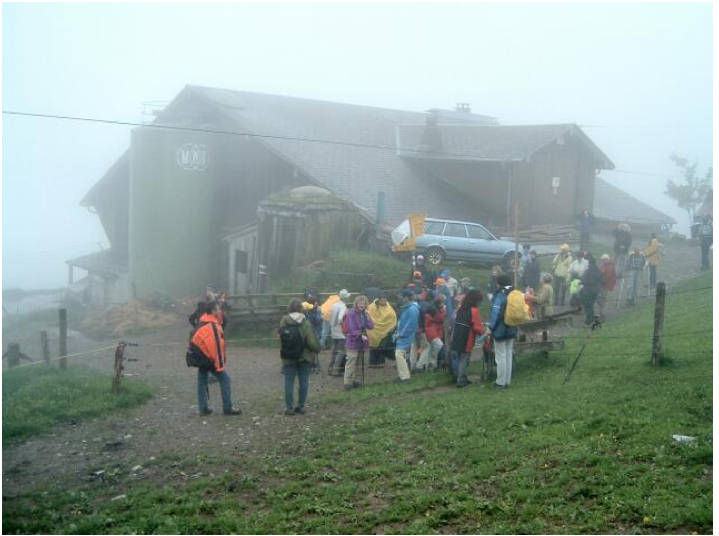
Bild 9 - Aufteilung auf drei Geschwindigkeiten