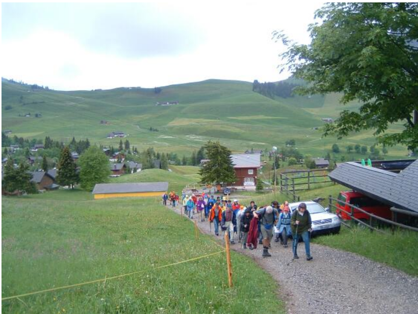
Bild 2 - Grenztour - Gefühle steigen hoch, angesichts dieses Tatzelwurms