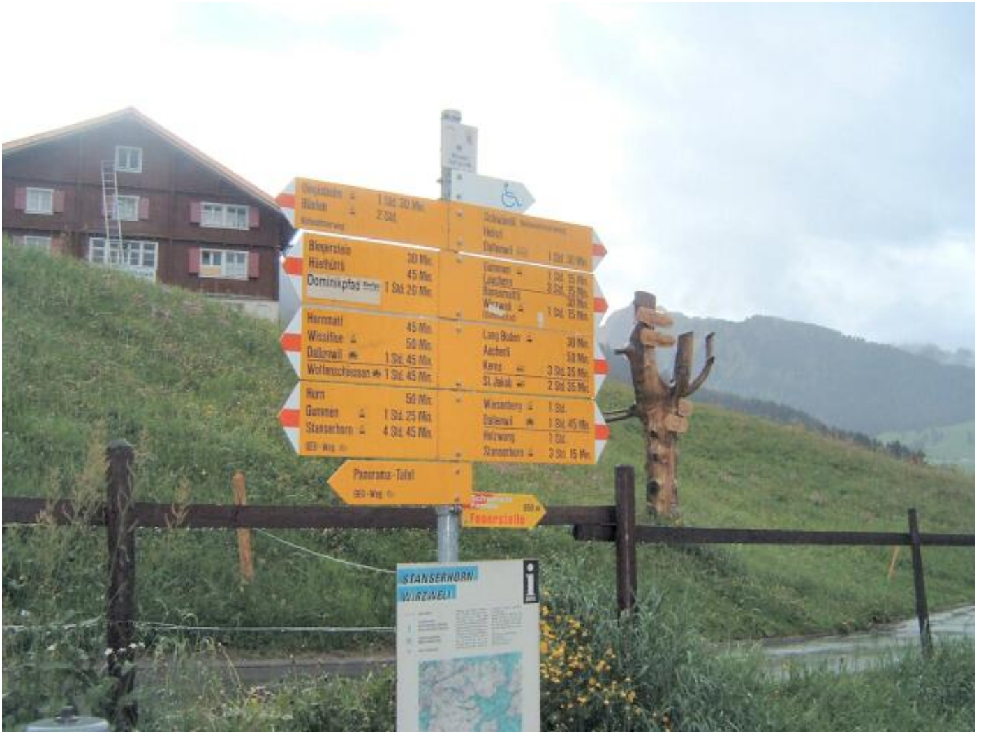
Bild 1 - Viele Wege führen vom Wirzweli weg