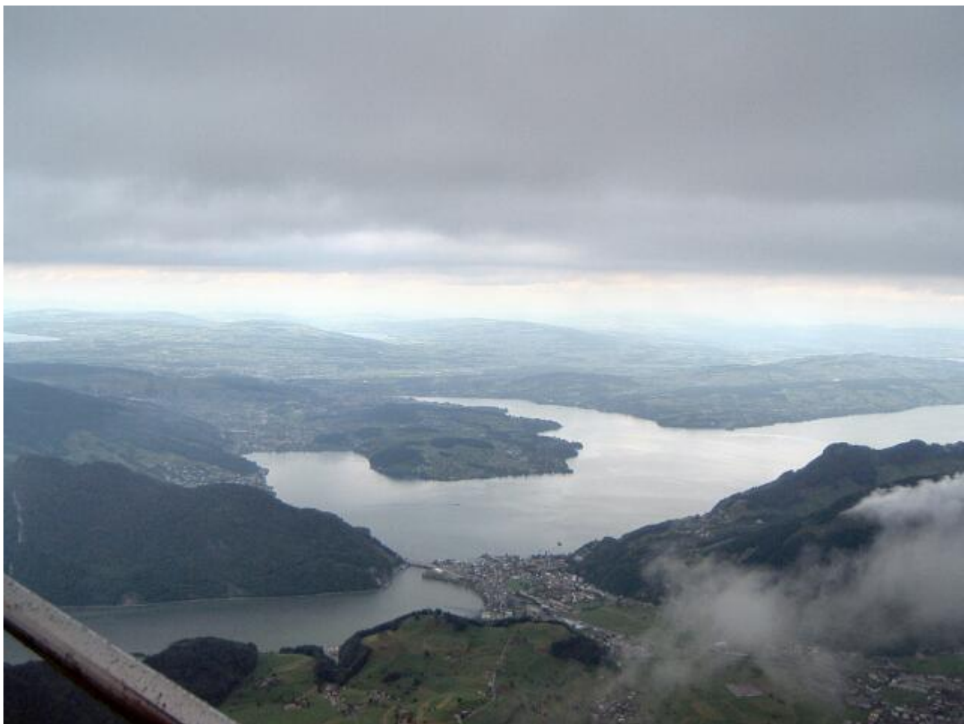
Bild 11 - Vorhang auf - Blick ins Luzerner Becken