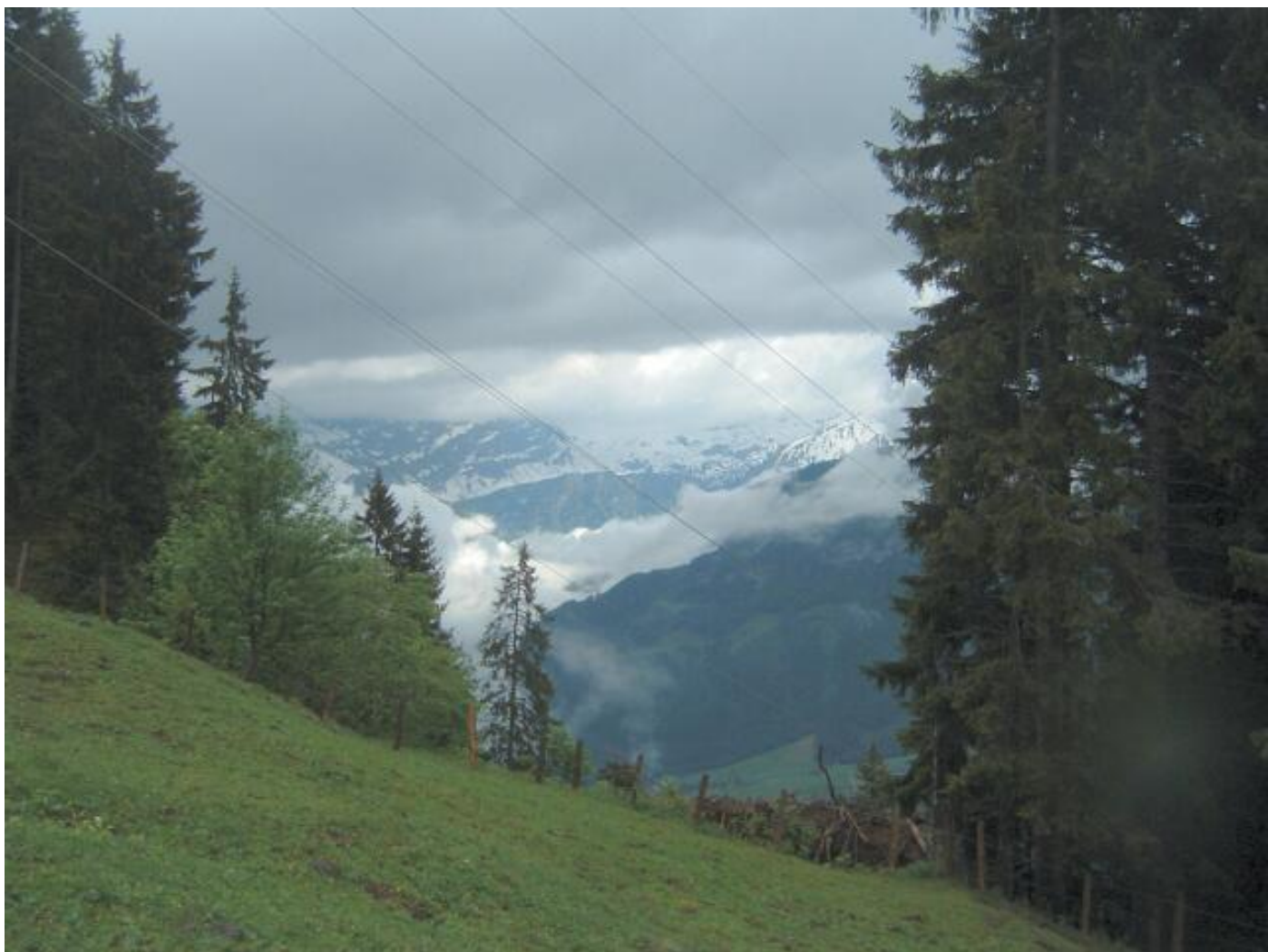
Bild 4 - Blick durch die Wolkendecke