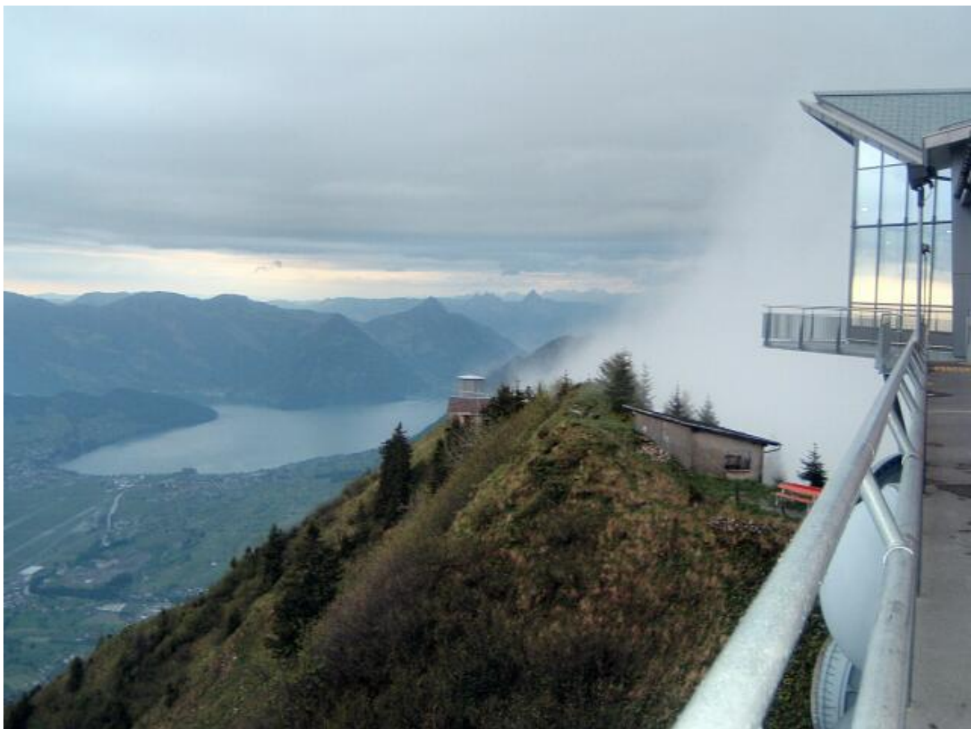
Bild 12 - Abschied vom Stanserhorn - Blick hinüber zu den Mythen