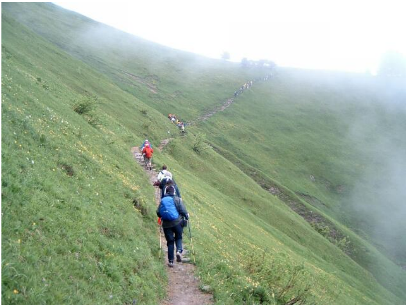
Bild 10 - Es trennen sich die Gruppen beim Anstieg zum Stanserhorn