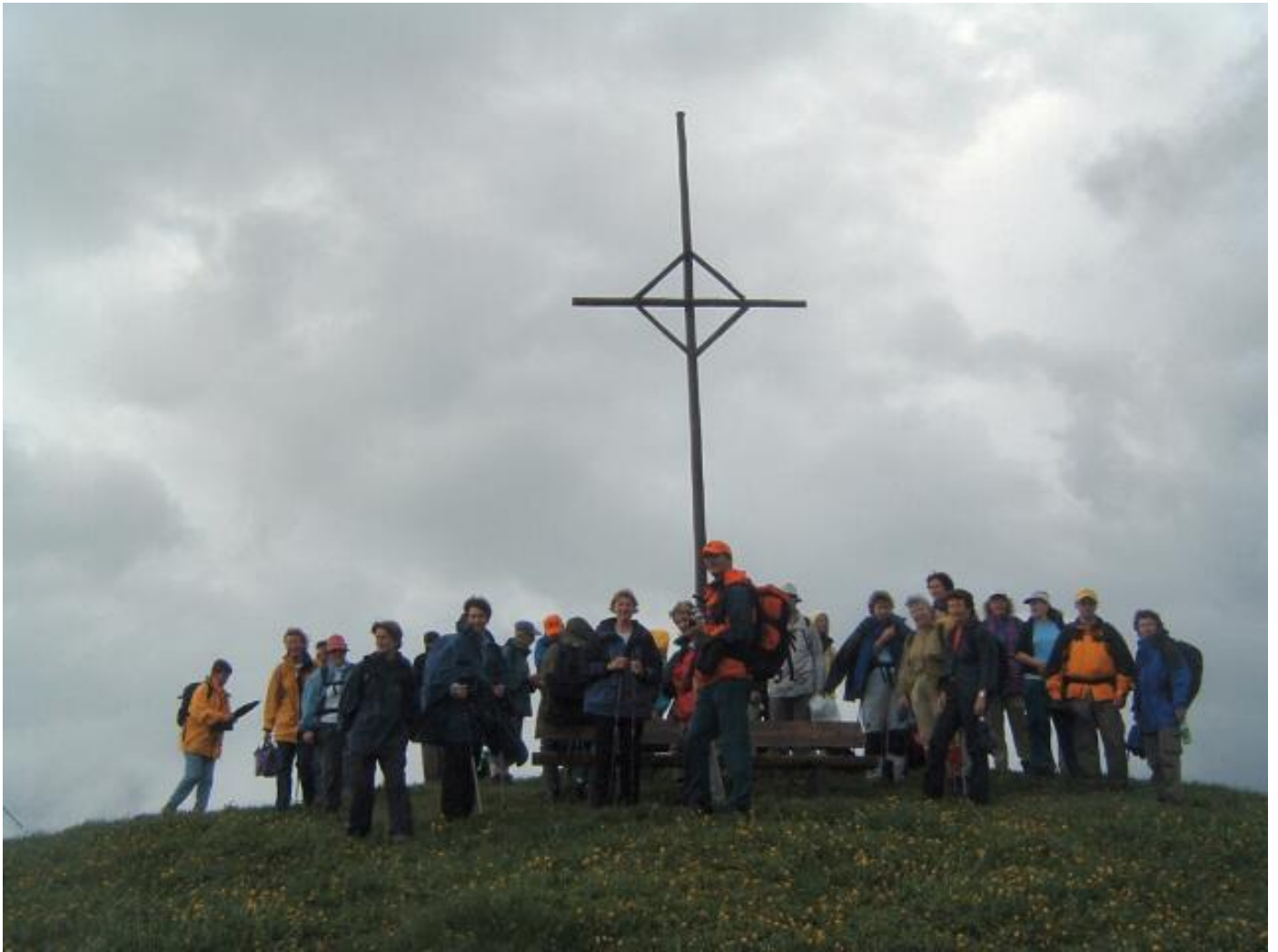
Bild 6 - Erste Gipfelphoto vom Wirzweligrat