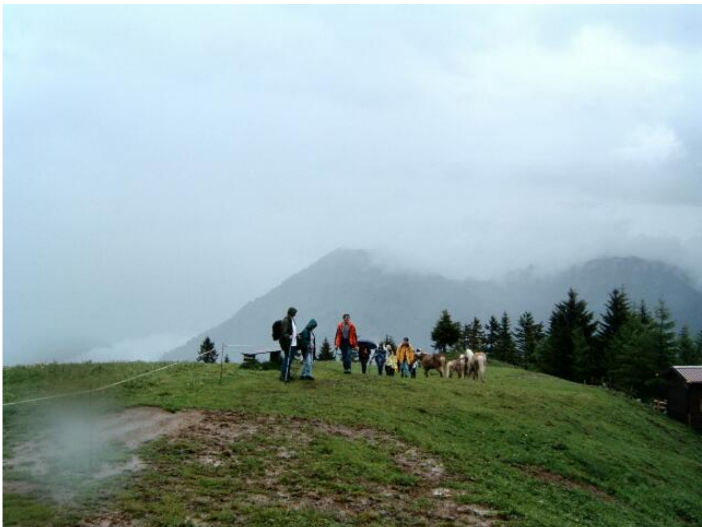
Bild 3 - Eindrückliche Stimmung auf dem Wirzweligrat