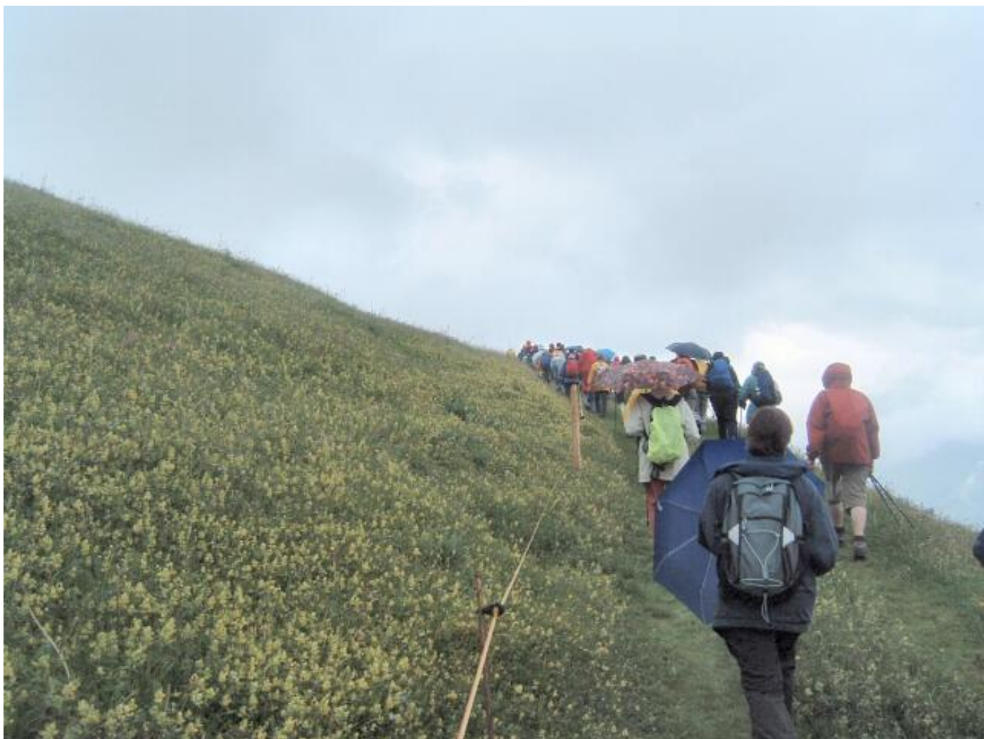
Bild 8 - Ob die Sonne doch noch kommt und die Blumenwiesen trocknet?