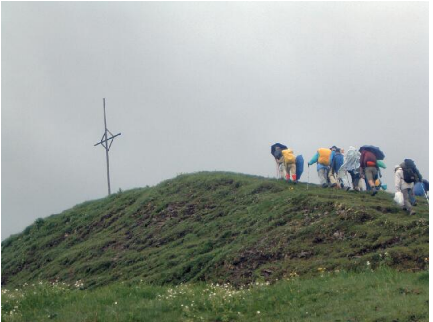
Bild 5 - Hinauf - hinauf - noch reicht der Schnauf