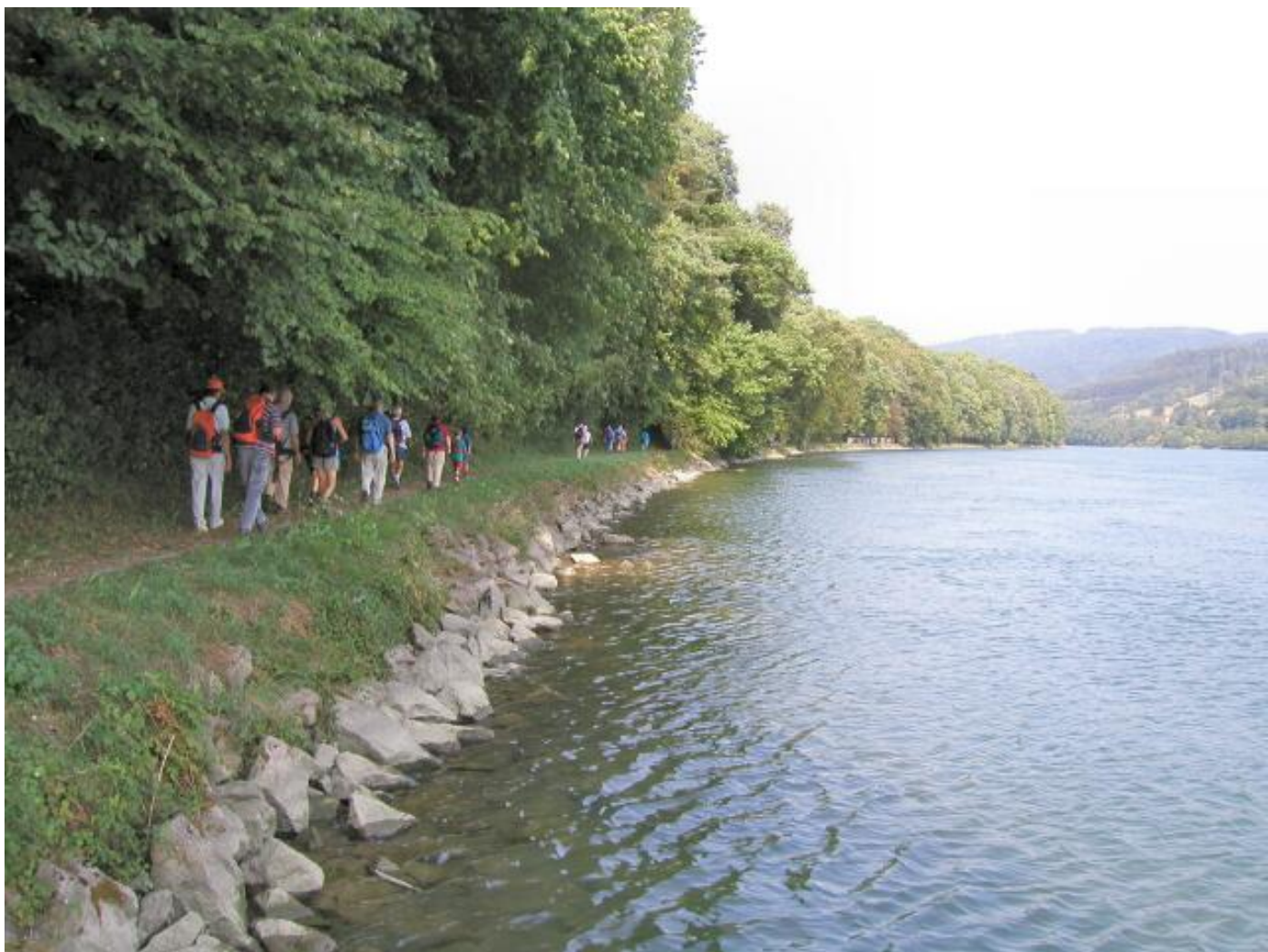
Trotz 32 Grad: Angenehmes Wandern im Schatten der Rheinuferbestockung.