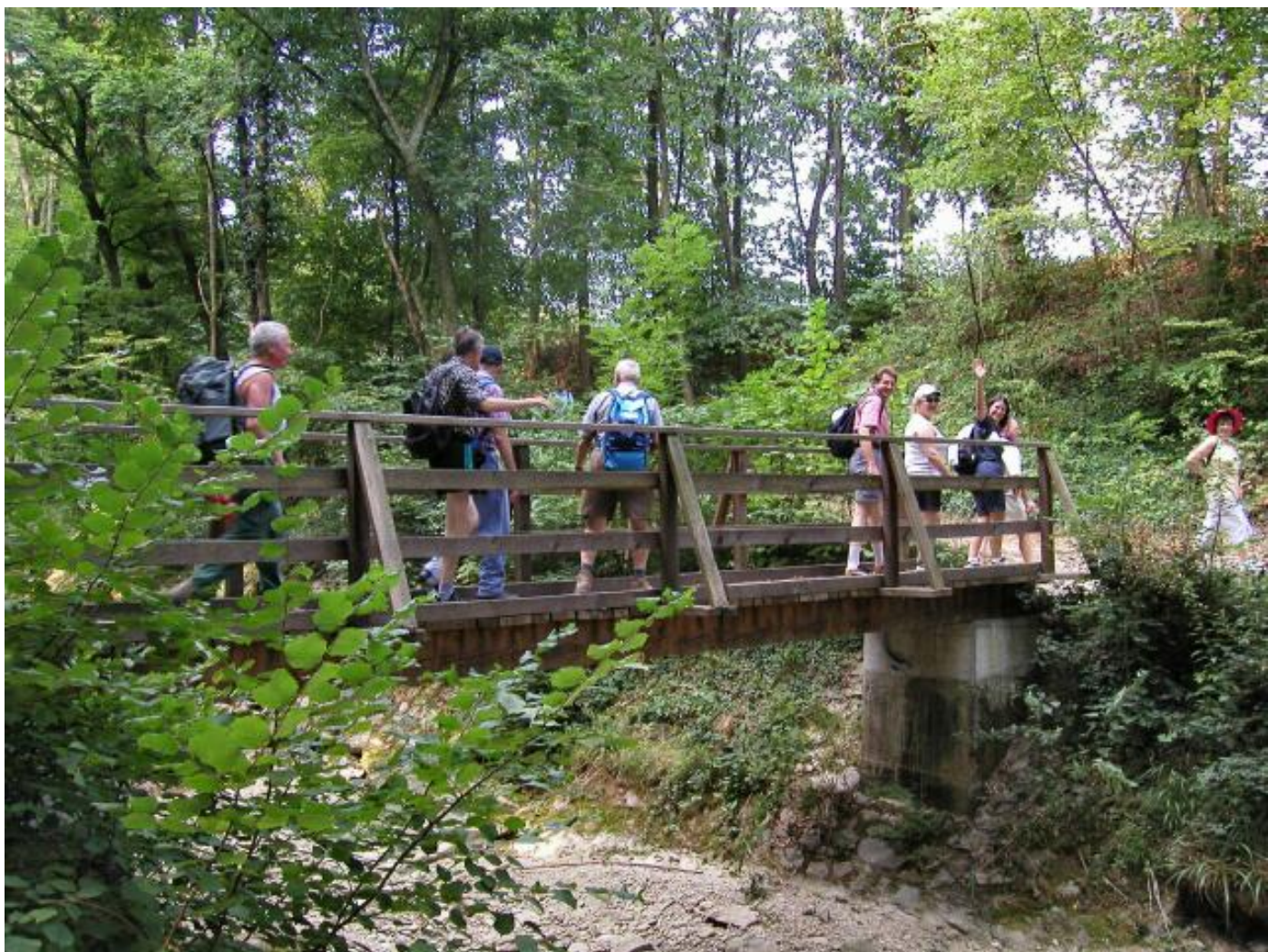
Kurz nach Laufenburg: Brücke über den ausgetrockneten Kaisterbach.