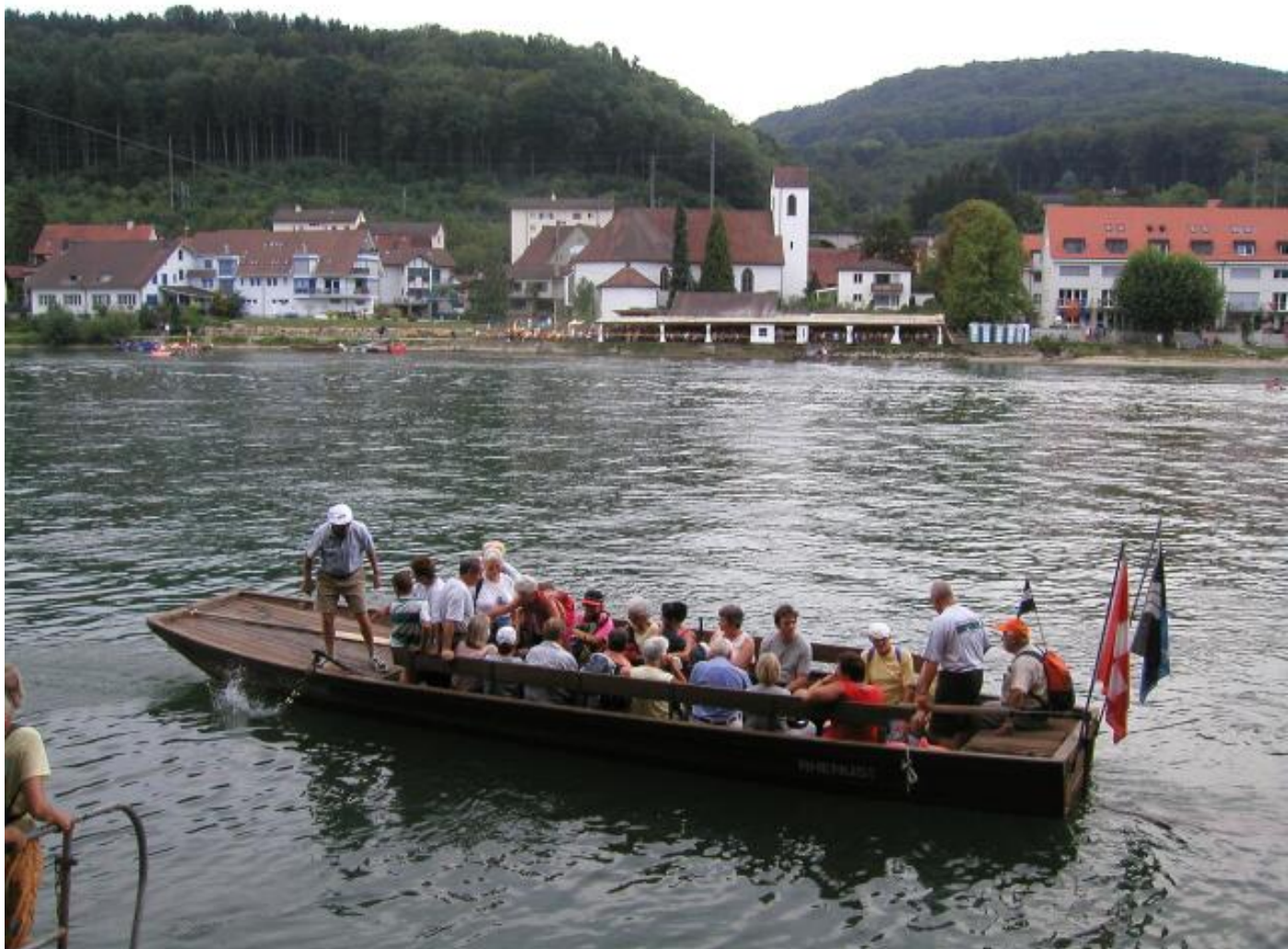
Auf der "Grenzfähre" nach Mumpf.