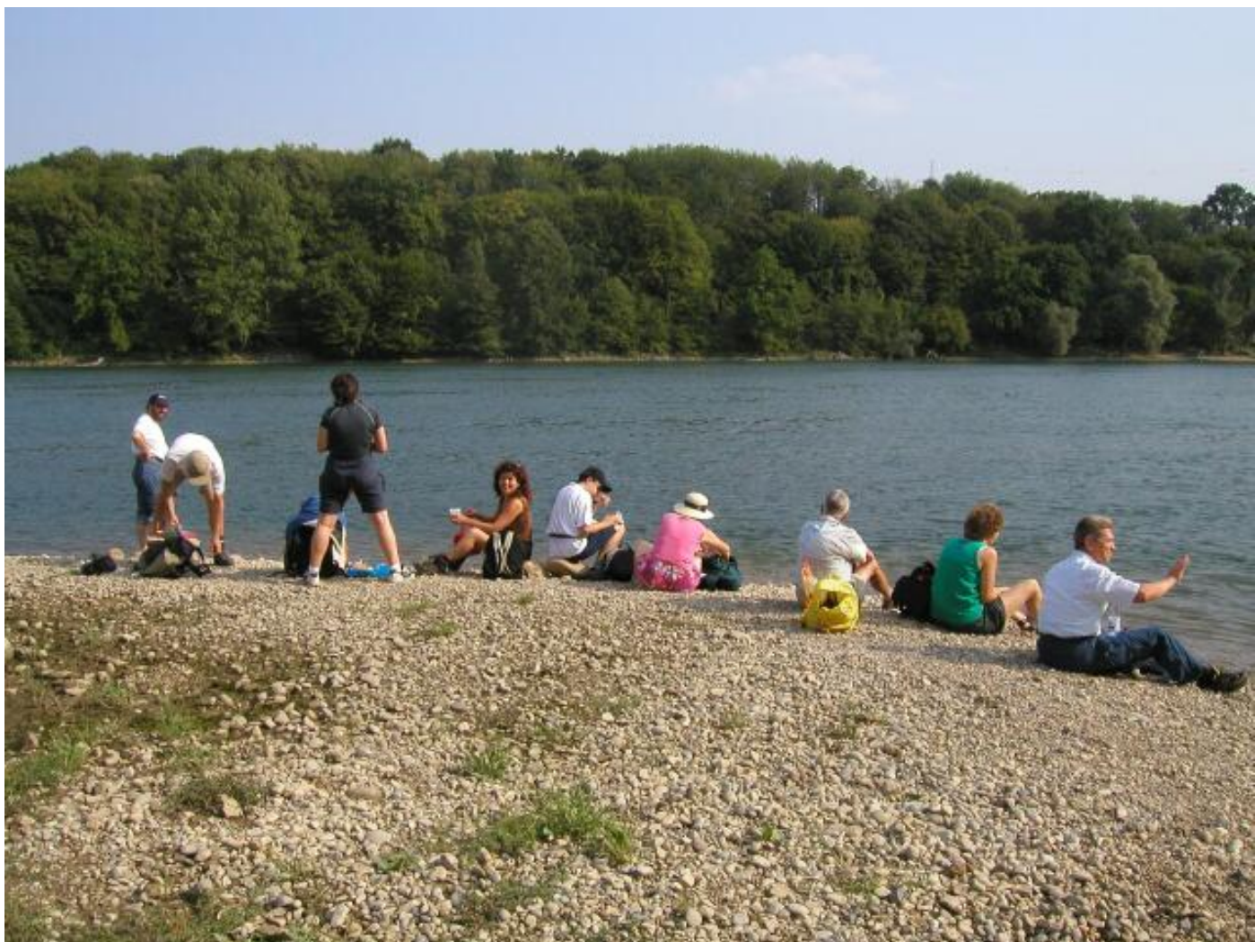
Ferienstimmung im Mündungsdelta des Kaisterbachs.