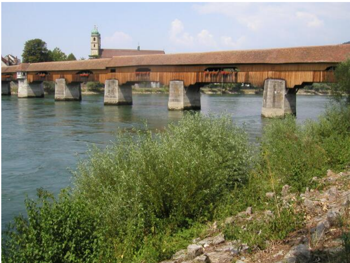
Die schöne alte Rheinbrücke von Stein-Säckingen.