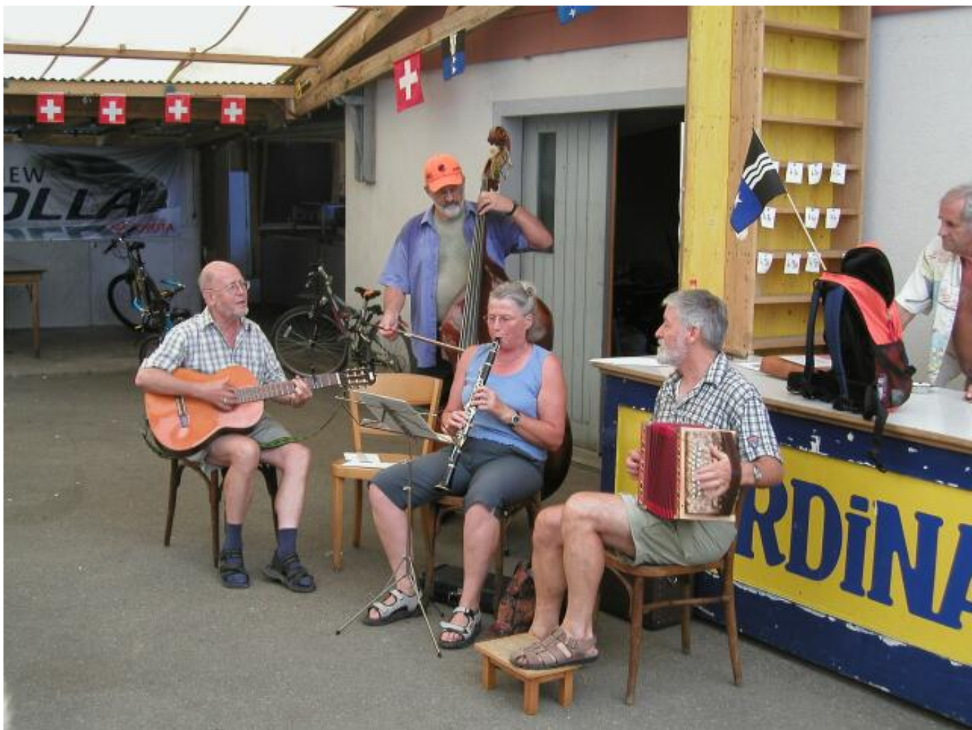
Beim Mittagessen werden wir von der Hauskapelle des SAC Brugg unterhalten.