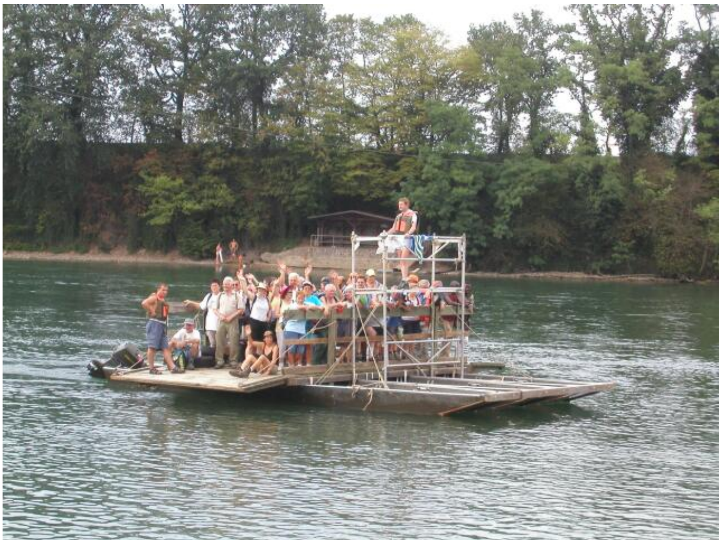
Dank dem "Pontonierfrachter" werden alle 135 TeilnehmerInnen innert 15 Minuten hinübergesetzt.