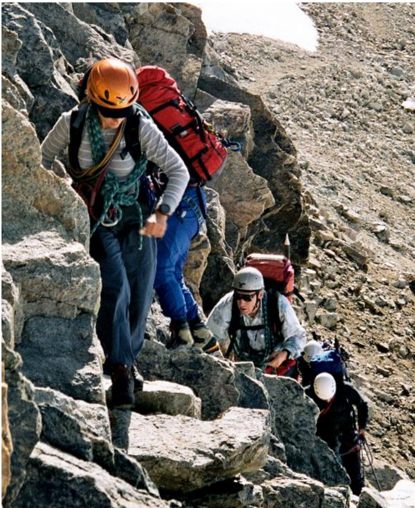
Abstieg über den Spinasgrat.