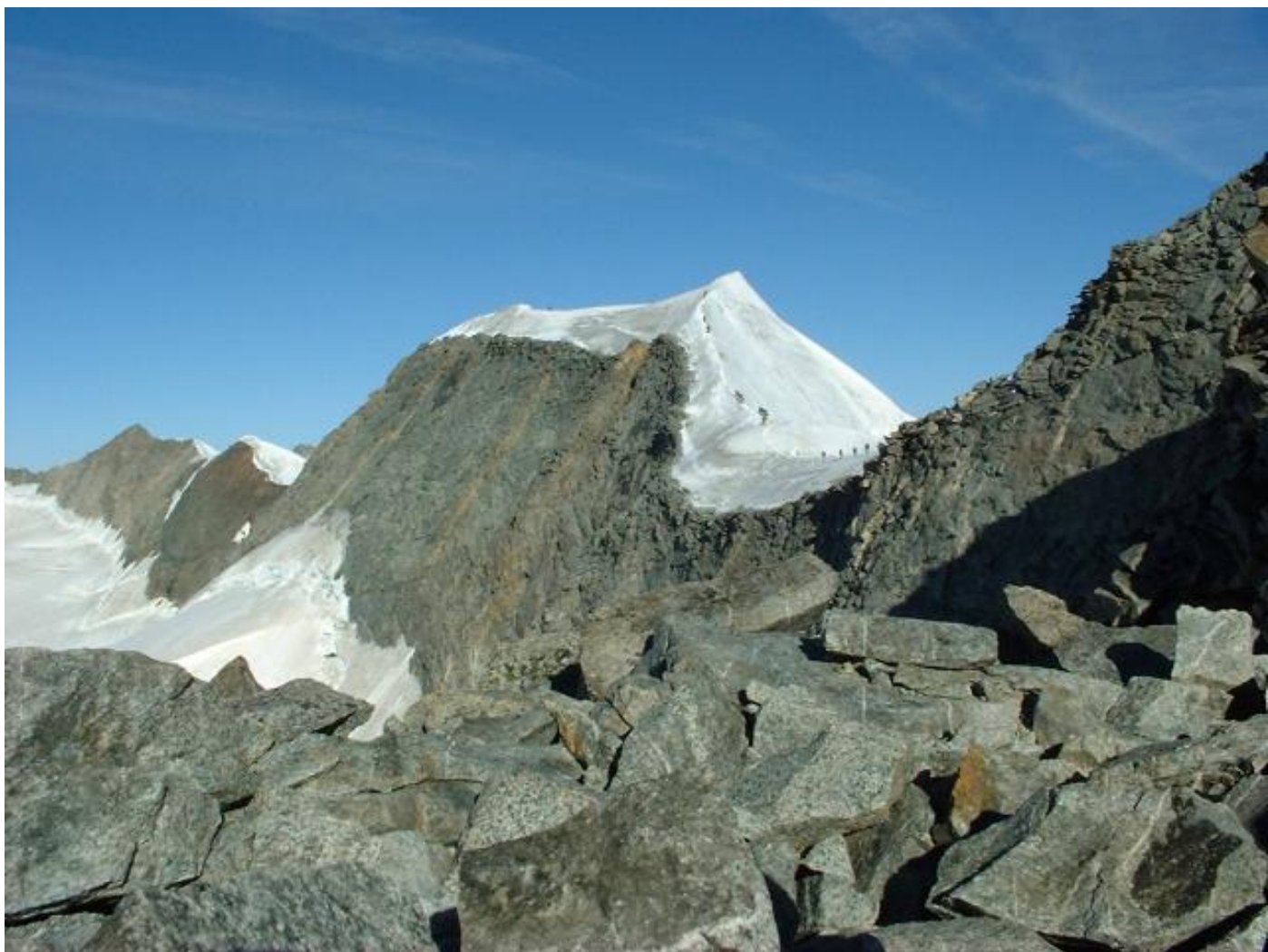
In Einerkolonne zum Gipfel.