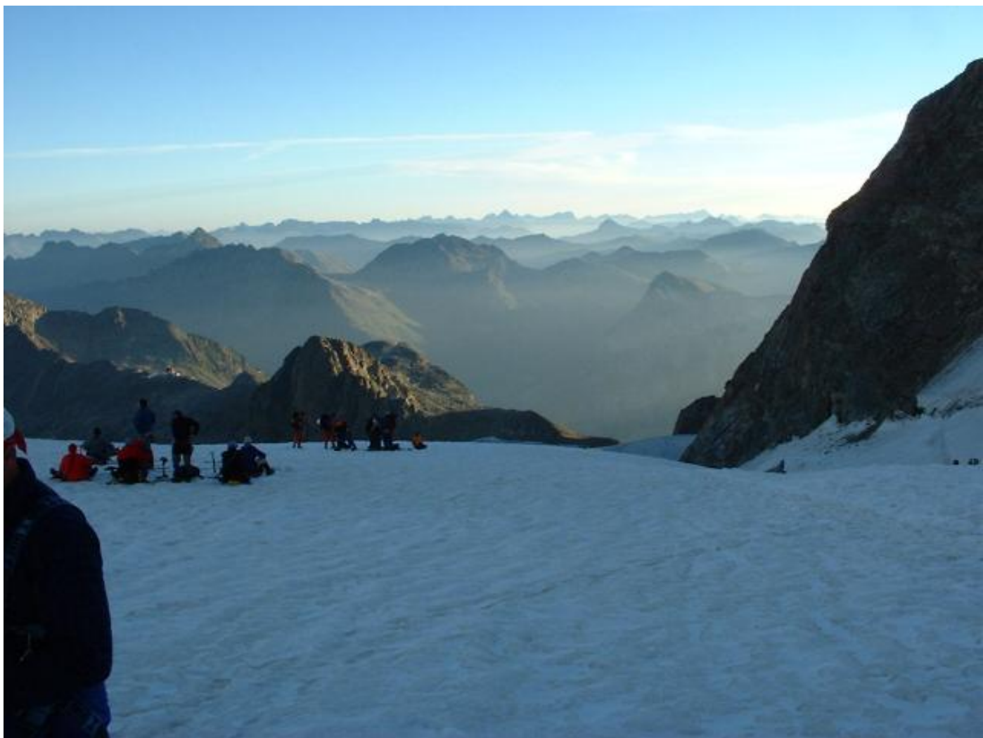
Ein wunderschöner Morgen.