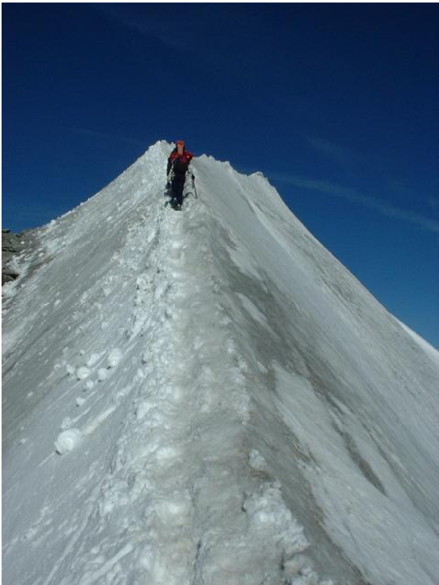
Konzentration ist angesagt.