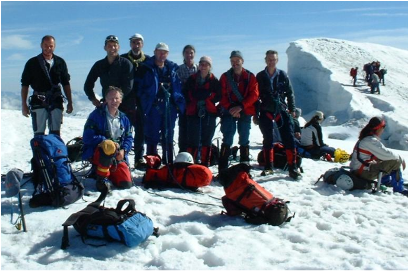
Here we are!