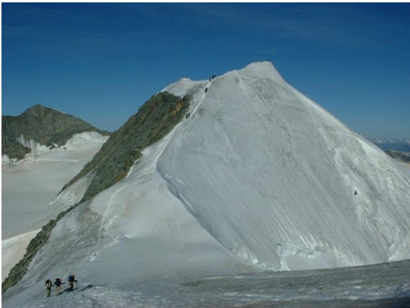
Eindruckliche Ansicht der Nordostflanke.