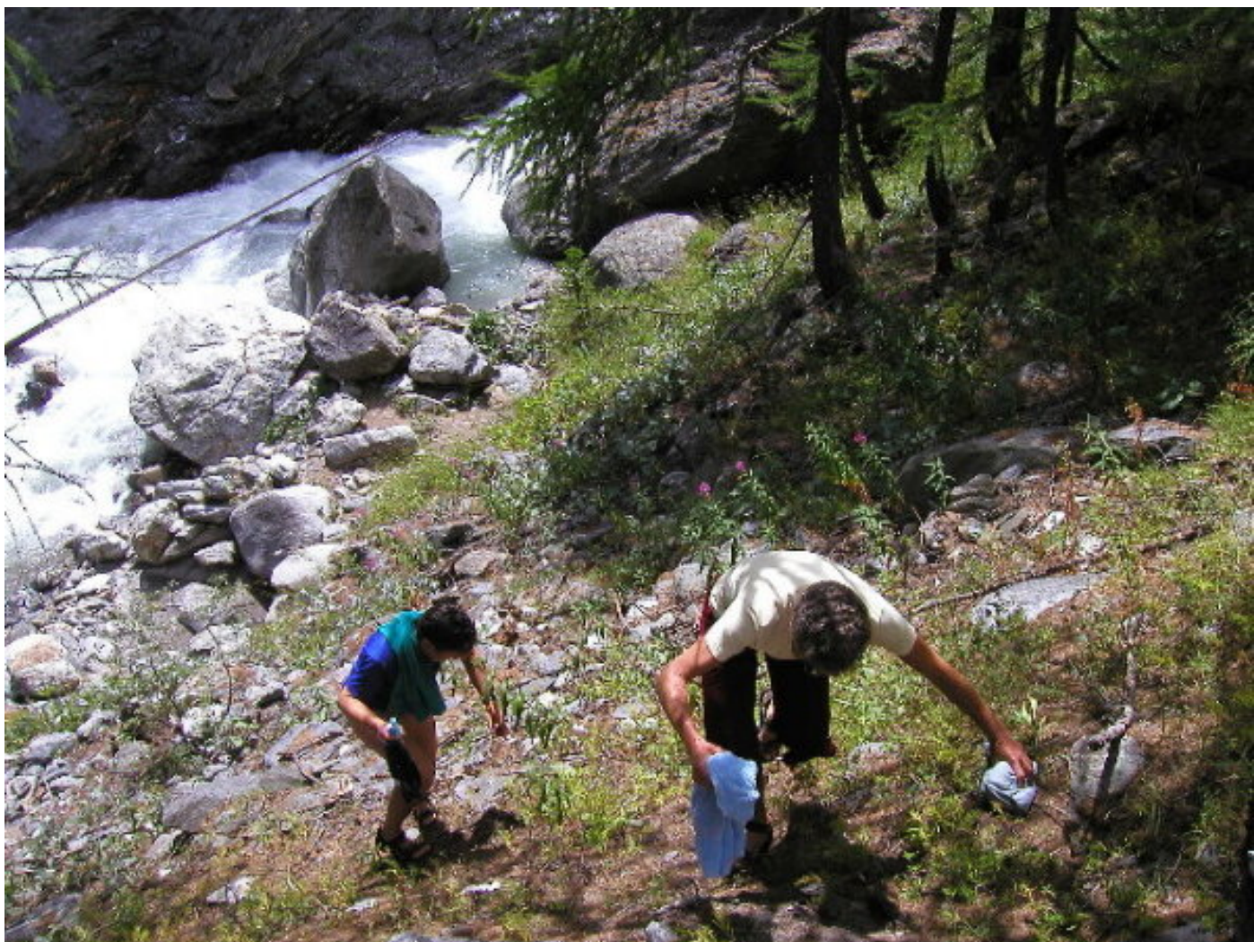
Ausstieg aus dem Bad, bevor die Heimfahrt beginnt. (Vo).