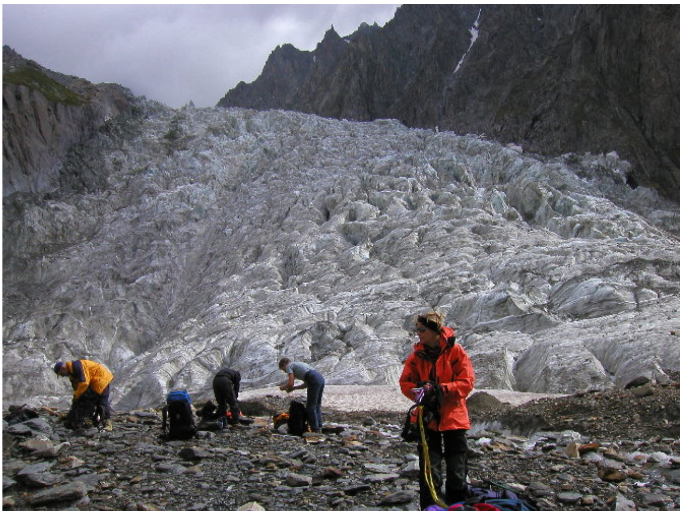
Samstag, 26. Juli: Heimkehr, Steigeisen weg (Vo).