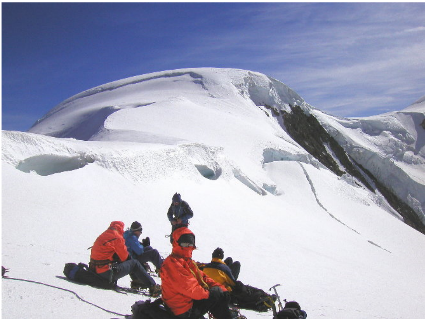
Rast unter dem Dome du Goûter (Vo).