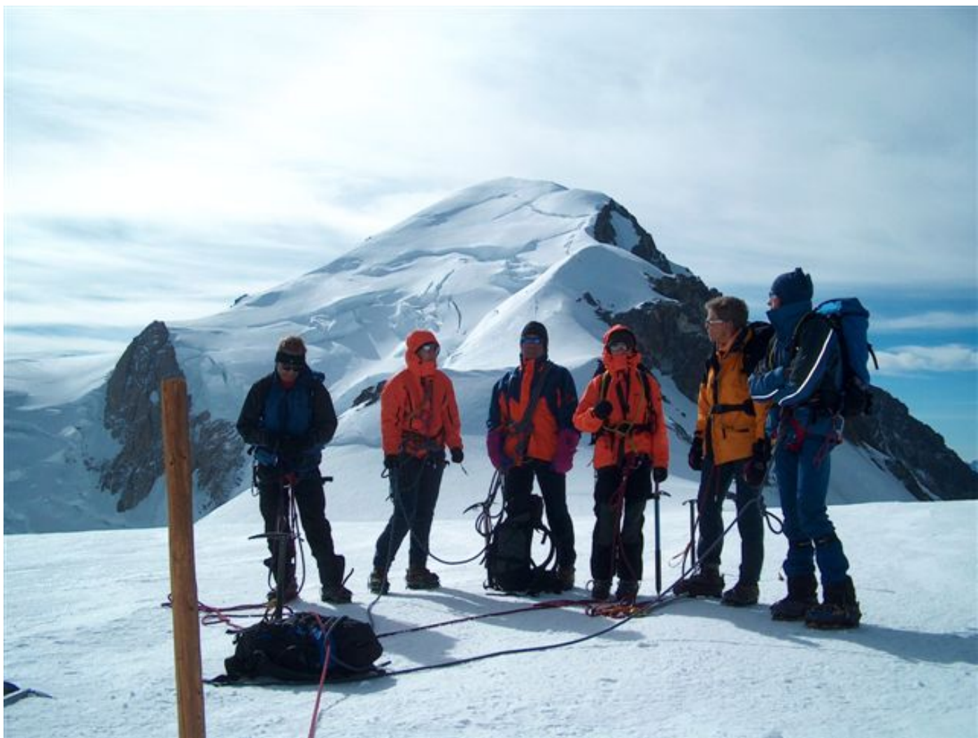
Gruppe Auf dem Dome du G. , 2 Stunden vor M-B-Gipfel (Lü).