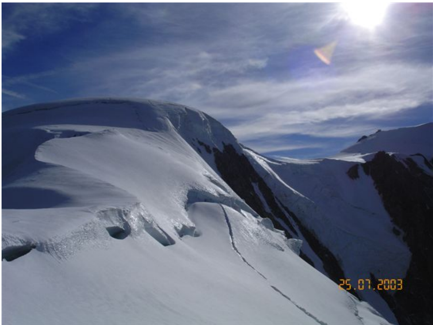
Dome du Gouter (Ei).