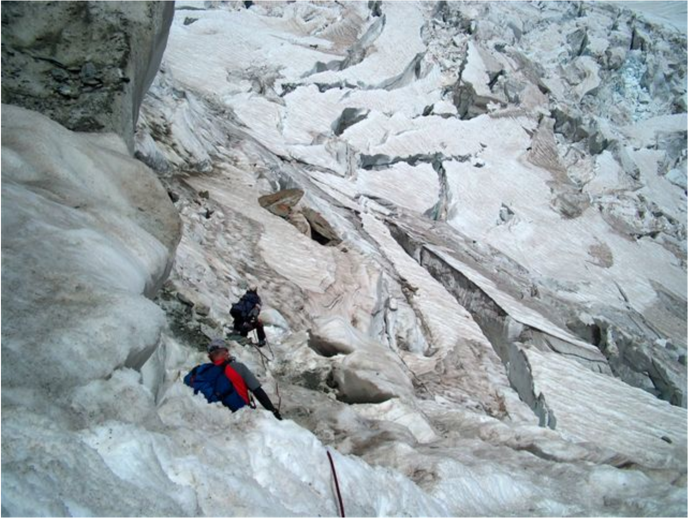
Schreckliches Labyrinth beim Abstieg zur Gonella (Lü).