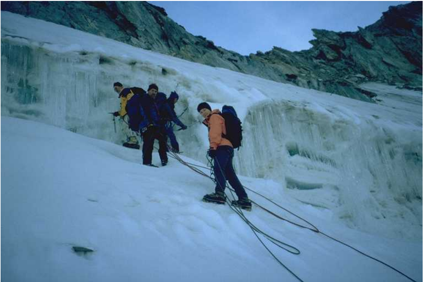
Eisiges Hindernis im Morgengrauen (Hu).