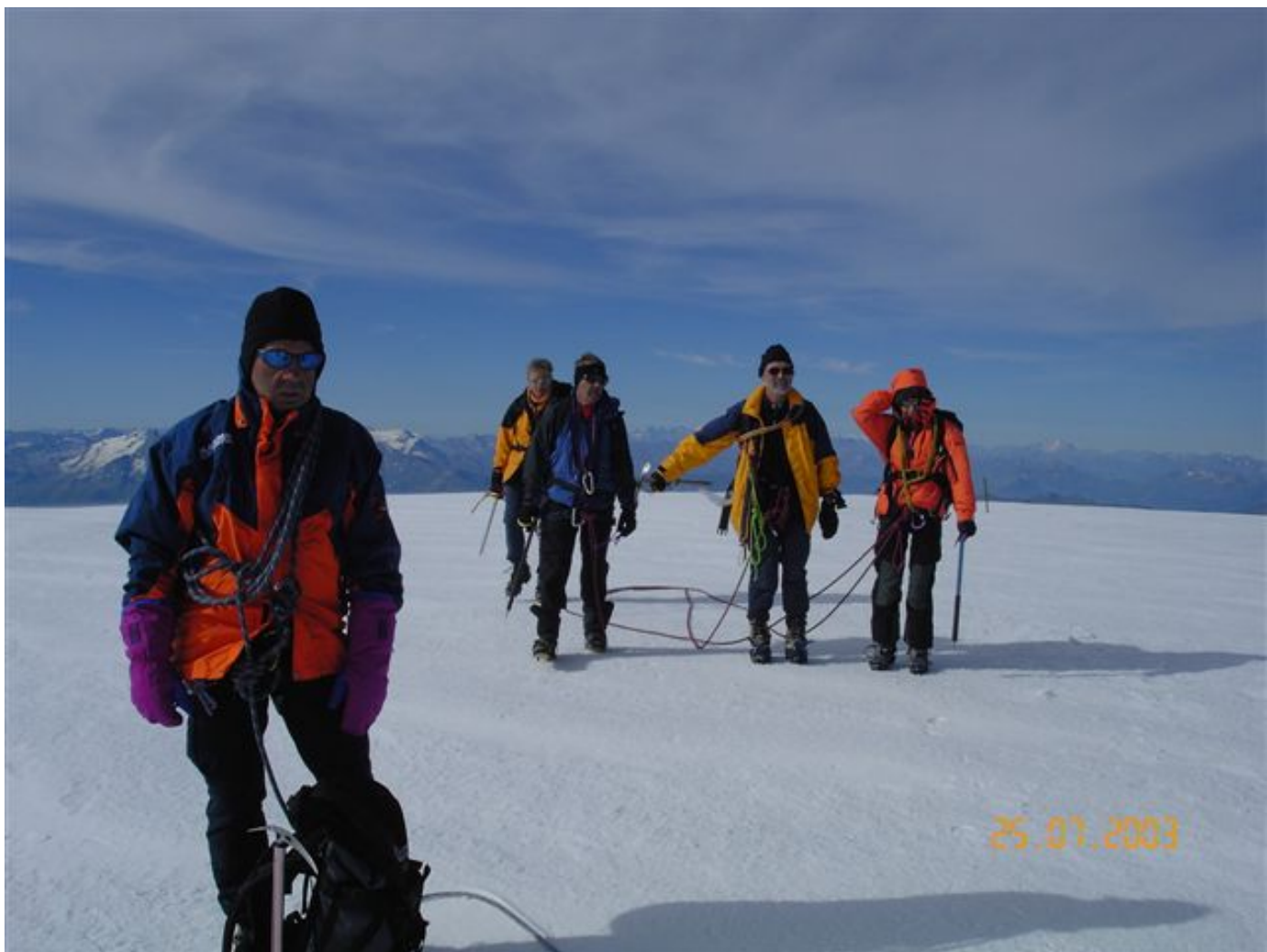
Auf dem Dome du Gouter (Ei).