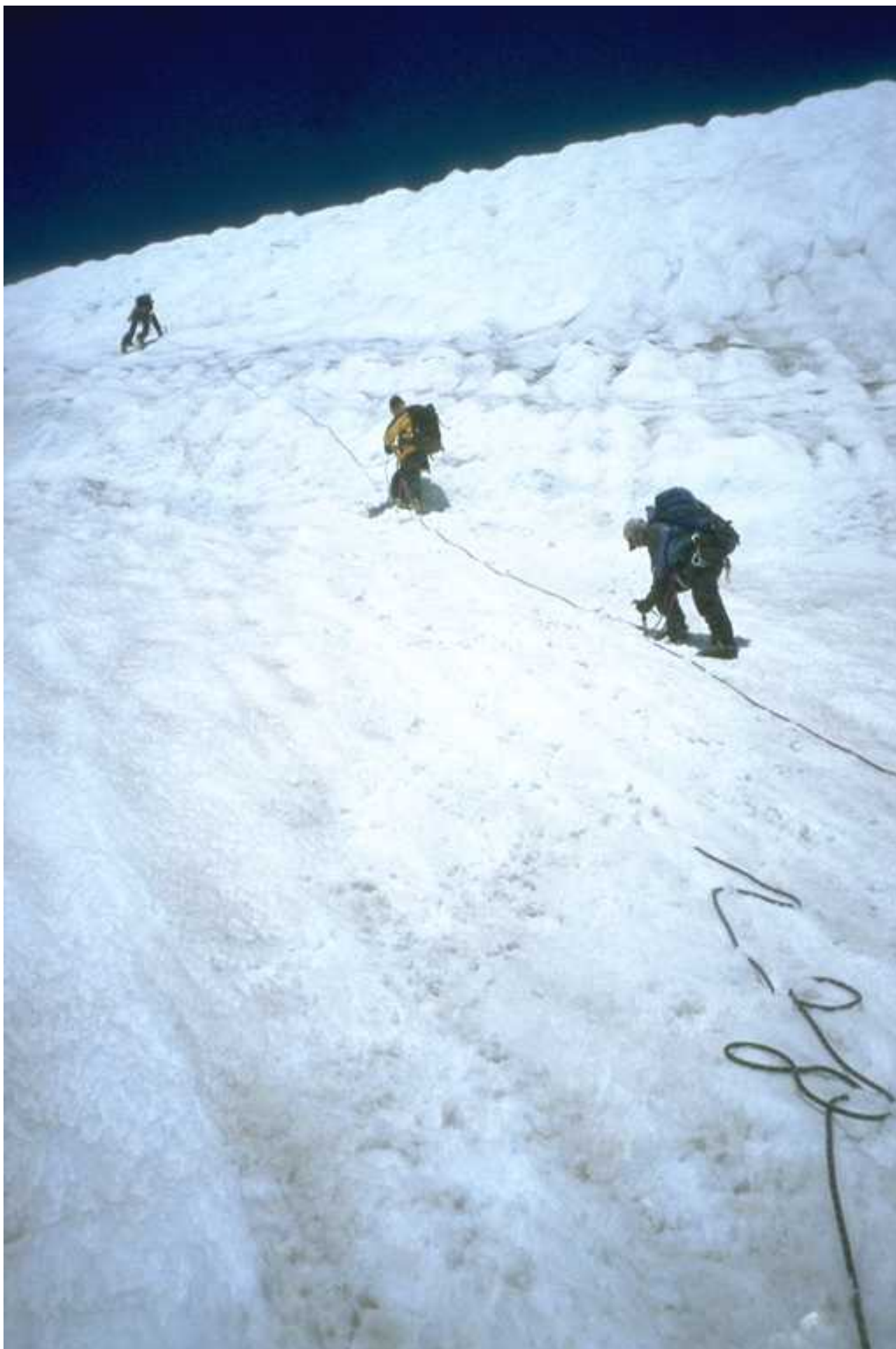
Freitag, 25. Juli: über Steileis Richtung Mont Blanc.