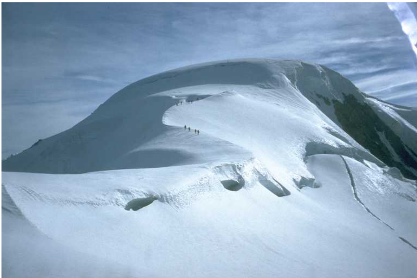
Unsere Gruppe steigt zum D. du. Gouter (Hu).