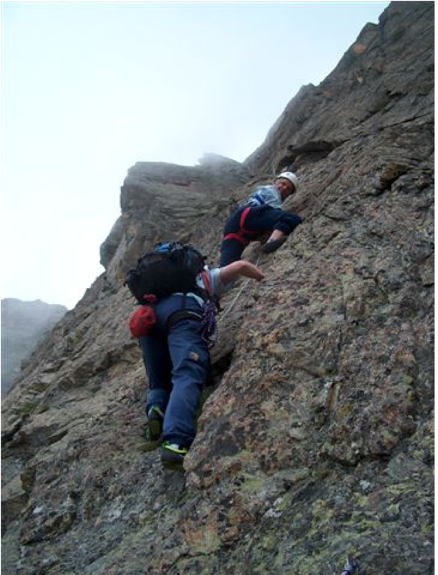
Im Nebel am Westgratturm.