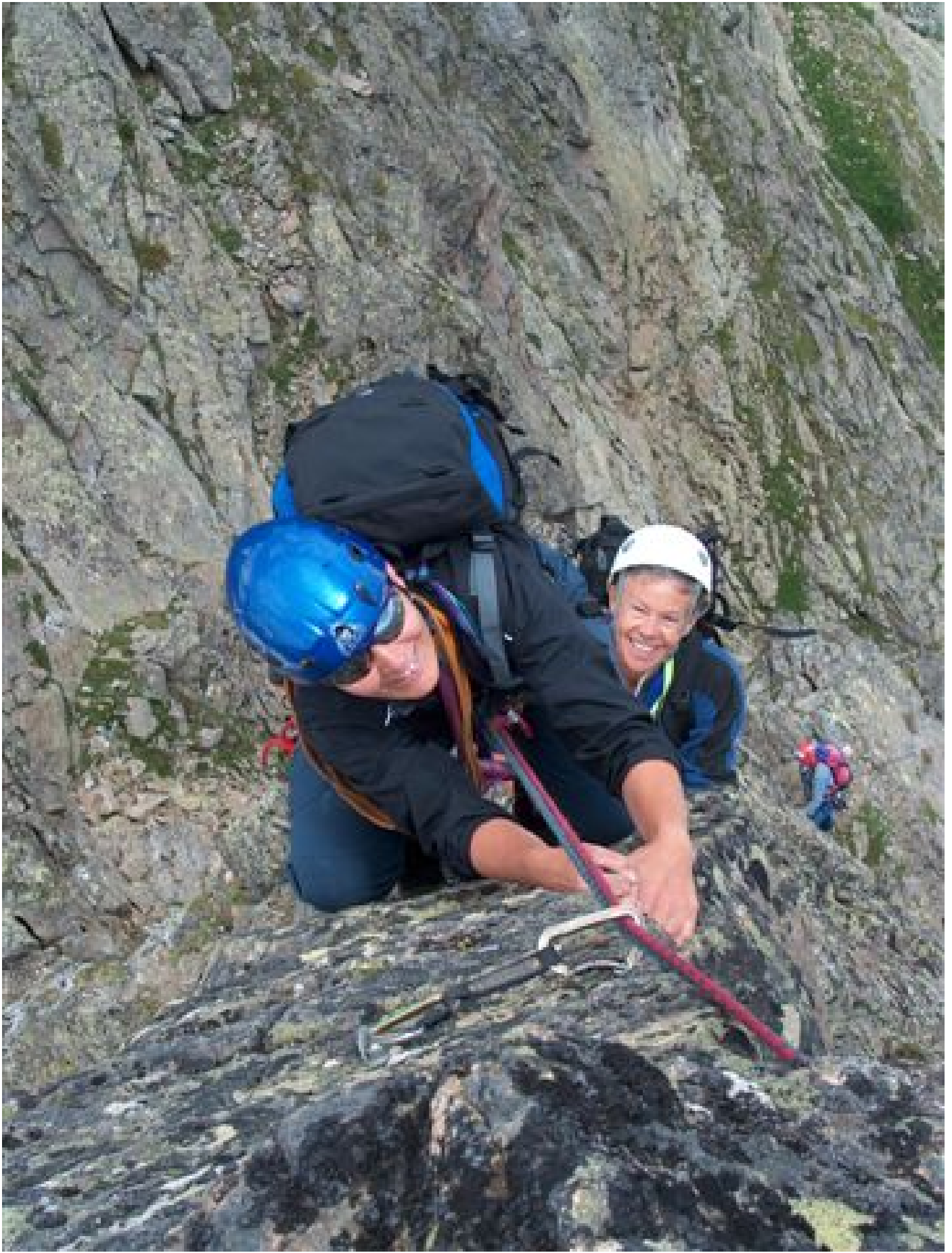
Am Gipfelgrat des Sewenstocks.