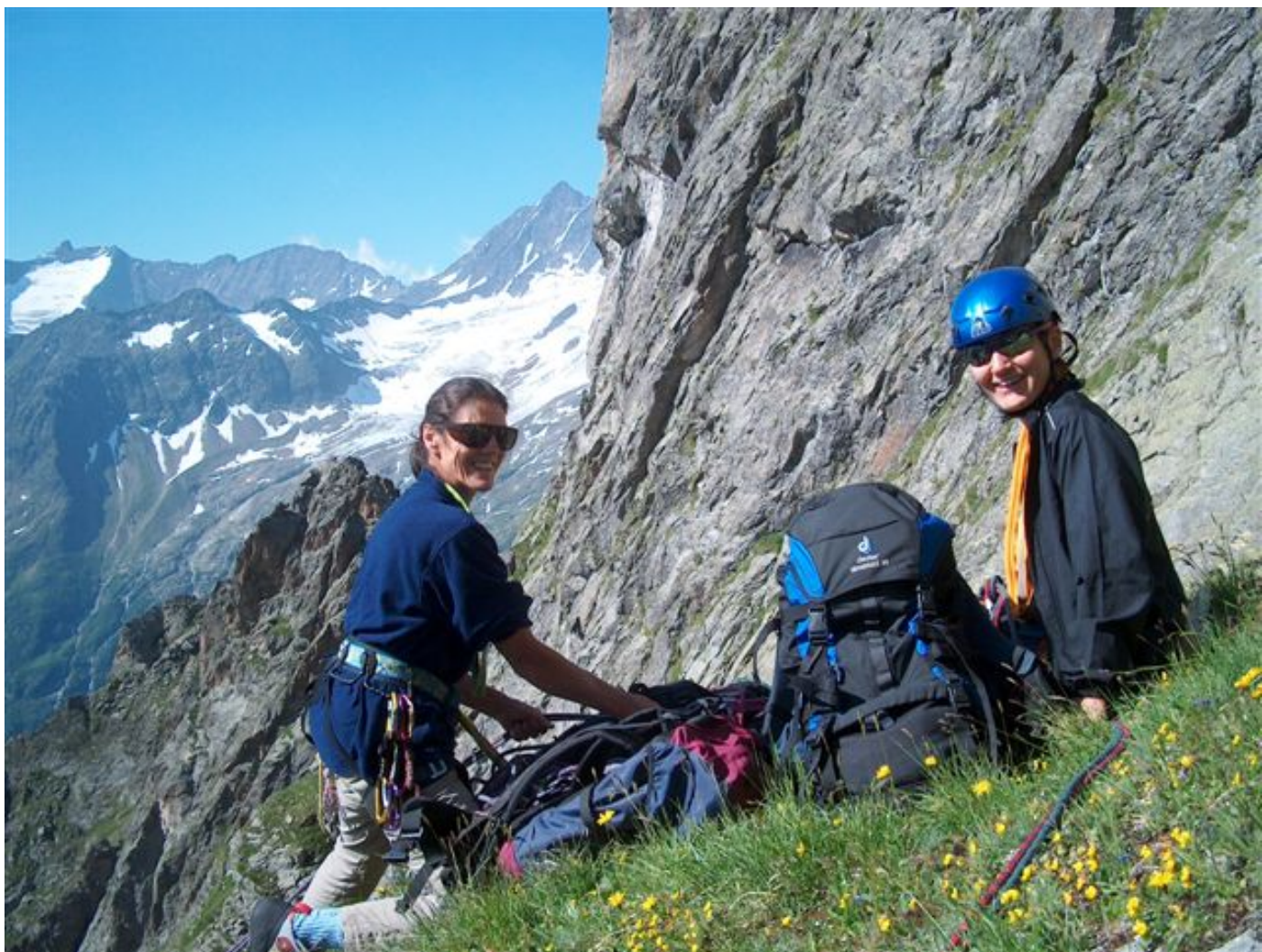
Am Sewenstock. Gleich nachher war es nicht mehr so friedlich...