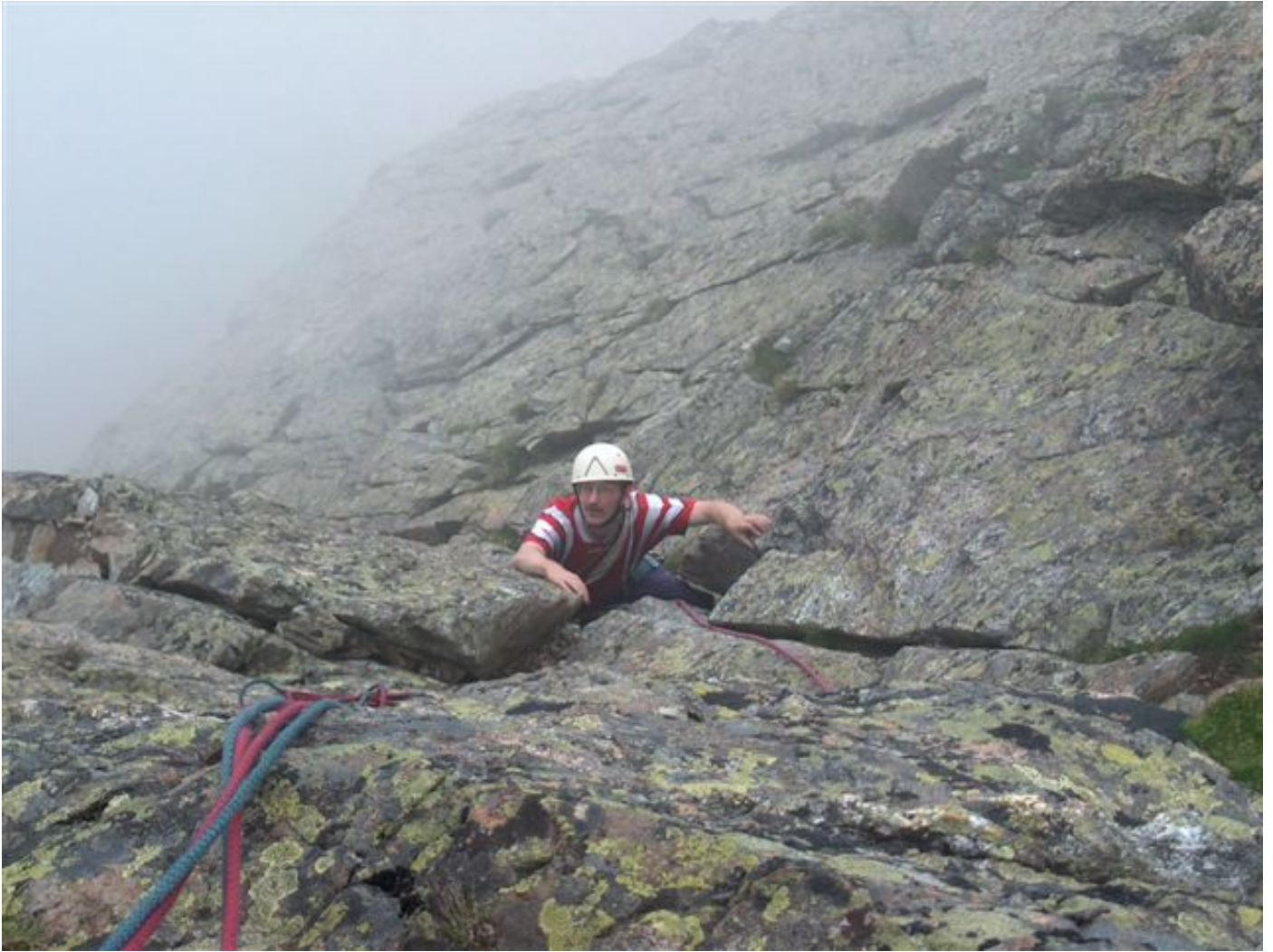
Nebel am Westgratturm.