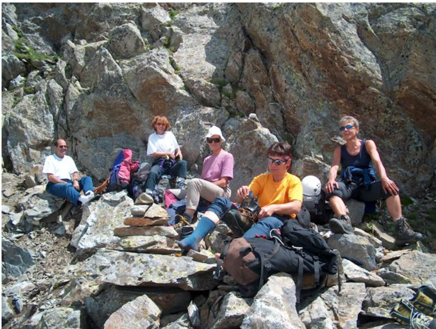
Unter dem Gipfel des Sewenstocks.