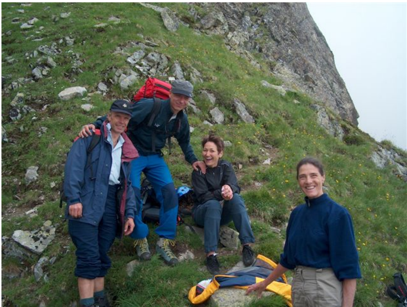
Sewenhorn Westgratturm ist bezwungen.