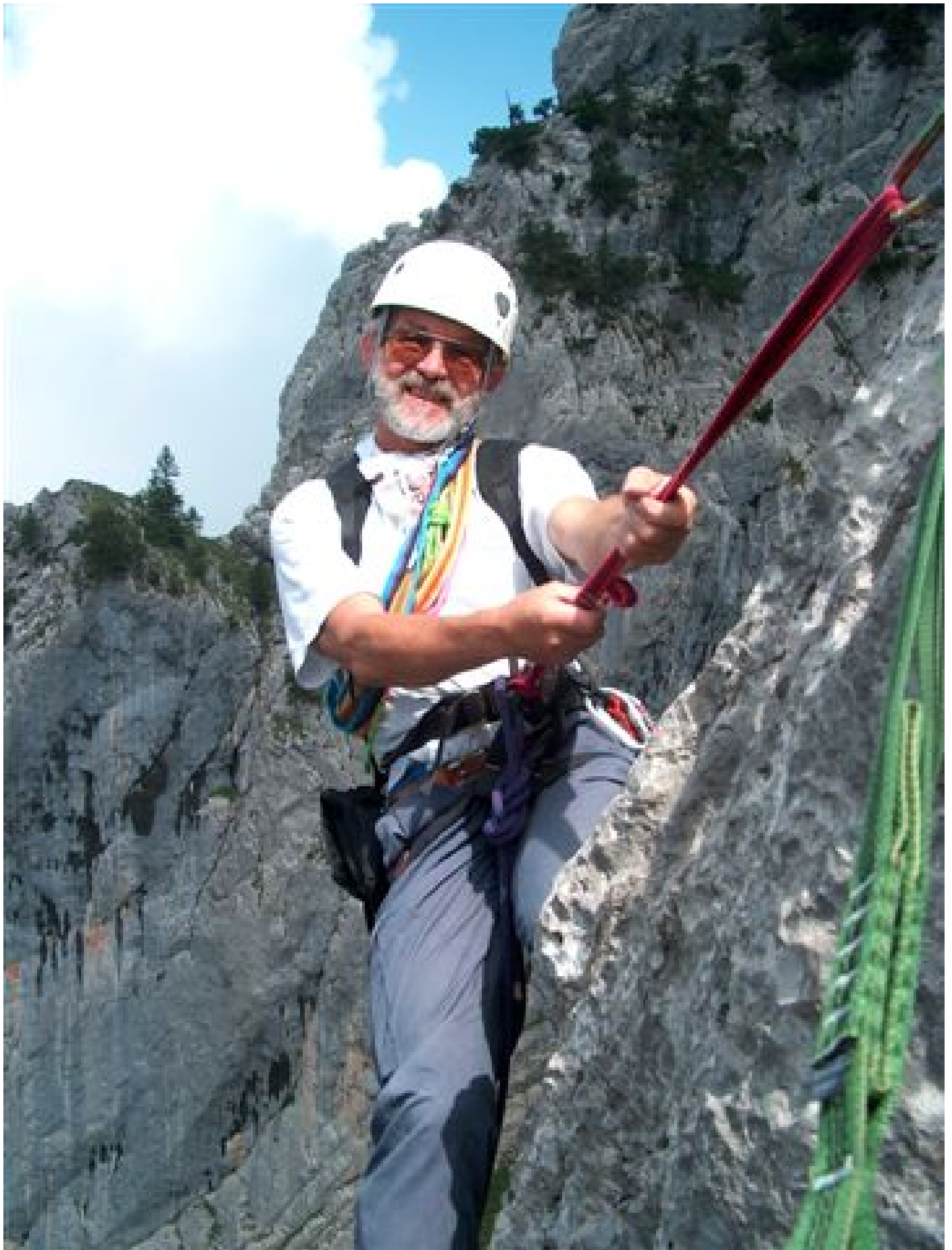
Der Photograph (am Bockmattli).