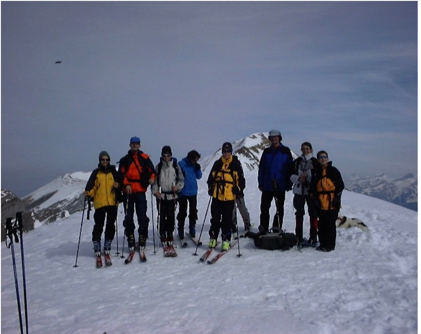
Auf dem Gipfel hat ein junger Steinadler den Hund erspäht. Doch ist er ihm ein wenig zu gross, und zu viele Zweibeiner stehen in eigenartiger Formation um ihn herum.