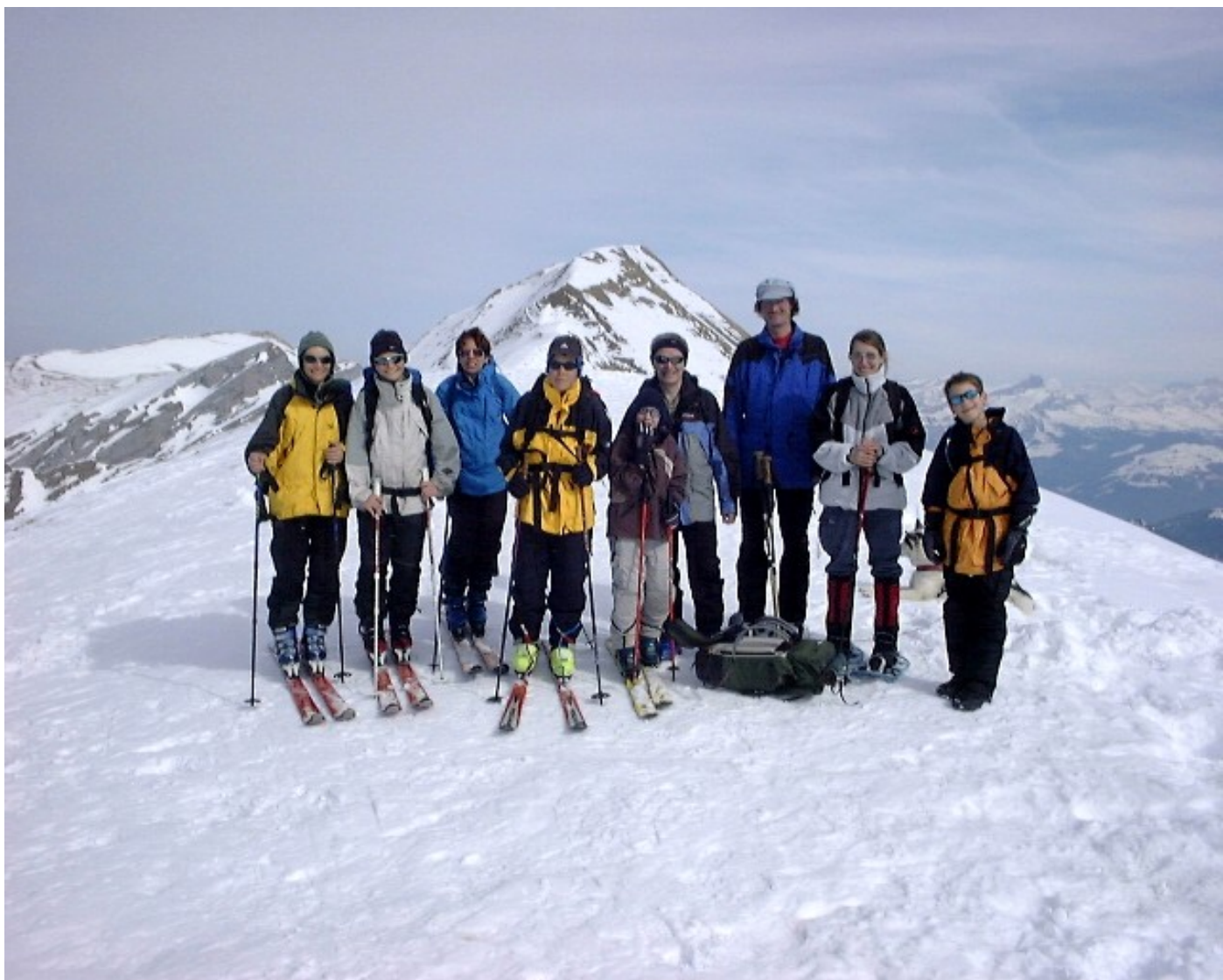
Und noch ein Versuch. Man beachte das herrliche Panorama und den Blick hinunter zum Urnersee.