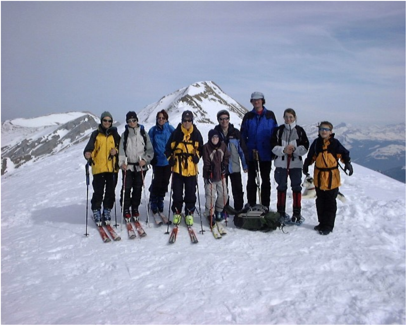
Noch eine Gipfelphoto, nun mit Photograph und Sohn.