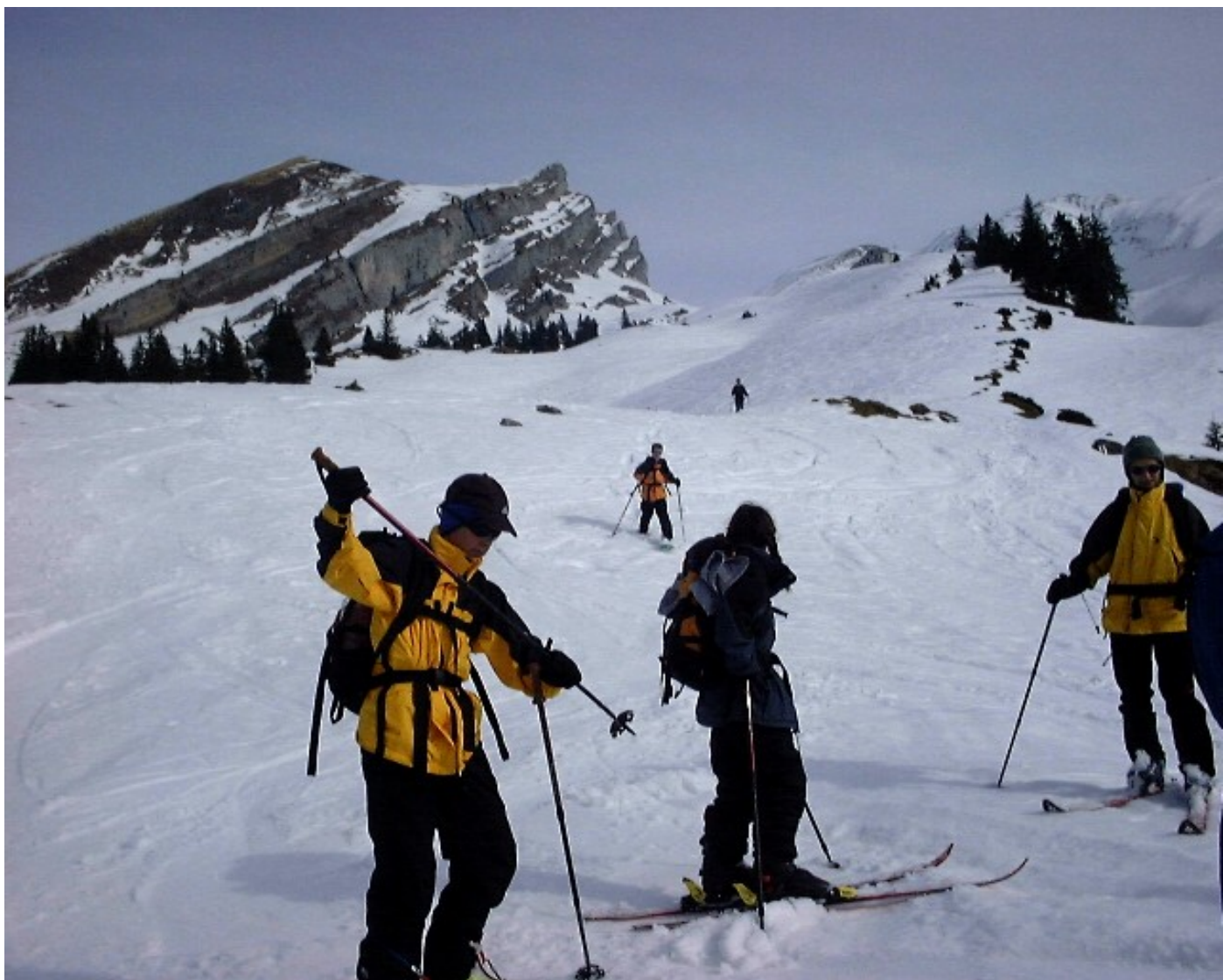
Die Schneeschuhpringer zeigen, wie es auch geht. Ganz ohne Probleme mit Harsch!