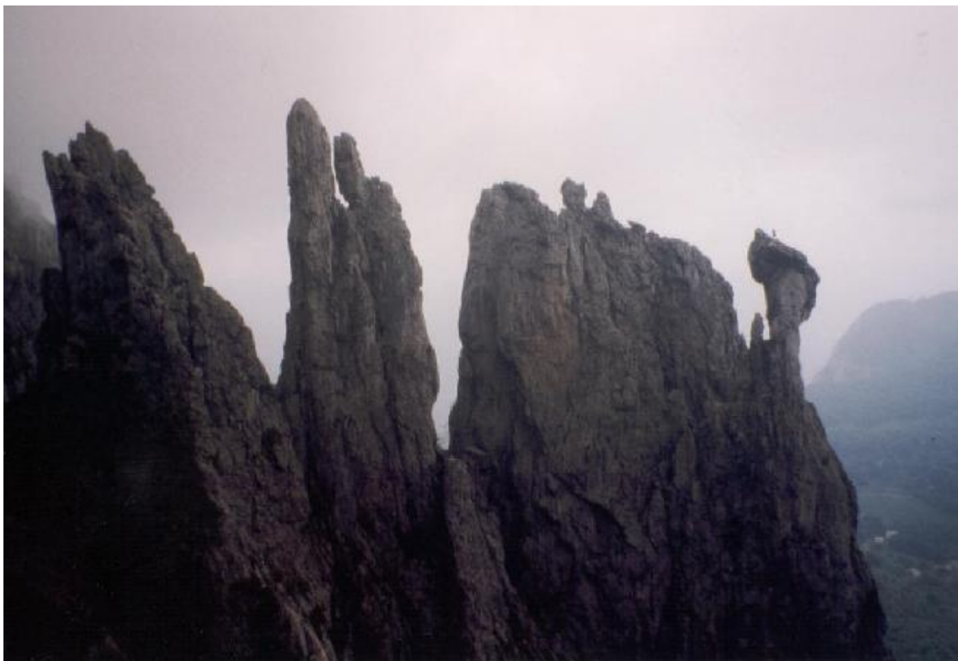
Oben Wolken, unten Sonne. Silvan am Stand auf dem Fungo.