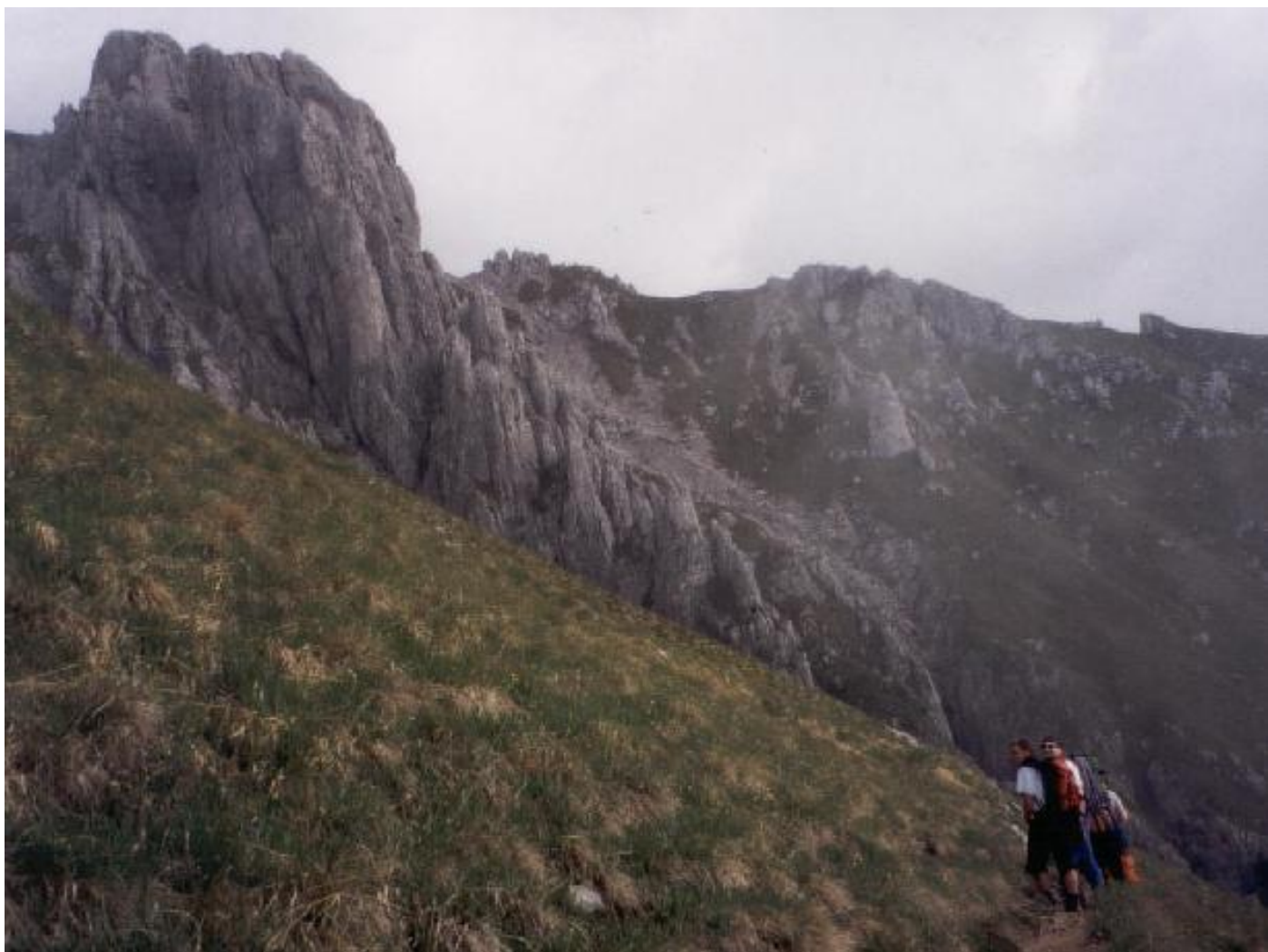
Auf dem Weg zum Sektor Magnaghi.