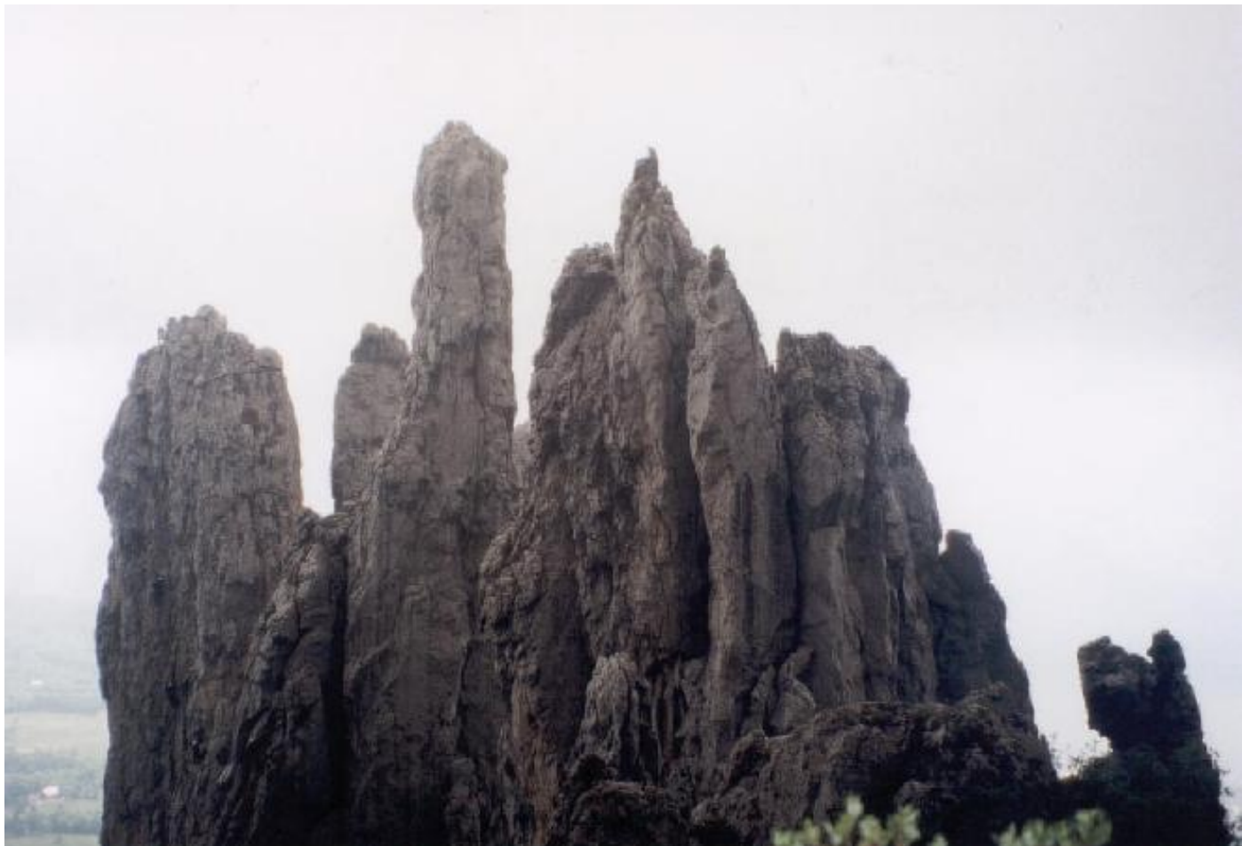
Gruppe Fungo: Silvan am Stand oben mit Roland im Nachstieg.