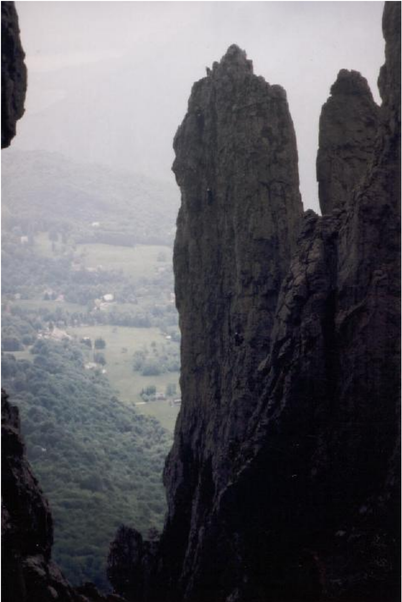
Ein paar Klettermeter weiter.