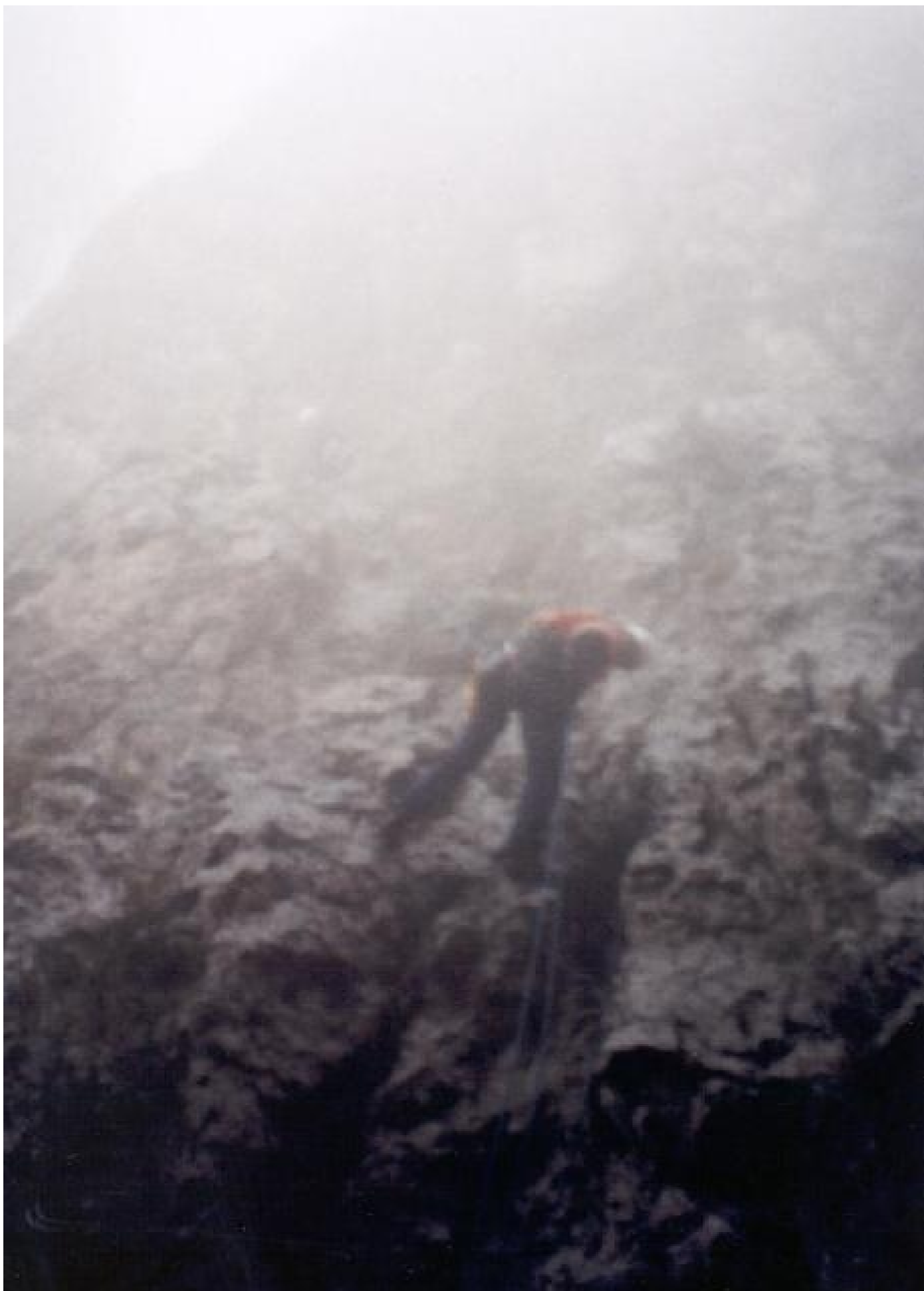
Wo wir leider blitzschnell abseilen mussten. Hagel, Blitz und Donner (noch einmal)!