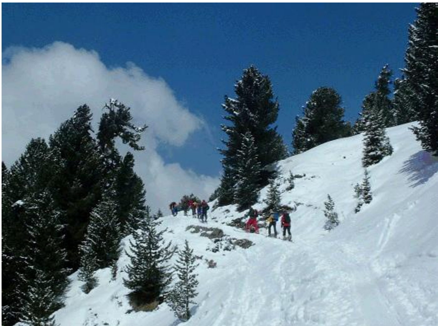
Aufstieg durch den Wald oberhalb Sertig-Dörfli Richtung Tällifurgga.