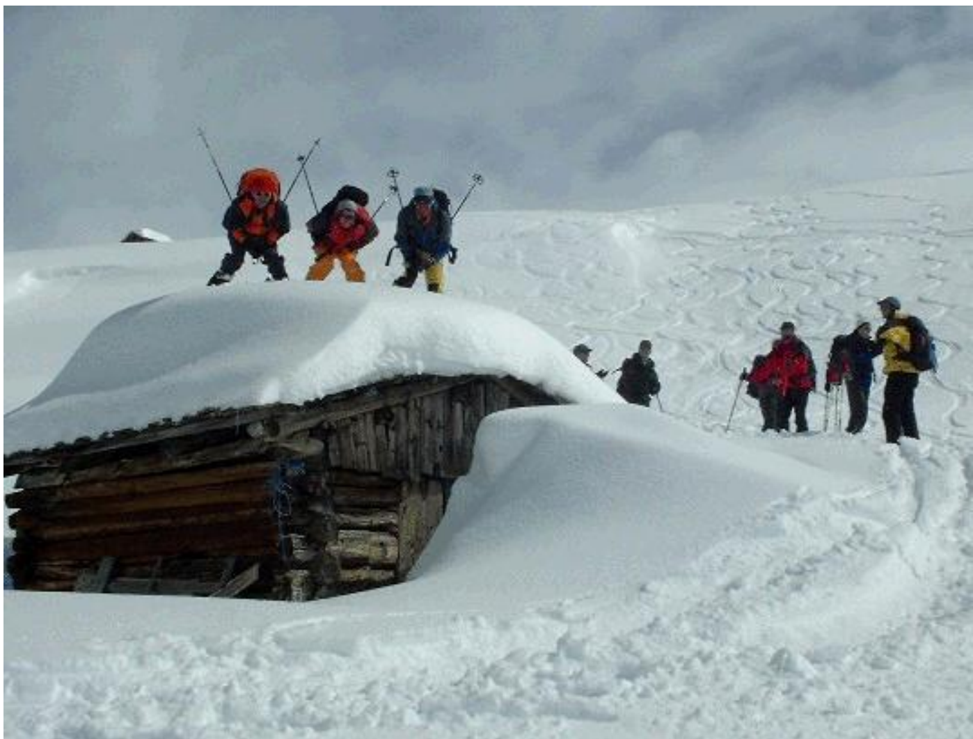
Bei den Bedingungen wird man halt übermütig...