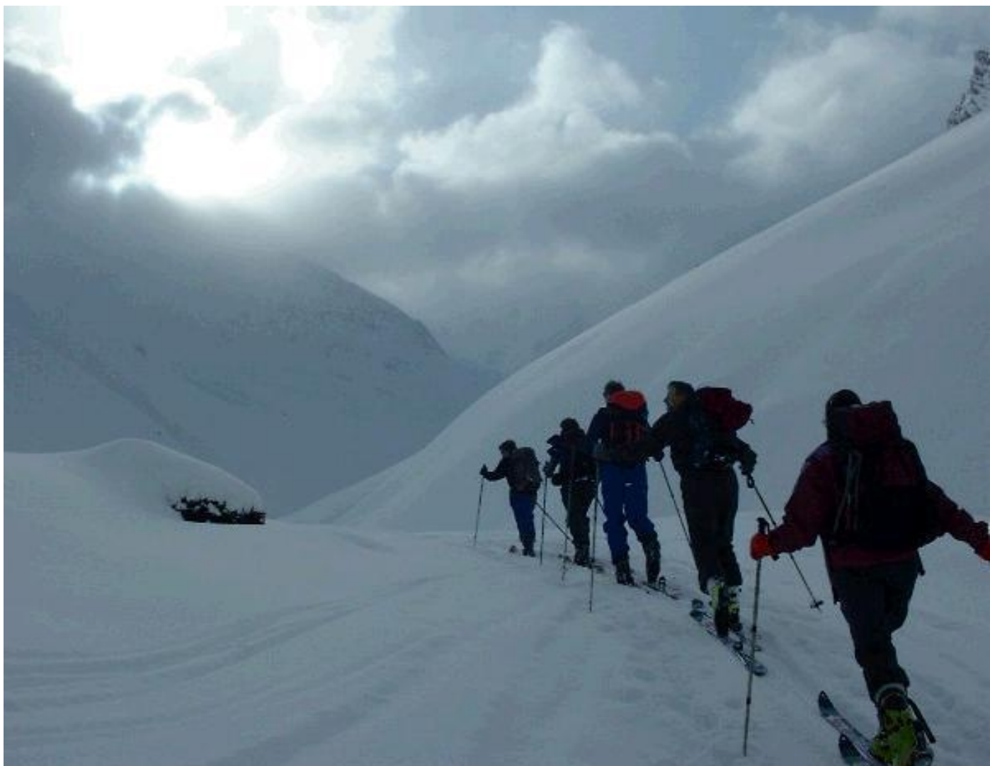
Durch ein steiles Couloir Richtung Gfrohrenhorn.