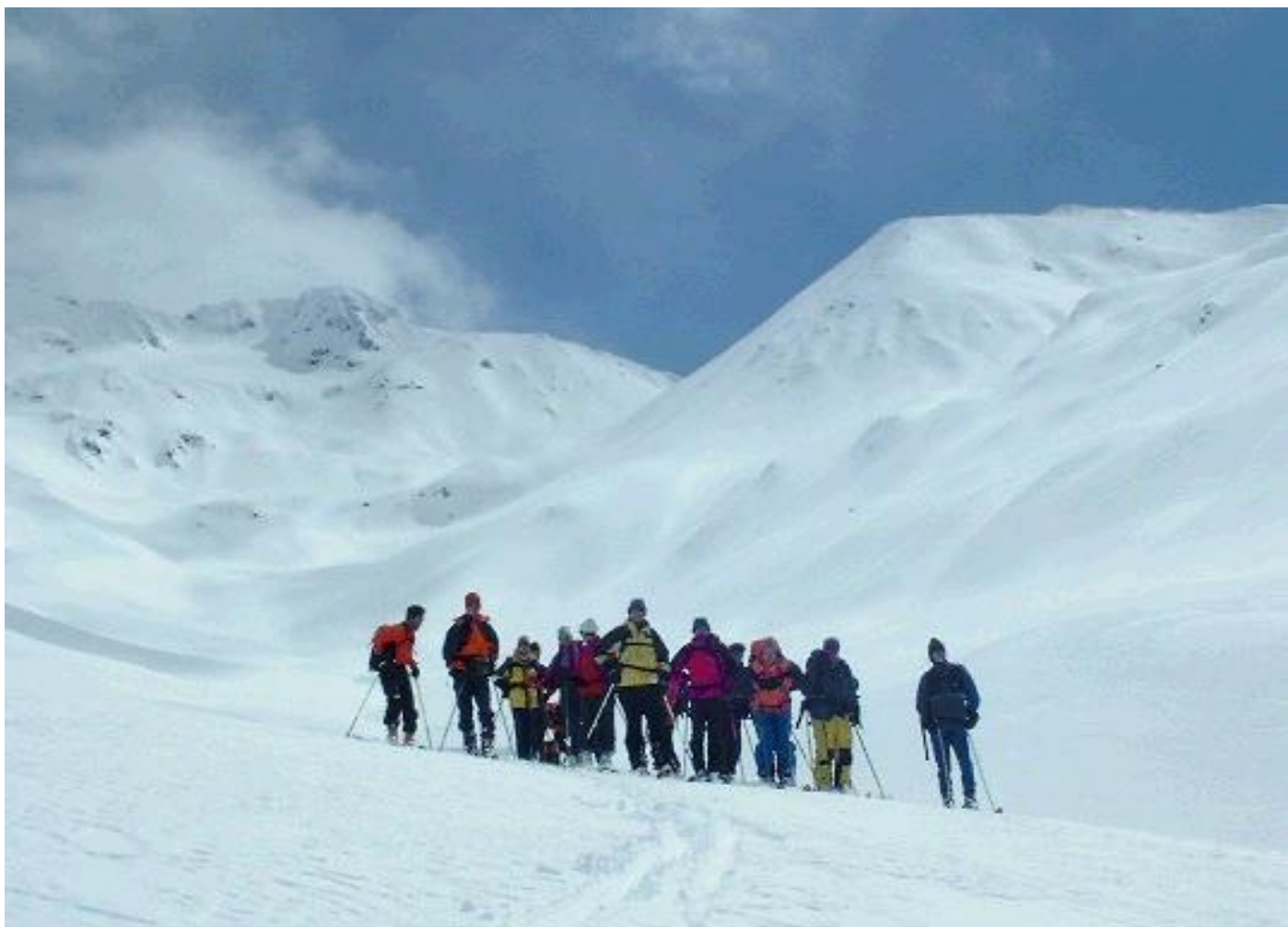
Und ein Gruppenföteli zum Schluss.