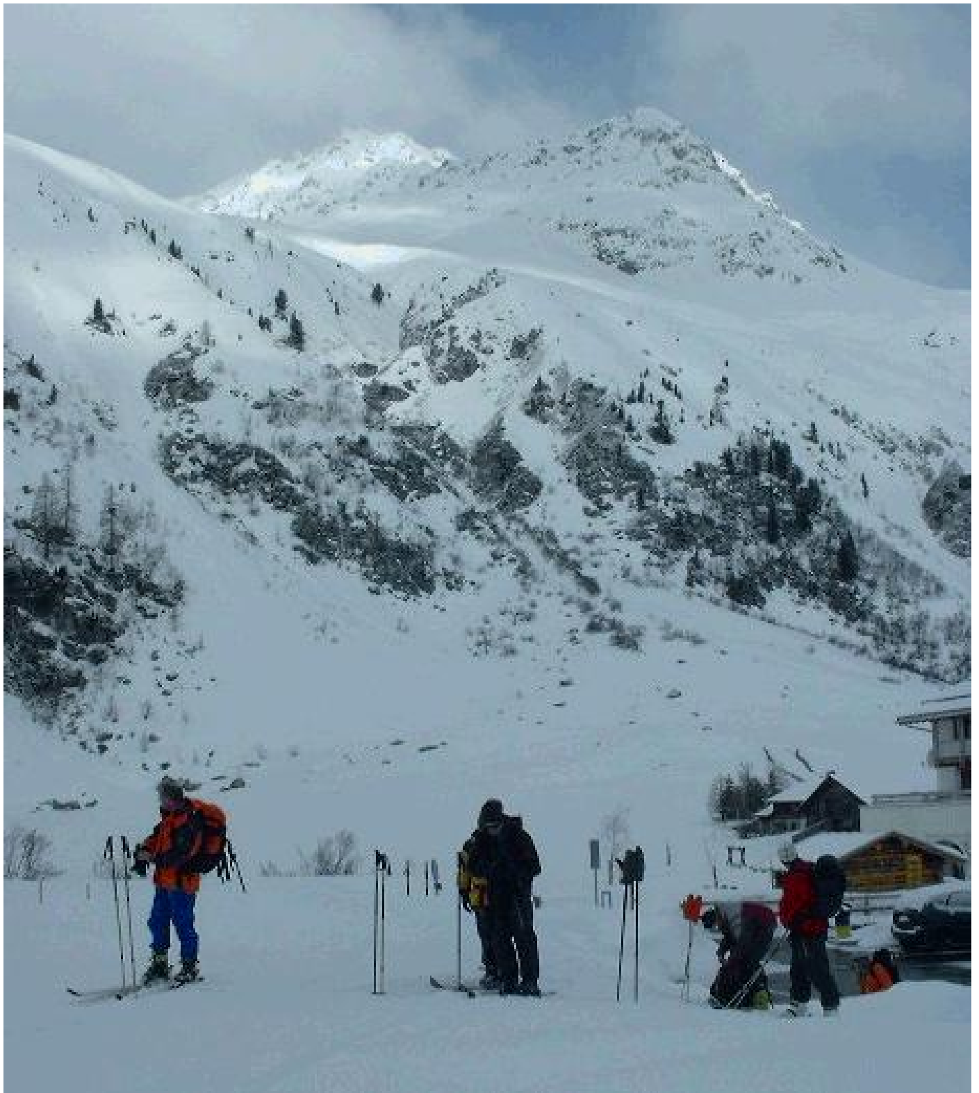
Frühmorgens beim Abmarsch.