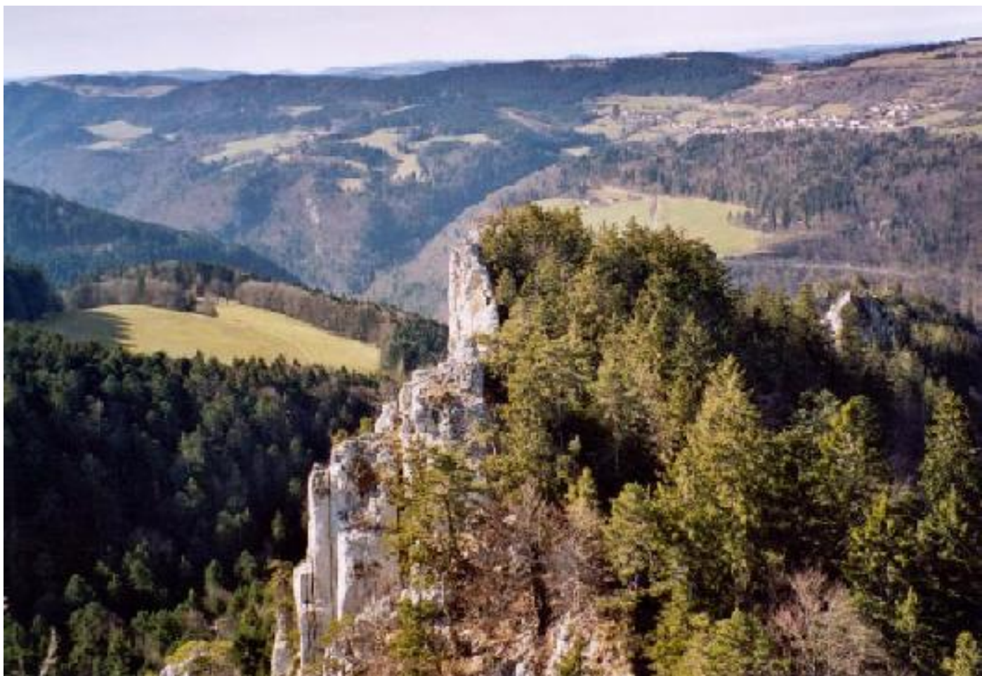
Nach einem kühlen Bier auf dem Gipfel nahen die nächsten auf dem Grat.