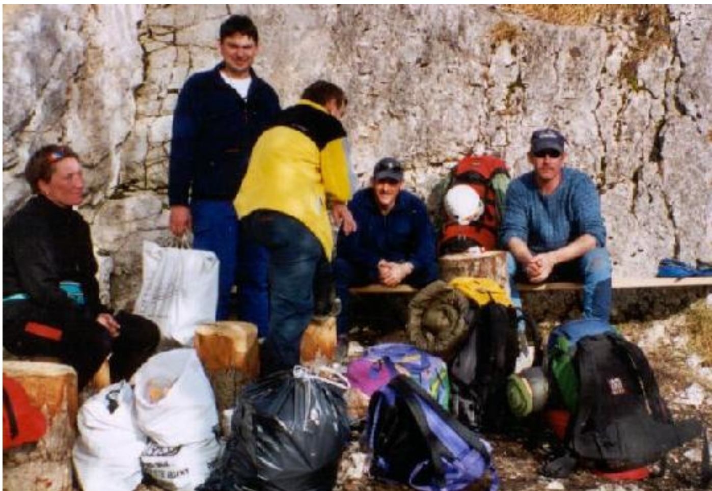
Sonntag nachmittag; zusammenräumen und nach Hause fahren. Adieu schönes Wetter.