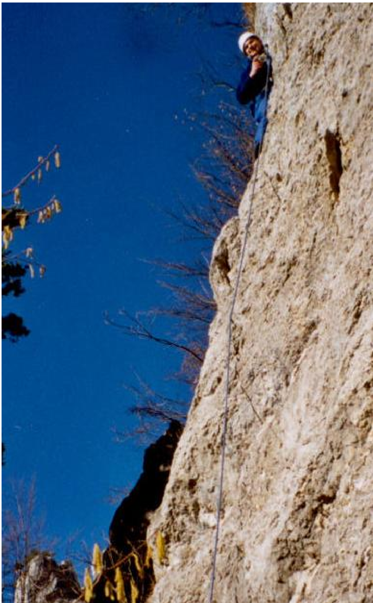
Roland stolz am Stand ("bin ich wirklich da hochgekletter?").