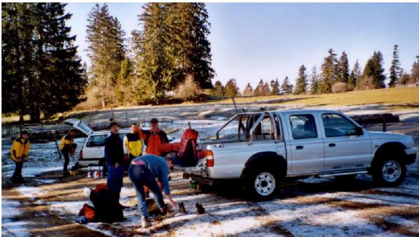
Ankunft in Le noirmont: Ein bisschen frisch.