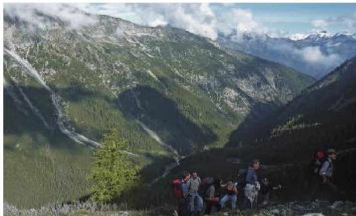
Aufstieg von der Chamanna Cluozza zum Murtersattel