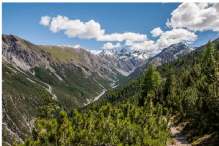
Blick von Fops in die Val Cluozza. Hinten Piz dal Diavel