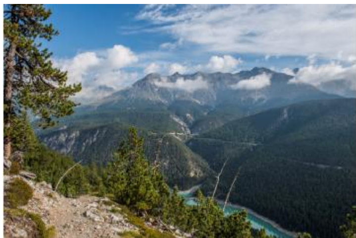
Eintauchen in den Bergföhrenwald Richtung Spöltal