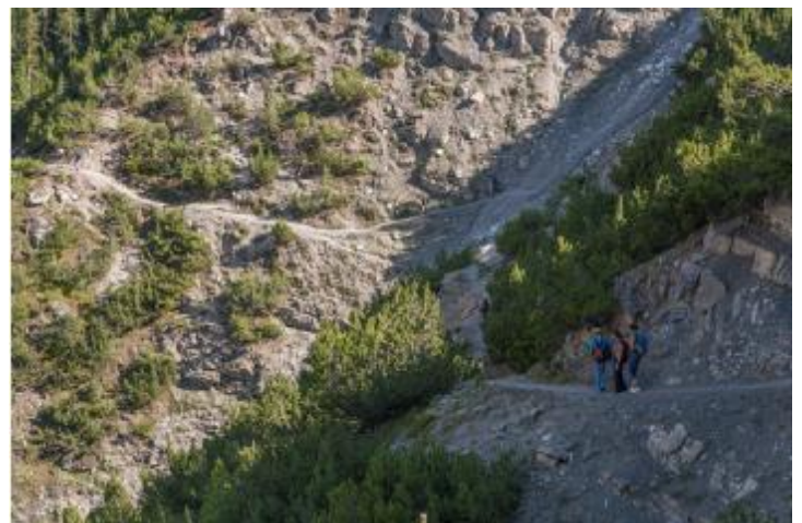
Abstieg von Fops ins Cluozzatal