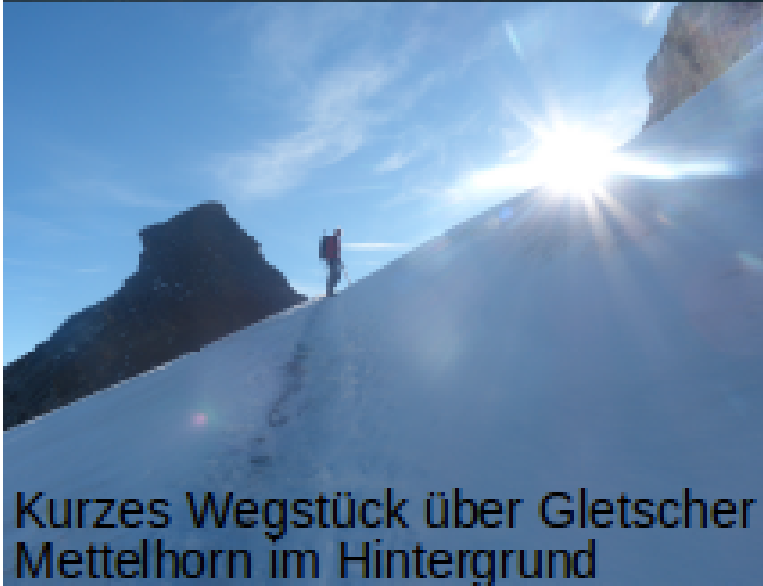
Kurzes Wegstück über Gletscher Mettelhorn im Hintergrund