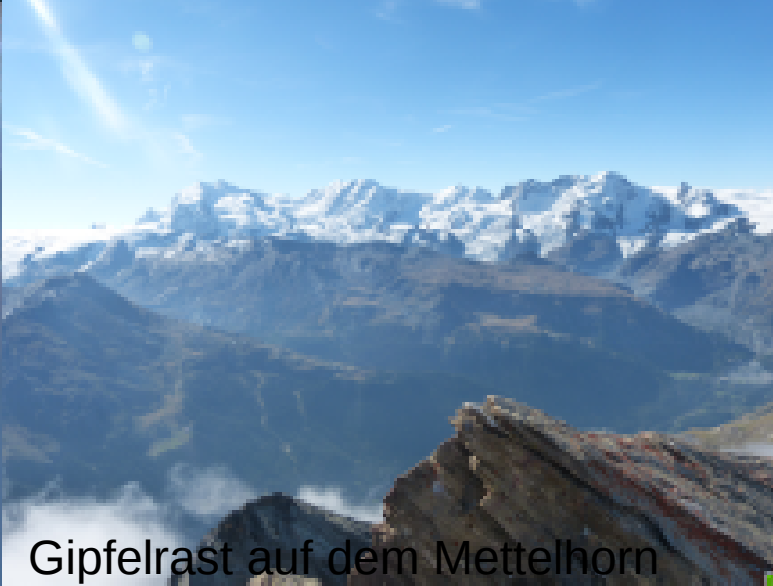
Gipfelrast auf dem Mettelhorn