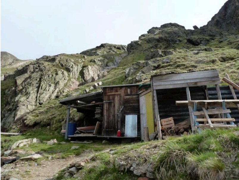
Bild mit neuem Container