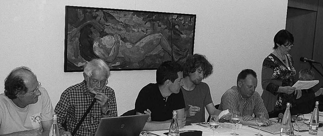
Oben: Der Vorstand vorne am Tisch. Unten: Die drei Tische waren voll besetzt.